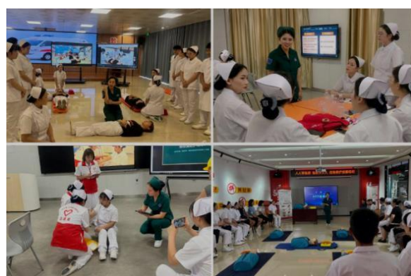
图 29：《急救护理》团队教学实录现场