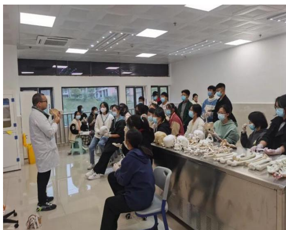
图 26：《正常人体结构》课程“理实一体化”教学现场