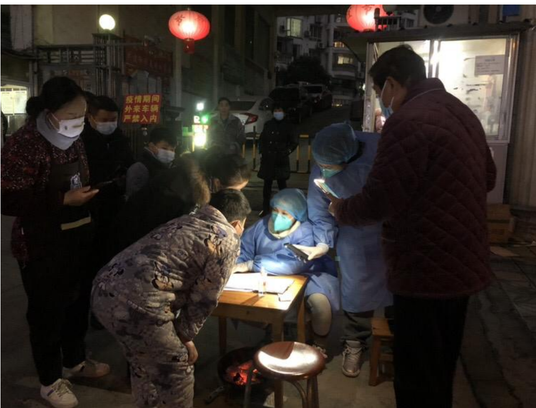
图 44：贵州健康职业学院师生积极投身抗疫行动