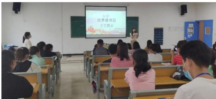
图 11：学生在活动中进行才艺展示