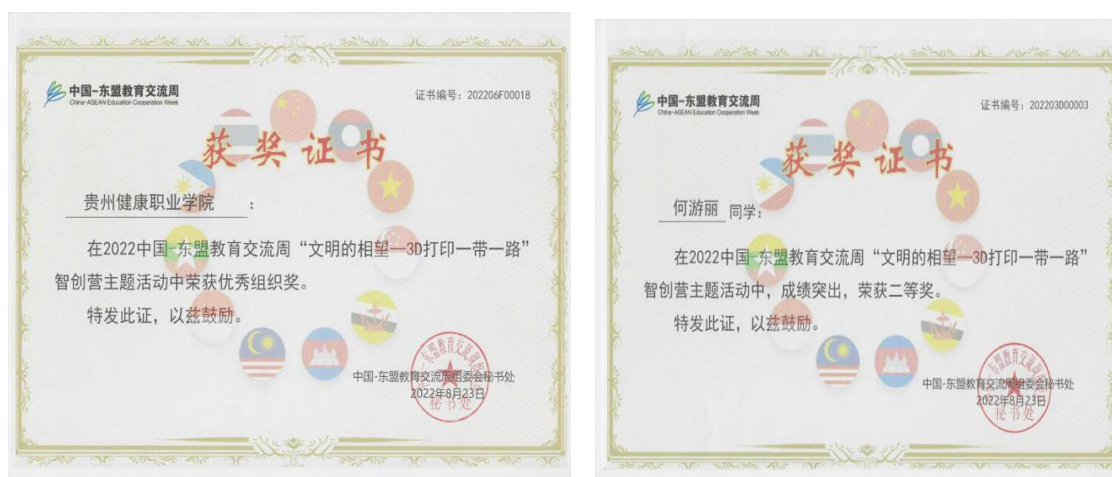
图 32： 学院在中国-东盟教育交流周活动中获优秀组织奖