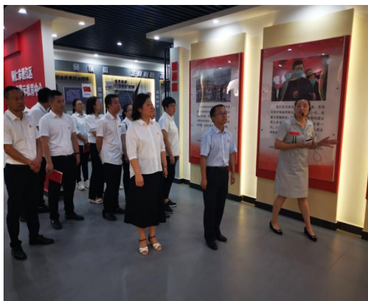
图 4：学院人文基础部党支部参观学习

人文基础部党支部作为学院党委直属支部，始终秉承“厚生”理念，认真贯彻落实党的教育方针，牢记立德树人根本任务，践行为党育人、为国育才的初心使命。三年来，人文基础部党支部在学院党委的坚强领导和各级部门的支持帮助下，积极探索党建与教学业务相融合，围绕“两化”示范点创建主线，聚焦“队伍建设、课程建设、科研建设、学生成才和内涵建设”等五个方面，着力塑造“琢玉·人文”品牌特色，培养素质技能型人才。支部始终引导全体党员立足岗位、担当作为、干事创业，积极助推学院高质量发展，全力服务铜仁“一区五地”建设。