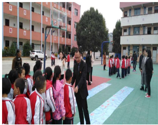
图 5：学院人文基础部党支部赴碧江区第三十三小学志愿服务