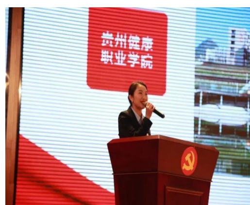
图 7：学生代表深情演绎“万言家书” 图 8：教师代表作为“身边的榜样”发言