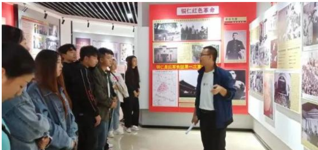
图 6：学院学生在思想政治教育基地上思政课

题选择、完善工作机制、强化成果运用，畅通扩大青年政治参与渠道。引导青少年在实践中增强中国特色社会主义制度自信。