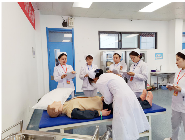
图 19：学院护理系学生备赛现场