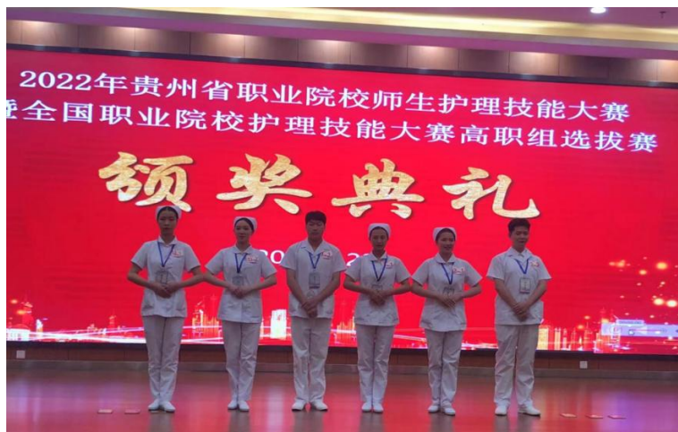
图 20：技能大赛颁奖现场