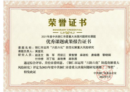
图 39：学院赵圣文同志课题获 2021 年度中共铜仁市委重大决策问题研究课题“二等奖”