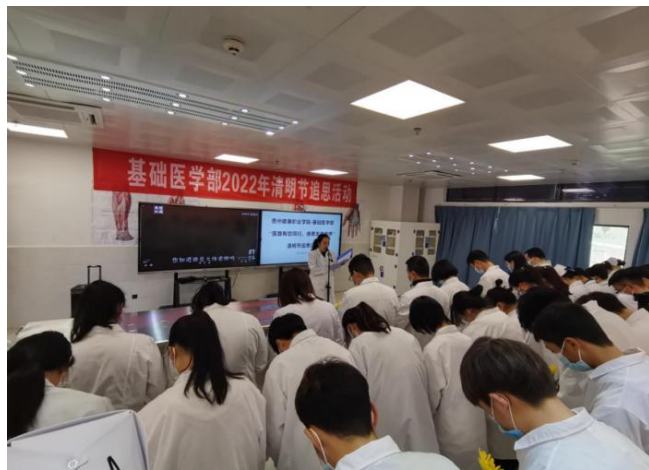
图 24：第四届中国解剖学会医学生解剖绘图大赛一等奖作品《一叶》