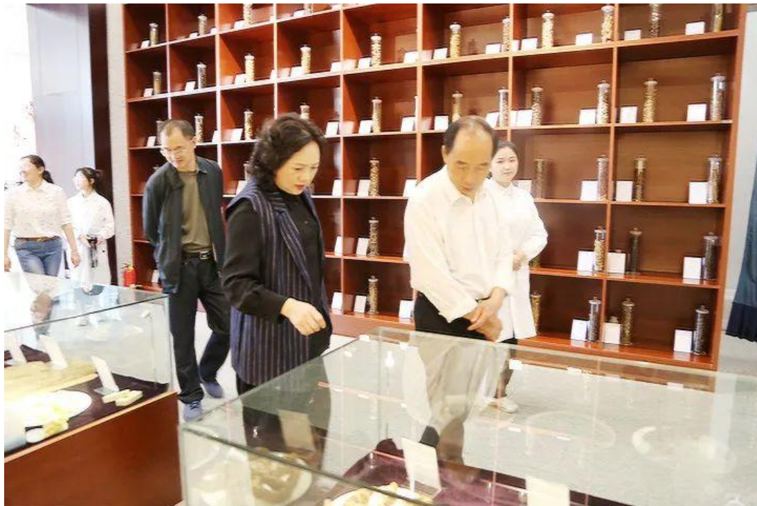
图 51：铜仁市人大常委会调研组一行参观学院民族医药展览馆