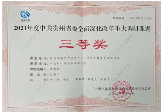
图 38：学院赵圣文同志课题获得 2021 年度中共贵州省委全面深化改革重大调研课题“三等奖”