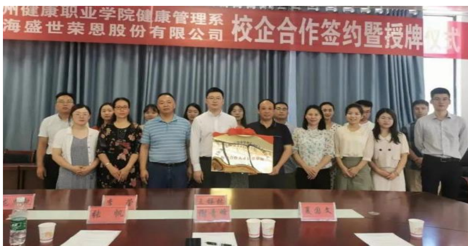
图 34：健康管理系与上海盛世荣恩医疗投资管理集团有限公司校企合作签约暨授牌仪式

学院始终坚持以人为本，聚焦社会需求和人民期待，有序推进校企合作，深化产教融合，依托学院专业优势，围绕“一老一小”紧缺专业开展社会从业人员培训，持续保持与人社、民政、卫健等行业主管部门合作，开展养老护理员、社会医疗机构护理员等培训，为服务行业企业增值赋能。自2021年以来，学院健康管理系与上海盛世荣恩医疗投资管理集团有限公司、广东伊丽汇美容科技有限公司、南京允和企业咨询管理有限公司签订了人才培养订单协议，合作开办订单班，实现了校企资源优势互补，合作共赢。