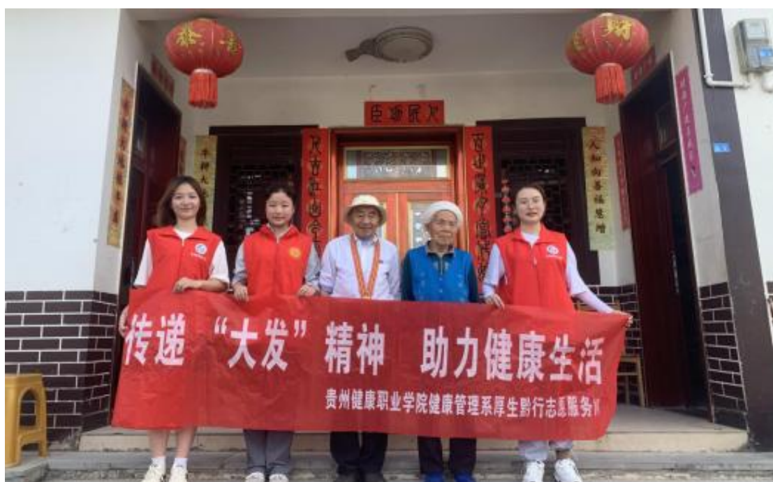
图 49：黄大发与贵州健康职业学院志愿者合影

“听党话，跟党走！”在交谈过程中，黄大发多次向志愿者们强调。临别之际，他寄语青年学子们要将汗水挥洒在祖国需要的地方，要有责任心、有青年担当，不忘初心，做一个善良的人，乐于奉献的人。