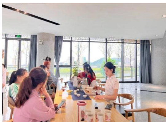
图 14：大学生茶艺社活动