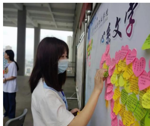
图 10：学生写下“心系文字，情寄三行”寄语