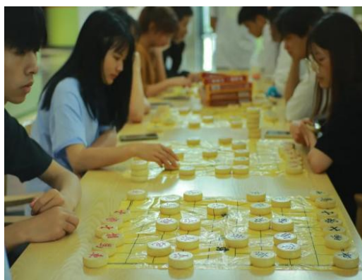
图 15：大学生棋艺社活动