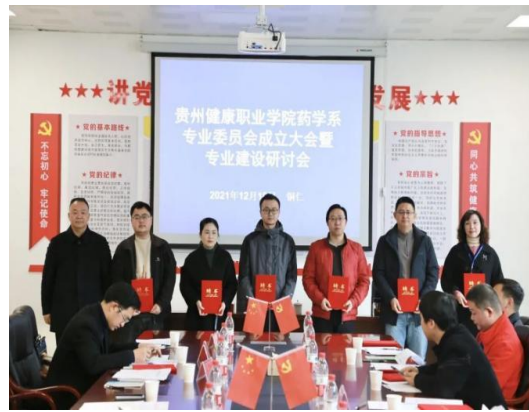
图 22：药学系为企业专家颁发聘书