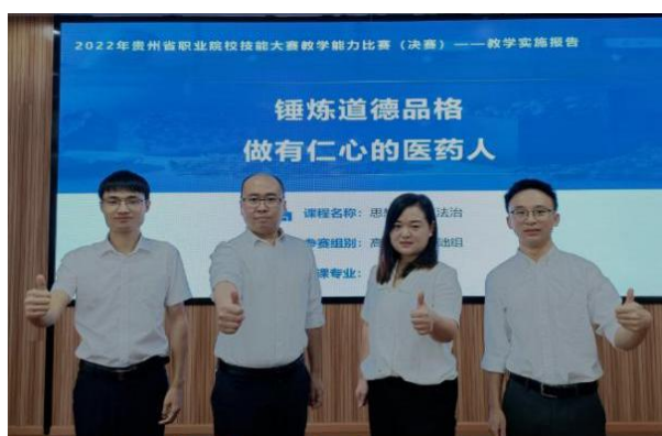
图 28：《思想道德与法治》团队决赛汇报现场

近年来，学院以各类赛事为平台，始终坚持“以赛促教、以赛促研，以赛促建、以赛促改”思路，鼓励教师运用信息化手段优化课堂教学，积极参加各级各类教学比赛，在赛事中磨砺品质、提升能力，努力提高人才培养质量，构建职业教育教学质量持续提升的良好教育生态。