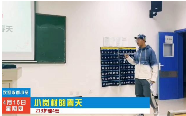
图 23：学生排练思政课情景剧

马克思主义教学部持续推进思政课改革创新，提升思政课堂活力，努力把思政课打造成有风格、有引领、有品质，学生喜欢、有获得感的高质量课堂。