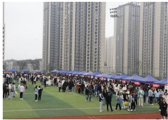
图 16: 2022 届毕业生招聘会启动仪式