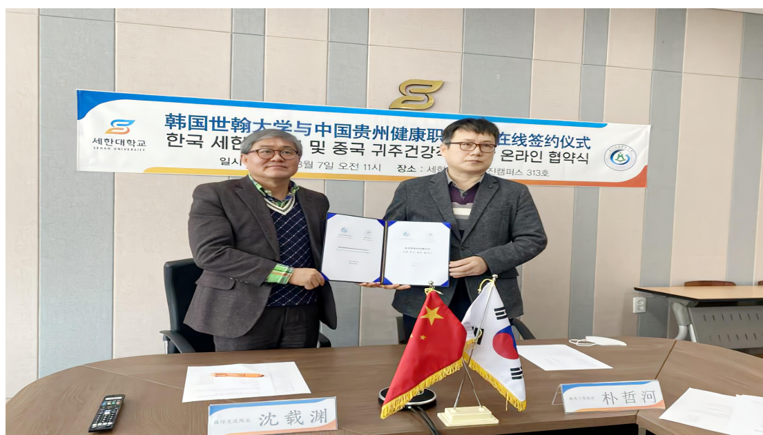
图 31： 学院与韩国世翰大学线上签约仪式（韩方现场）