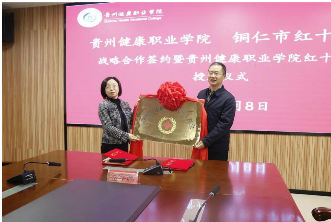
图 48：贵州健康职业学院红十字会授牌仪式