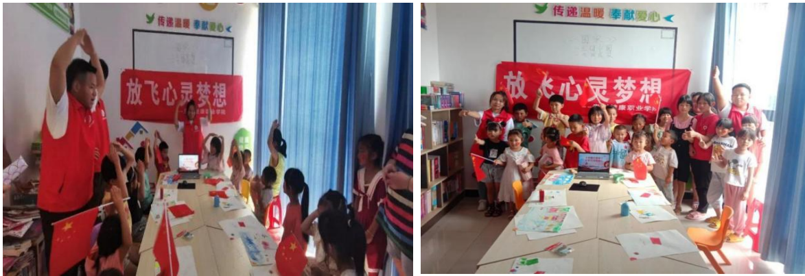
图 46：志愿者们耐心认真地教小朋友手语传唱红色歌曲《国家》

2022年7月2日，贵州健康职业学院“情暖童心·相伴童行”志愿服务队在铜仁市玉屏县朱家场镇街上村移民安置点开展“乡村振兴青春行，红歌传唱暖童心”为主题的志愿服务活动，以耐心认真的态度对待每一位小朋友，将真诚与热情熔铸在红歌传唱中，献礼建党101周年，激发孩子们的爱国热情，汲取红色力量，传承红色基因。