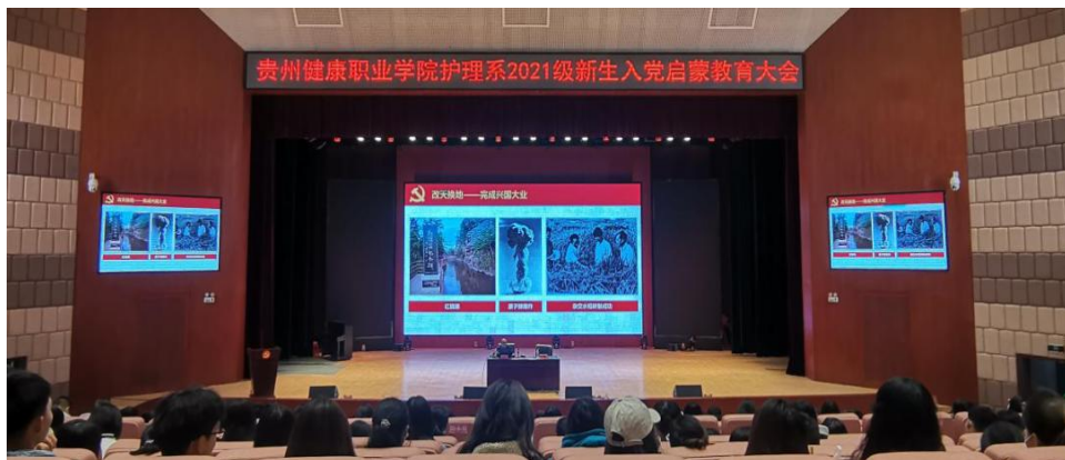
图 3：学院护理系举行 2021 级新生入党启蒙大会

一是谋融合——擦亮党建品牌，夯筑高质量发展“硬基石”。学院人文基础部党支部“琢玉·人文”党建品牌获“2021年度省委教育工委党建工作创新最佳案例”，并被省委组织部命名为“全省党支部标准化规范化建设示范点”，护理系教工党支部“一核两翼创五星，乘风展翅逐日新”党建品牌荣获“2021年度省委教育工委党建工作优秀案例”在全省高校推广交流。二是深融合——党建引领思政，拓宽立德树人“大视野”。学院将发展学生党员工作的关口前移，每年举办入党启蒙教育大会，引导学生坚定人生理想，2021年有692名学生提交入党申请书。三是广融合——党建聚合业务，激发内涵发展“新活力”。2022年初，学院成功申报国控中医学专业，学院专业数量增加到13个。建立“把专业创新创业人才培养成党员，把党员培养成专业创新创业人才”的“双培”运行机制。