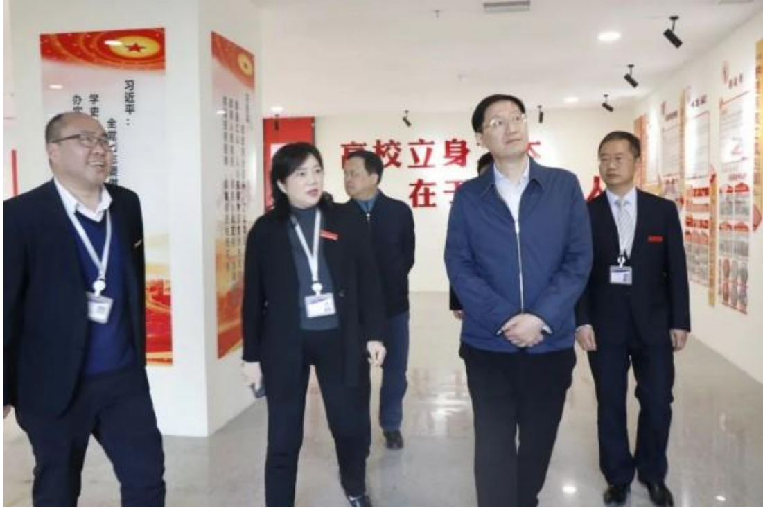
图 50：省教育厅厅长邹联克一行参观学院思想政治教育基地