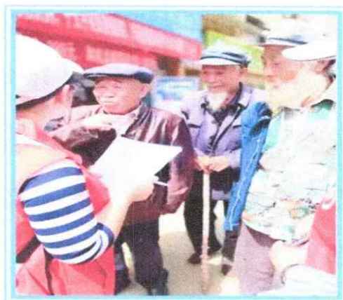
贵州工商职业学院官方

案例 7：学校现代商务分院开展“学会绿色理财，防范金融诈骗”暑期三下乡社会实践活动