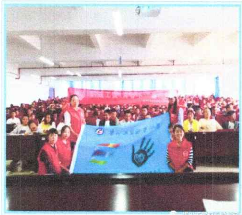
贵州工商职业学院官方