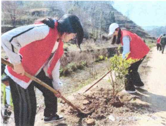
图一 活动中学生认真种树