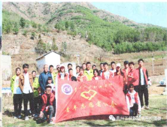
图二 活动结束后合影留念

案例 4：4 月 22 日是第 53 个世界地球日，威宁县委宣传部组织威宁县青年创业者联合会、威宁县疾控中心、贵州工贸职业学院部分学生代表走进草海，开展新时代文明实践志愿服务活动，共同学习环境保护科普知识。