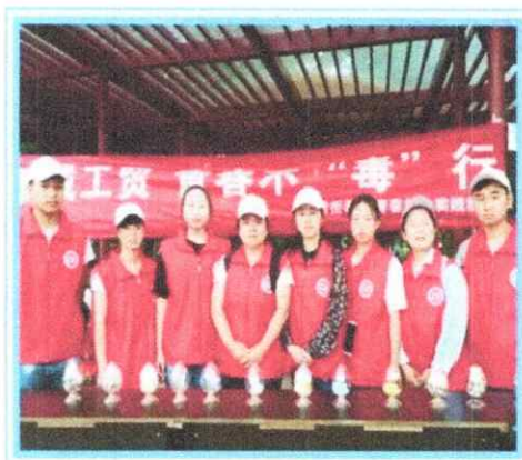
贵州工商职业学院官方