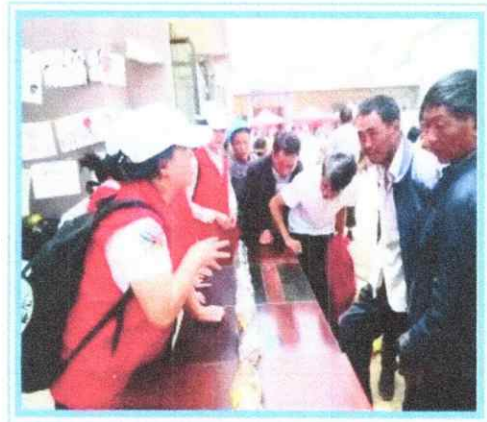
贵州工商职业学院官方