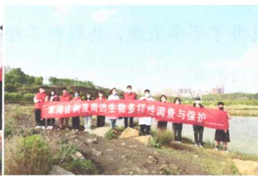
图二 活动结束后拍照合影留念