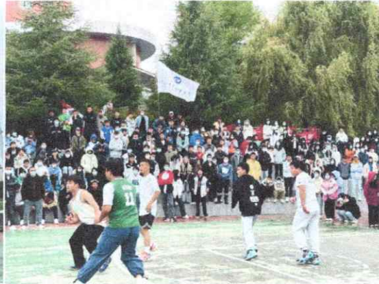
图二 现场师生激烈比赛中

案例 2：为深入贯彻落实疫情防控的工作要求，同时丰富学校学生精神文化生活，学校拟以“喜迎二十大·奋进新征程”为主题，迎接和学习宣传贯彻党的二十大为工作主线，以学习宣传贯彻新国发 2 号和《推动毕节高质量发展规划》文件为重要内容，精心策划开展深入有效、内容新颖、贴近新时代大学生的主题宣传教育和实践活动，着力深化党的基本理论、基本路线、基本方略教育，带动学生在实践中增强本领、服务发展、培育情怀，把个人奋斗融入乡村振兴伟大战略中，由学校团委主办，社团联合会和学生会承办，于 2022 年 10 月 17 日举行“喜迎二十大·永远跟党走”系列主题活动之红色经典诗歌朗诵比赛