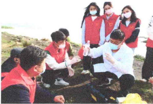
图一 工作人员现场鼓励学生亲自动手参与对草海水质进行多项指标检测

案例 4：4 月 22 日是第 53 个世界地球日，威宁县委宣传部组织威宁县青年创业者联合会、威宁县疾控中心、贵州工贸职业学院部分学生代表走进草海，开展新时代文明实践志愿服务活动，共同学习环境保护科普知识。