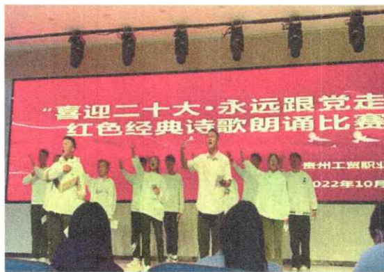
图三 诗歌朗诵比赛现场图