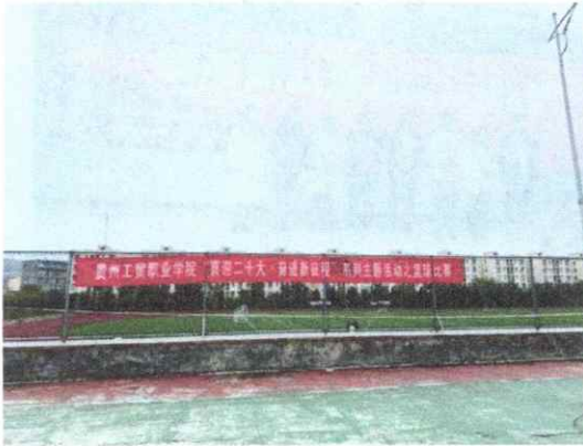
图一 “喜迎二十大·奋进新征程”系列主题活动之篮球赛