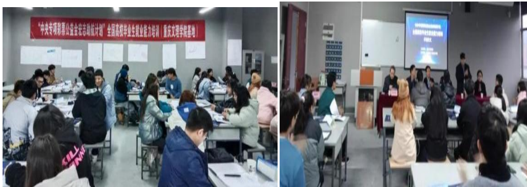
图 2 就业能力培训现场