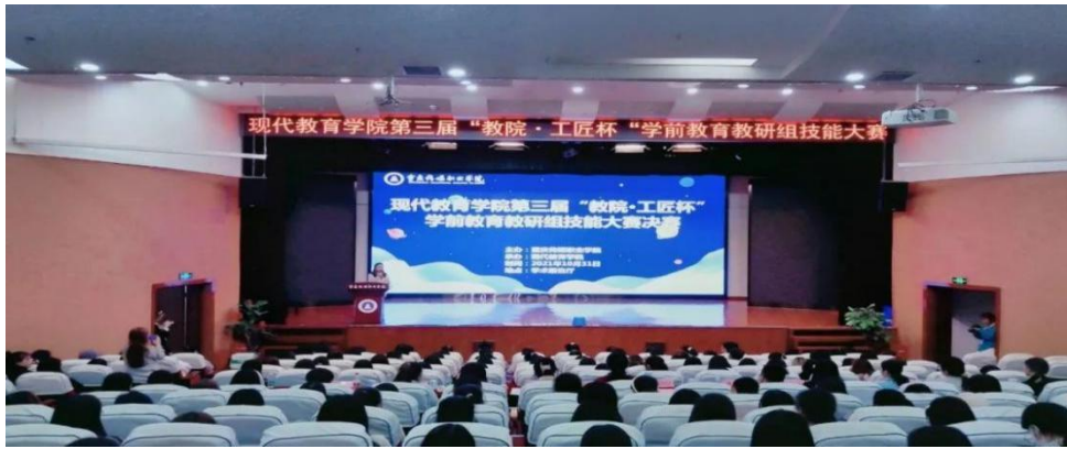
图 4 活动现场照片

经过层层选拔，最后有 10 名选手进入决赛。大赛从幼儿园教育活动设计与说课、歌曲弹唱、故事讲述、儿歌表演等几方面综合考核学生的专业素养和综合能力。