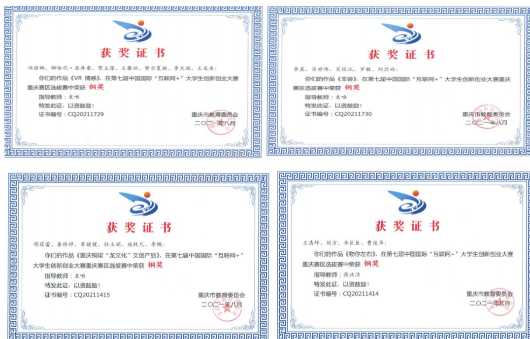
图 3 创新创业大赛获奖证书

9月17日,重庆市教育委员会公布了第七届中国国际“互联网+”大学生创新创业大赛重庆赛区选拔赛表彰文件。来自学校经济与管理学院、现代教育学院的四个项目:《VR情感》《非尝》《重庆铜梁“龙文化”文创产品》《物你左右》获得铜奖,创历史新高。