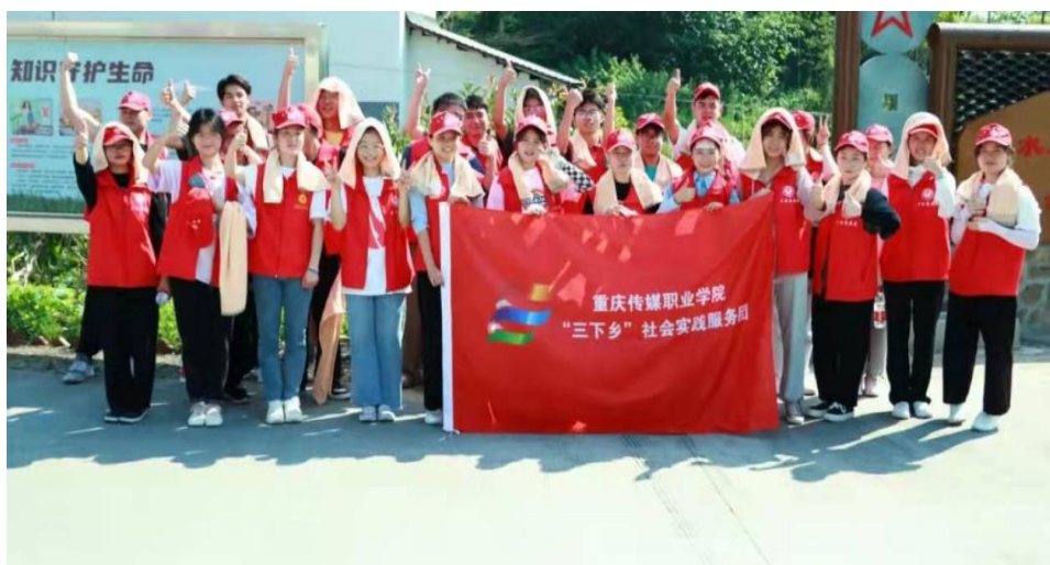
图 11 “三下乡”社会实践现场合照

参与乡村建设。7月14日—15日，“共建美丽乡村 践行服务意识”我为群众办实事乡村振兴实践团走进铜梁区西河镇双永村进行为期两天的“三下乡”社会实践。队员们在双永村通过现场采访、实地调研相结合的方式就当地现实问题进行调研，调研的同时帮助当地村社清扫街道、铲除杂草，为促进乡村环境建设，共建人与自然和谐共生贡献青春力量。