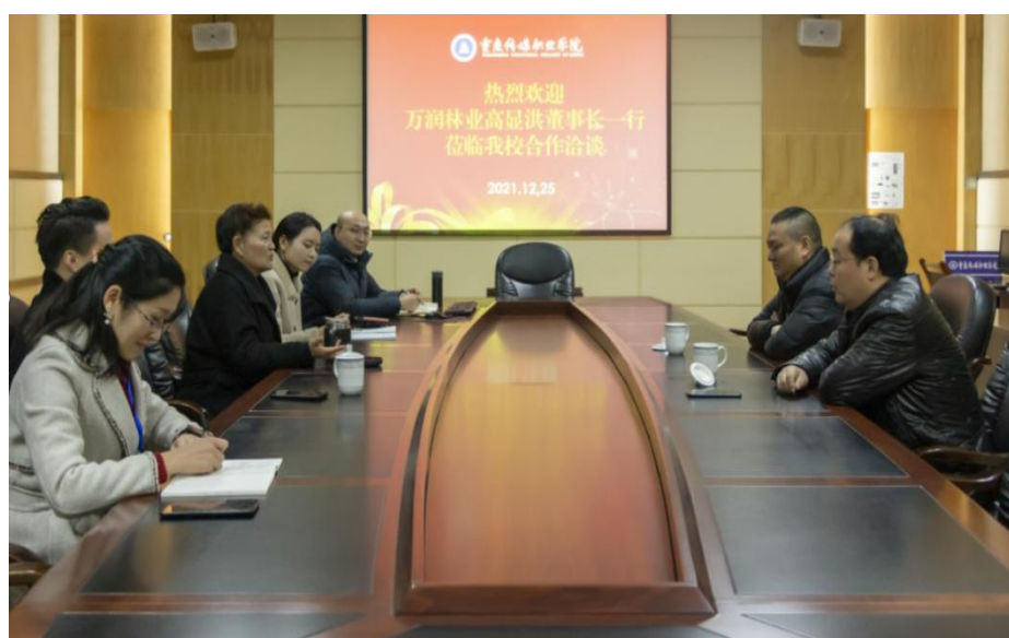
图 10 校企合作康养项目会议现场

2021年12月24日，《中共中央国务院关于加强新时代老龄工作的意见》明确提出“积极培育银发经济”。近年来，伴随生活水平的提高和消费观念的转变，我国老年人的消费结构和消费需求发生显著变化，逐渐从生存型消费走向享受型消费，银发经济已渗透到老年人生活的方方面面，发展前景十分广阔。