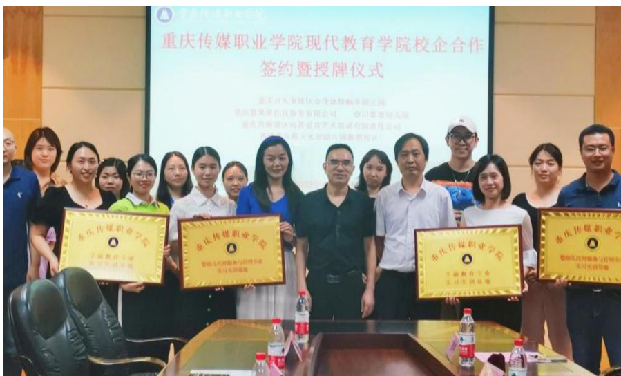
图 8 校企合作签约仪式会议现场

为进一步提升学校教育类专业的深度发展，校企融合，专业共建，提升应用型职业教育人才培养水平，2022年6月24日下午14时，“重庆传媒职业现代教育院校企合作集中签约暨授牌仪式”在学校一会议室成功举行。参与本次签约的单位有重庆金茂珑悦蜗牛幼儿园、重庆慧果果托育服务有限公司、重庆雨菁爱育艺术培训有限责任公司、香港艾乐锦天水岸幼儿园（铜梁校区）。会议由现代教育学院副院长王雪芹主持。