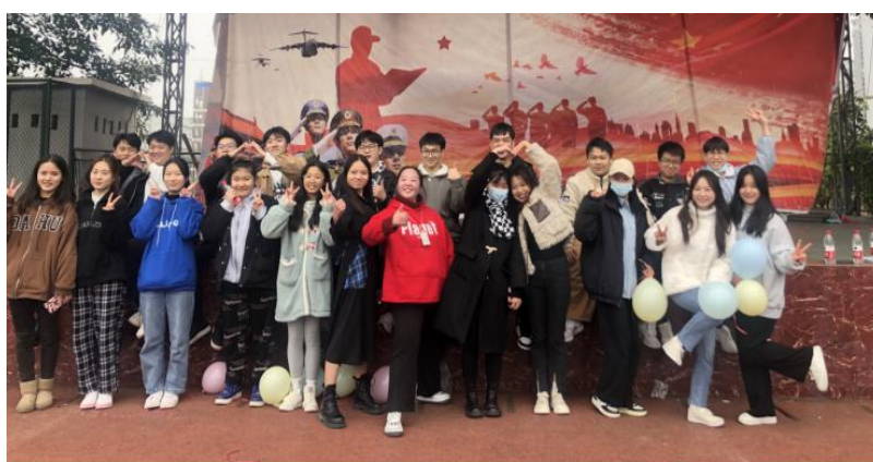
图 1 活动现场合影

为营造积极向上、健康文明的校园文化氛围，展现当代大学生积极昂扬的精神风貌，进一步增强学校团学干部的团队协作能力和身体素质，加强学生干部之间的交流合作。校团委特于 11 月 18 日中午在操场举办了团学组织素质拓展活动。本次活动面向全校所有团学组织主要负责同学。