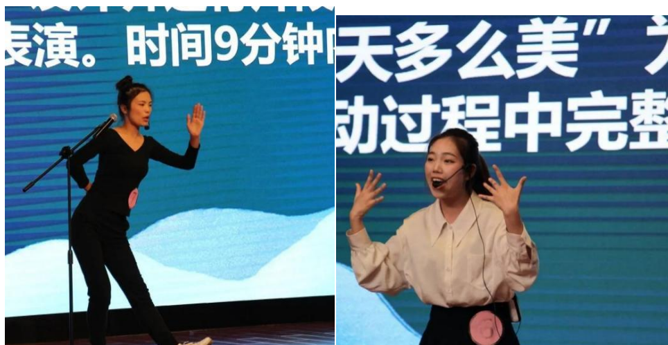
图 5 参赛选手照片

经过层层选拔，最后有 10 名选手进入决赛。大赛从幼儿园教育活动设计与说课、歌曲弹唱、故事讲述、儿歌表演等几方面综合考核学生的专业素养和综合能力。