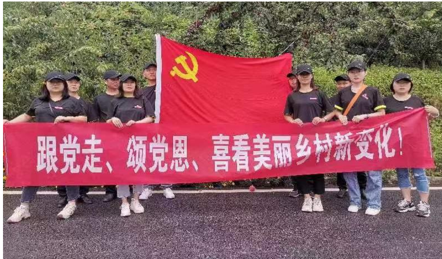
图 12 学校第四党支部活动现场合照