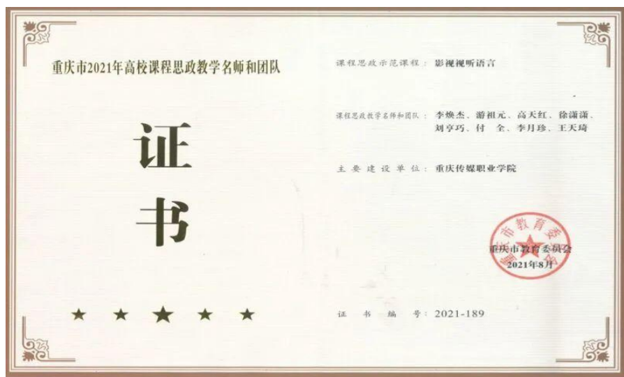
图 6 课程思政教学名师和团队证书

文件要求，各高校要高度重视课程思政建设，积极采取有效措施，充分发挥教师队伍“主力军”、课程建设“主战场”、课堂教学“主渠道”作用，强化政策配套和资源保障，进一步加强课程思政示范项目建设，高质量推进课程思政建设，构建全员全程全方位育人格局。