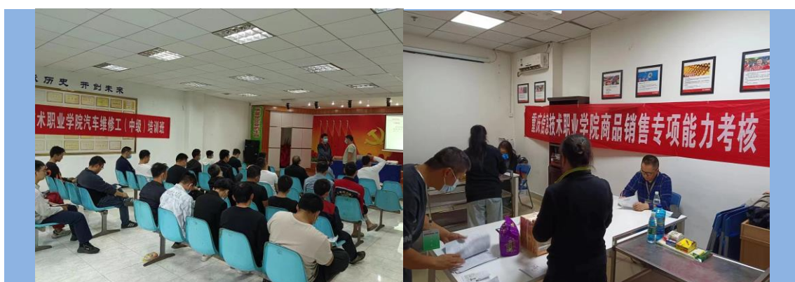
图 19 开展企业职业技术培训