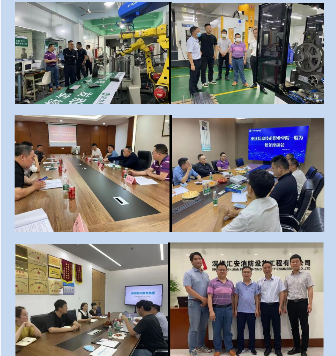
图 18 校长徐九庆博士带队到深圳、东莞的多家企业走访调研

为了推进学校分层分类教学改革，为校企融合、双元主体储备企业资源。2022 年 5 月，校长徐九庆博士带队到深圳、东莞的多家企业走访调研，了解企业生产运营情况，对接企业人才培养需求。