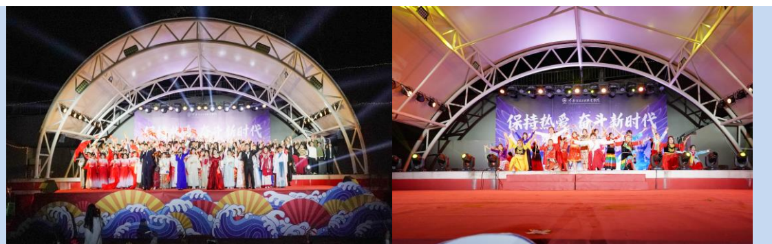
图 6 保持热爱 奋斗新时代”迎新晚会

2. 加强学生社团建设。 全面强化学生社团管理，积极开展理论学习、专业技能训练、文化娱乐、社会实践、志愿服务、体育竞技等活动。学校现有社团共 18 个，注册会员 583 人。2022 年新发展营养膳食社、足球社、模特社、学友团、播音主持社、西门少年时装社 6 个社团。举办社团文化艺术节、好久不见 live house 音乐会、重信烟火气·夜市大趴体等特色活动 15 项。积极开展校园文化活动，深受广大师生欢迎。学生社团成为复合式人才培养的重要平台。