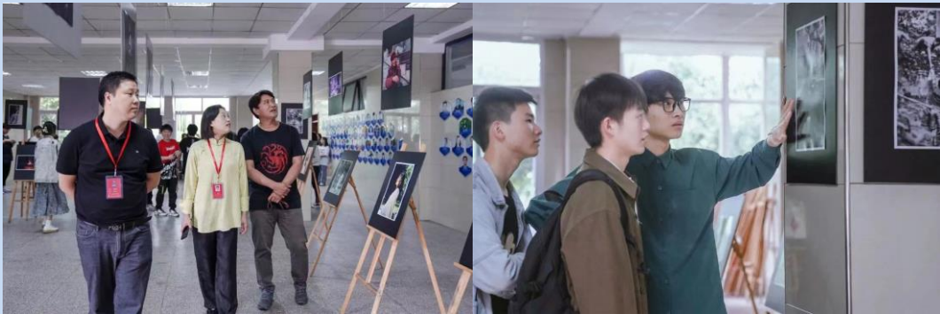
图 14 电影艺术学院举办摄影作品展

定格的那一刻，留住了不仅仅是光与影的实物，更有心动的情绪与感受。电影艺术学院组织的摄影作品展，重新找寻摄影师这一职业的意义与价值，不仅仅是向历代伟大摄影师的致敬，也是向《职业教育法》的宣誓。