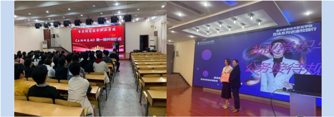
图 16 五门特质课课程建设