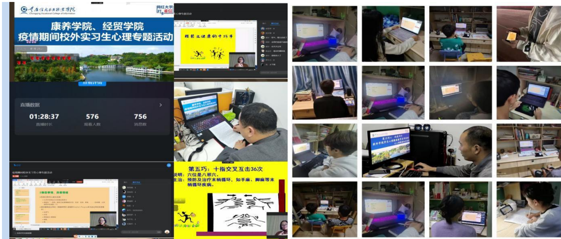
图 8 开展疫情期间校外实习生线上心理专题活动

4. 学生资助落地、落实。 学校健全国家奖学金、国家励志奖学金、国家助学金、勤工助学、助学贷款等完整资助体系，不断扩大资助覆盖面，确保没有一位学生因贫困而失学。2022年，共有1277名家庭经济困难学生通过“绿色通道”顺利入学，为困难新生办理缓交学费共计1348.37万元。本年度共计发放奖助学金、应征入伍直招士官学费补偿、退役复学学费减免、退役士兵助学学金、退役士兵生活补助费、建档立卡学费减免（含助学贷款、勤工助学）累计7857.27万元，其中：发放奖助学金1799.915万元；办理发放助学贷款751.5万元；发放征兵入伍及直招士官学费补偿3377.06万元；为退役士兵发放生活补助费782.43万元；为建档立卡贫困户学费资助748.8万元。相对于2020、2021年，发放金额大幅提升。