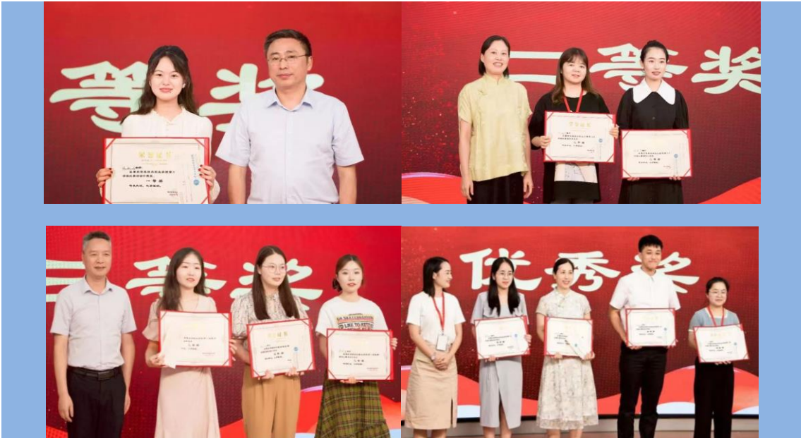
图 17 学校组织第二届讲课比赛