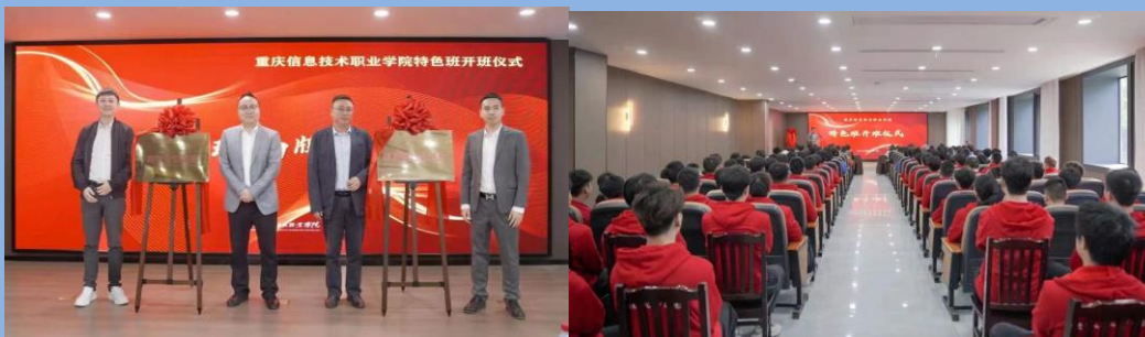
图 15 学校与重庆飞洋健身有限公司合作组建“体育特色班”

学校与重庆飞洋健身有限公司进行校企合作，组建了“体育特色班”，为飞洋健身有限公司订单培训体育类人才，学校负责牵头与企业联合制订教学标准、课程标准、岗位标准、考核评价标准、企业导师标准、人才培养方案，做好师资队伍的建设与管理。采用体外运行模式，学生本专业人培规定的课程正常上课，每周周二和周五下午上体育特色班的课程，并且实行淘汰机制，学生学习一段时间无法适应的学生进行淘汰，最后培养出企业真正需要的人才。