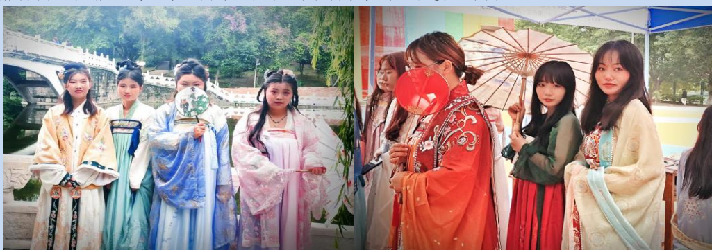
图 7 传统文化之汉服节

学校为精准扶持校园亚文化，深度挖掘私域流量，让社团达到百花齐放的盛况，在2021-2022年度打造了繁星季系列活动，创办汉服活动日，引导学生了解古装文化，让大家感受传统民族服饰文化之美，有利于重塑学生对本民族的认知、自信和认同。汉服节穿汉服参加古琴、茶道、汉舞等汉服活动，能让学生有更多的机会从多个层面去感受我们民族的传统文化。汉服只是一种外在的表现形式，但以汉服为载体的汉服节却开始追求文化的精神内涵，能让学生更深刻地认识到了传统文化的意义与内涵。