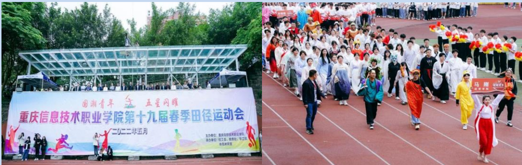
图 3 “国潮青年 五星闪耀”春季运动会