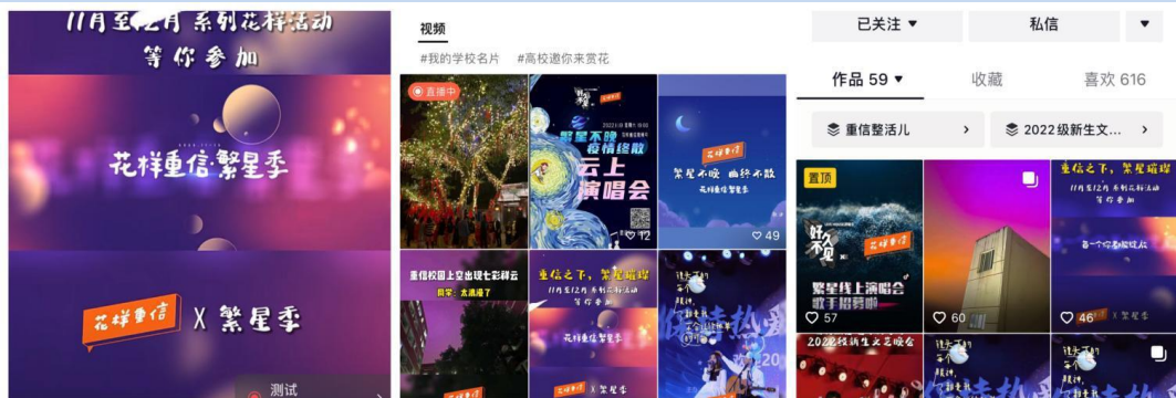
图 5 “繁星不晚 疫情终散”云上演唱会