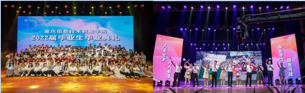
图 4 “由此开始 随处可往”2022 届毕业生毕业典礼