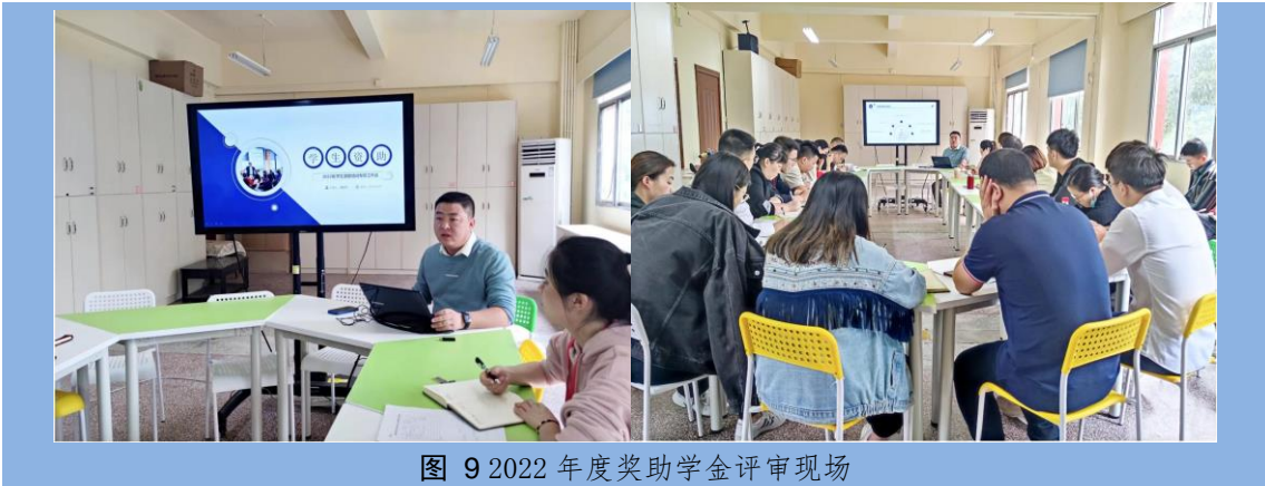
图 9 2022 年度奖助学金评审现场