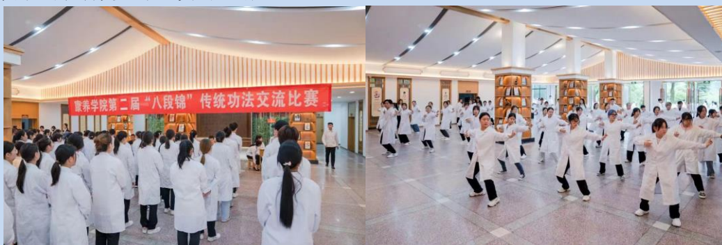
图 11 康养学院举办八段锦比赛

“八段锦”是中国传统中医健身功法操，康养学院组织的八段锦比赛，同学们用青春活力诠释了传统气功，使身心得到锻炼和放松，不仅提高了自身的身体素质，还为中华传统文化的弘扬奠定了坚实的基础。