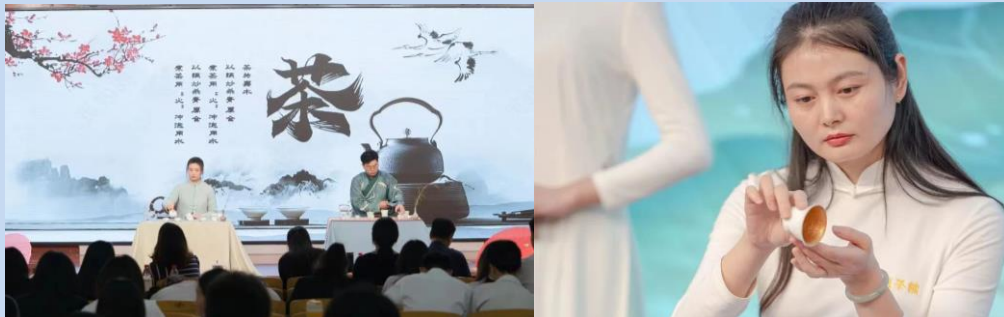
图 10 经贸学院举办“以茶逐梦 技创未来”为主题的茶艺技能比赛

经贸学院举办的以“以茶逐梦 技创未来”为主题的茶艺技能比赛，不仅达到弘扬我国传统文化，丰富同学们的校园生活的目的，更激发了同学们对传统文化的创新热情。