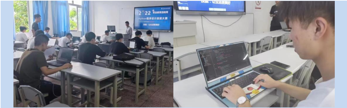
图 13 软件学院举办程序设计技能大赛

定格的那一刻，留住了不仅仅是光与影的实物，更有心动的情绪与感受。电影艺术学院组织的摄影作品展，重新找寻摄影师这一职业的意义与价值，不仅仅是向历代伟大摄影师的致敬，也是向《职业教育法》的宣誓。