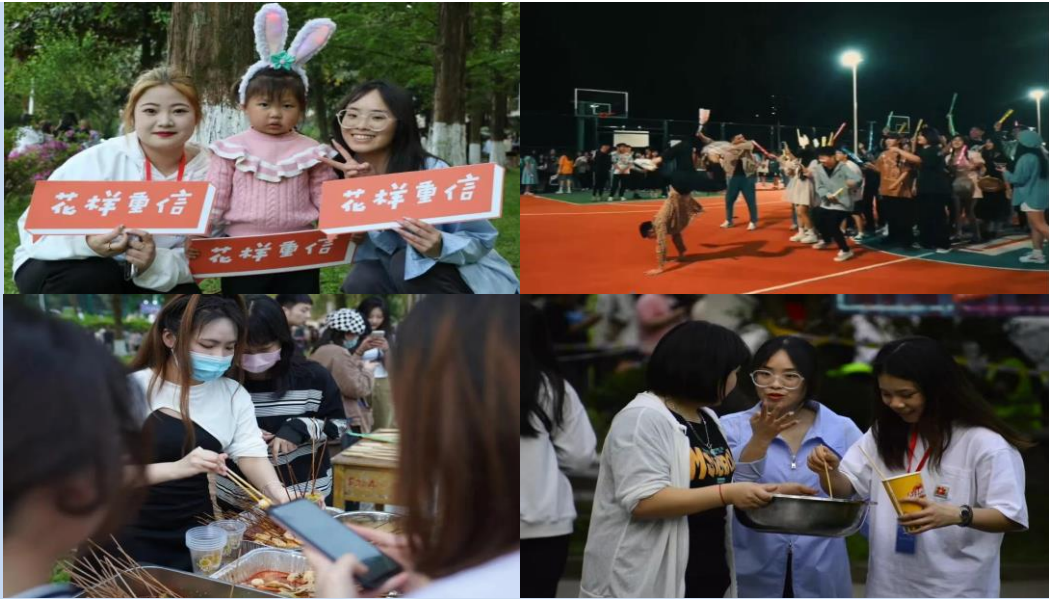
图 2 “重信烟火气夜市大趴体”美食活动节