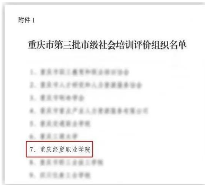
图 14 重庆市第三批市级社会评价组织名单