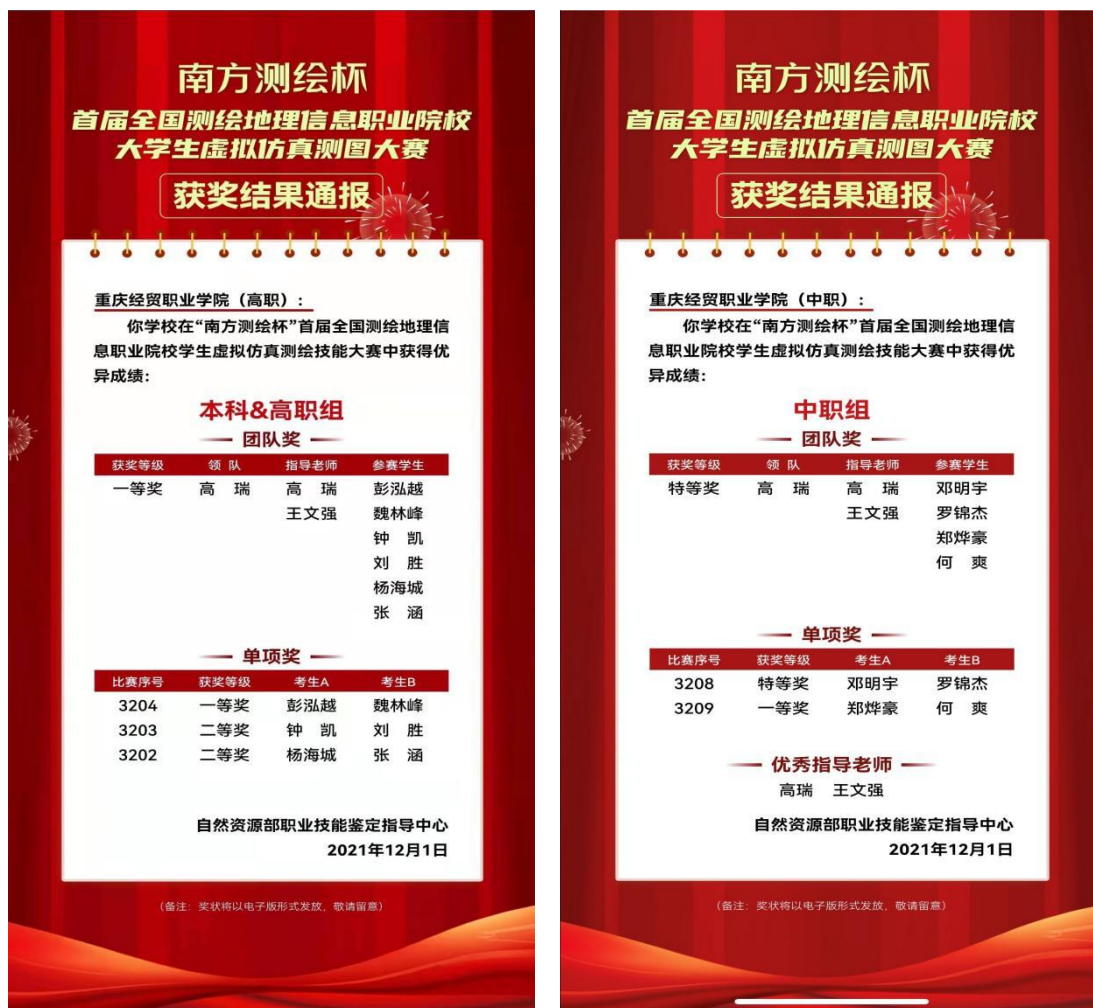
图 10 全国测绘地理信息职业院校大学生虚拟仿真测图大赛获奖通知