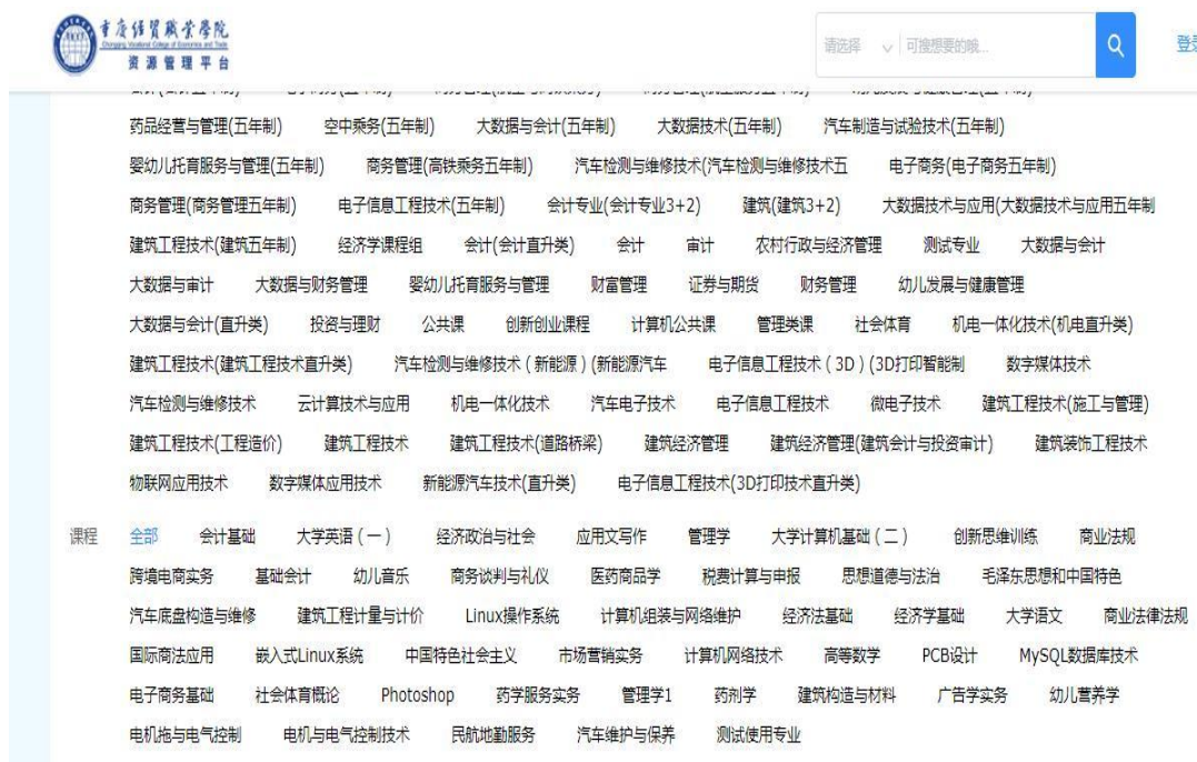
图 11 校内资源平台上线课程

实践教学环节，将职业技能等级标准和专业教学标准要求融入人才培养方案，促进书证融通；二是优化课程标准，根据专业人才培养方案要求，修订 200 余门专业课程标准，明确课程目标，优化课程内容，规范教学过程，及时将新技术、新工艺、新规范、新证书纳入课程标准和教学内容，指导教师准确把握课程教学要求，规范编写、严格执行教案，做好课程总体设计，按程序选用规划教材，合理运用各类教学资源，做好教学组织实施；三是建设在线课程，利用学院录播教室，建成《管理学》《应用文写作》《经济学》等 5 门线上精品课程，进一步提高网络教学平台使用效益。