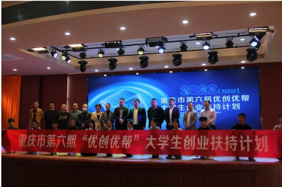
图 8 重庆市第六届优创优帮大学生创业扶持计划比赛现场