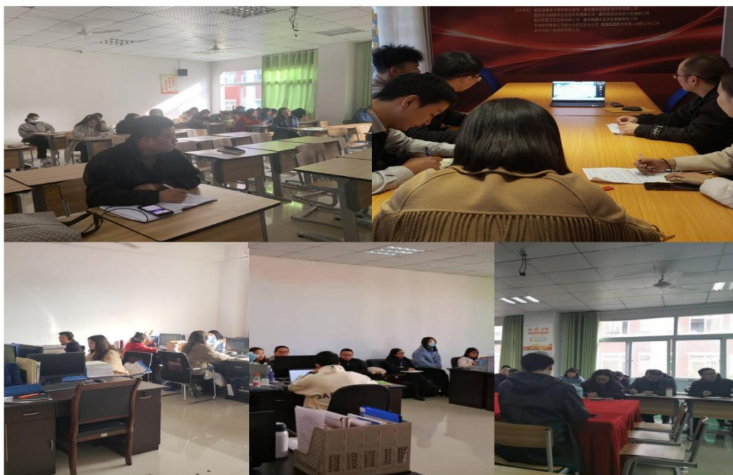
图 12 举办专业建设线上讲座

另一方面是专业建设的内涵。一是明确现代高职院校人才培养目标，探索提高人才培养规格的路径；二是强化课程体系建设，突出高职特点，改进教学方法，加强教材建设，强化课证融通；三是构建人才培养模式，坚持以人为本，以市场需求为导向，打造特色品牌；四是多措并举打造“双师型”教师队伍，专兼结合建设教学团队，提高教学能力；五是优化教学资源，科学整合、配置教学资源；六是完善评价考核机制，注重多元评价。