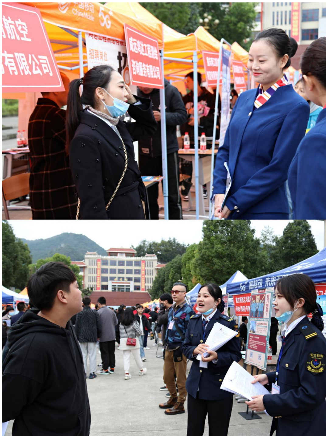
图 7 校园双选会现场