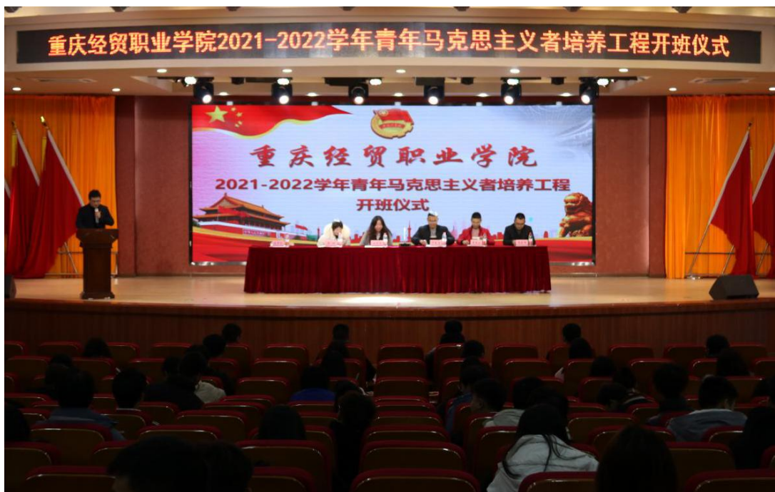
图 2 青马工程开班仪式

开班仪式在嘹亮的团歌声中拉开序幕。学生工作部副部长罗春雷对本次“青马工程”培训的内容、形式作了介绍并提出相关纪律要求。希望全体学员要严肃学习作风，认真完成培训班的全部课程和活动安排。