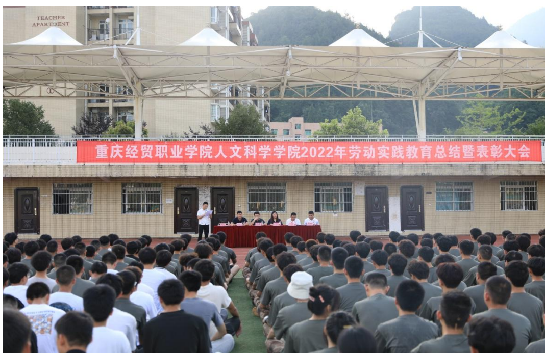
图 4 劳动教育总结暨表彰大会

本次 2022 年劳动实践教育总结暨表彰大会总结了经验、树立了典型、鼓舞了士气、表彰了先进，进一步激发了学生对劳动教育的认识，同时也为后续劳动教育的开展奠定了基础。