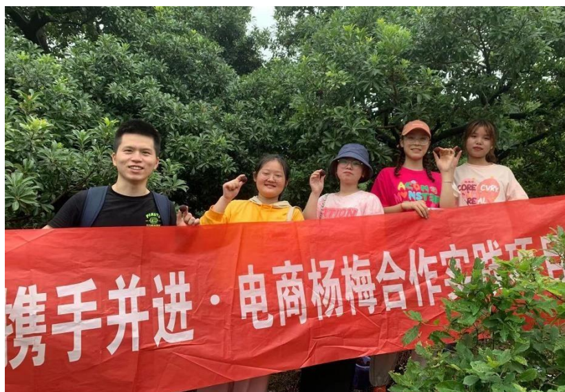
图 4. 杨梅营销直播活动