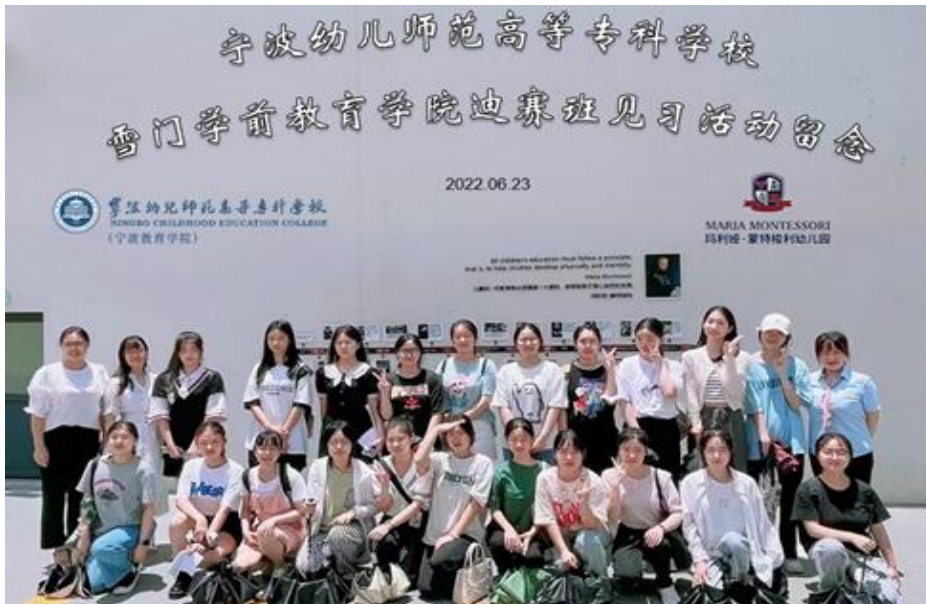
图 3. 订单班学生见习留影

宁波市迪赛控股集团有限公司负责订单班学生的见习实习工作，承担见习实习期间学生的实践指导，并协助学校进行学生实习管理和考核工作。订单班学生在校学习期间由学校组织不少于2周入宁波市迪赛控股集团有限公司旗下海贝幼儿园见习实习，最后一学期毕业顶岗实习由学生自愿选择。如在宁波市迪赛控股集团有限公司旗下幼儿园顶岗实习且经考核合格者由企业提供CMS蒙氏证书培训服务。