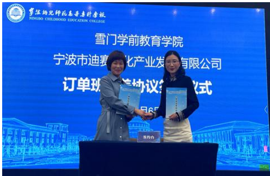
图 2. 订单班协议签订仪式现场

的人才培养模式。即以我校五年制学前教育专业人才培养方案为基础，以蒙台梭利教育为特色，培养“全面发展，学有所长”的幼儿园教师。