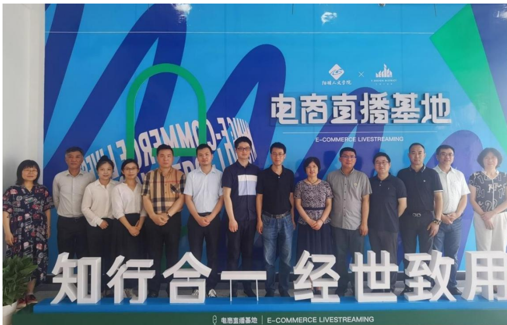
图 1. 校企合作共建电商直播基地正式运营仪式地方、学校、企业领导合影

宁波幼儿师范高等专科学校阳明人文学院与杭州湾 e 设计街区运营商浙江同天工业设计发展有限公司联合共建校企合作电商直播基地，将我校阳明人文学院实训楼 2 号楼 302-1 和 302-2 两间教室分阶段改造为直播基地，挂牌“电商直播实训基地”。宁波幼儿师范高等专科学校在企业建立“电商直播人才培养基地”。校企联合成立合作委员会，根据项目推进需要，不定期召开校企合作委员会会议。