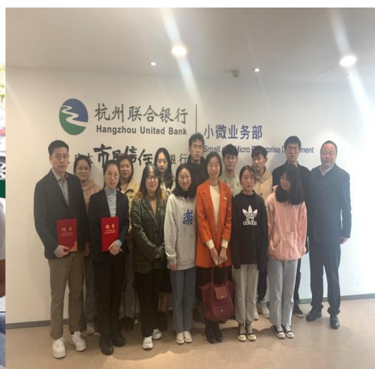
图 5: 学徒授课结业