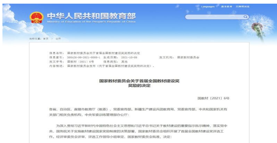
图 7: 校企共编教材《金融产品营销实务(第四版)》获全国首届教材建设二等奖