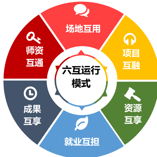
图 1 “六互运行模式”

2. 企校携手“五个共同培养”。九鼎（产业）学院按照装饰行业所需要的岗位特色人才制定专门的培养模式，培养接轨企业需要的专业人才。采用“五个共同培养原则”，即校企共同制定人才培养方案、共同组建教学团队、共同建立实训实习基地、共同推进课程建设、共同进行人才培养质量评价（图二）。以工作任务导向，以学生为中心，企校合作科学调整专业课程结构与内容，共同开发课程教学资源及教材，通过双导师制来综合提升教育教学质量。工学交替、顶岗实习，强化学生实践能力，应届毕业生按自愿原则先与九鼎签订实习协议书，在集团公司实习期满后正式入职，真正做到零距离就业。