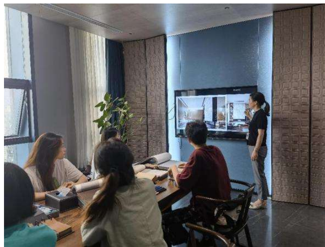
图 4 学生在企业工位上讨论设计方案

3. 人才支持。一是在学校内设章德富总裁工作室，持续输送企业优秀人才支持九鼎（产业）学院教学及其他教学建设，其中客座教授1名，创业导师2名，企业导师15名，双导师教学模式全覆盖产业学院所有课程。二是在企业设置艺术人居专业群教师企业实践流动站，本年度接收教师在企业实践达227人/天。三是校企互设双师培养基地，本年度在专业发展趋势、专业前沿应用、现代信息化技术、课程开发与应用、课程改革与建设等方面培养培训教师达272人/天。