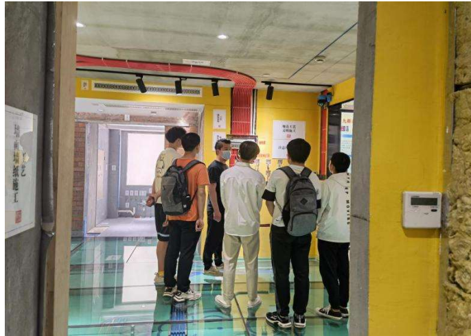
图 3 学生在企业水电隐蔽工程展厅内学习实践