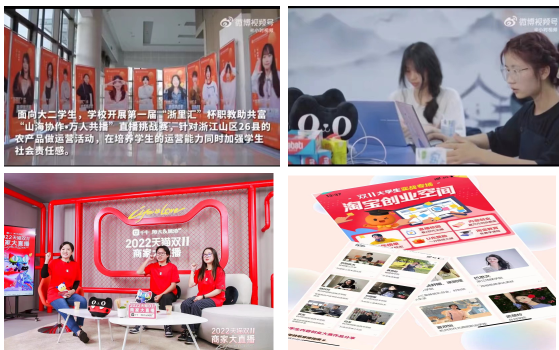
图 2 学生活动情况

面向大三学生，产业学院组织了天猫双十一大学生创业专场活动，给予创业学生创业培训、创业辅导、宣传以及流量等资源的扶持。