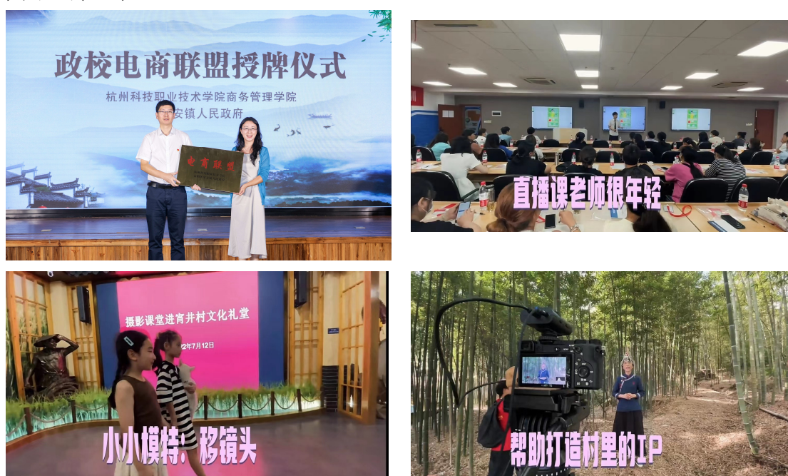
图 3 学生参加电商活动

产业学院与富阳区常安镇、宵井村、大源镇开展校地合作，共建“政校电商联盟”“乡村新零售示范点”“短视频拍摄基地”等，通过组建乡村振兴共富团队、乡村振兴工作室、乡村振兴暑期社会实践队、乡村振兴志愿者服务团队、乡村振兴社会服务团队等方式开展课程实践、社会服务等活动，把老师的教学科研和社会服务、学生的实践科研和服务写在富阳乡村的大地上；发挥阿里巴巴在电商运营、直播运营等方面的优势，帮助农产品上行，助力乡村振兴。