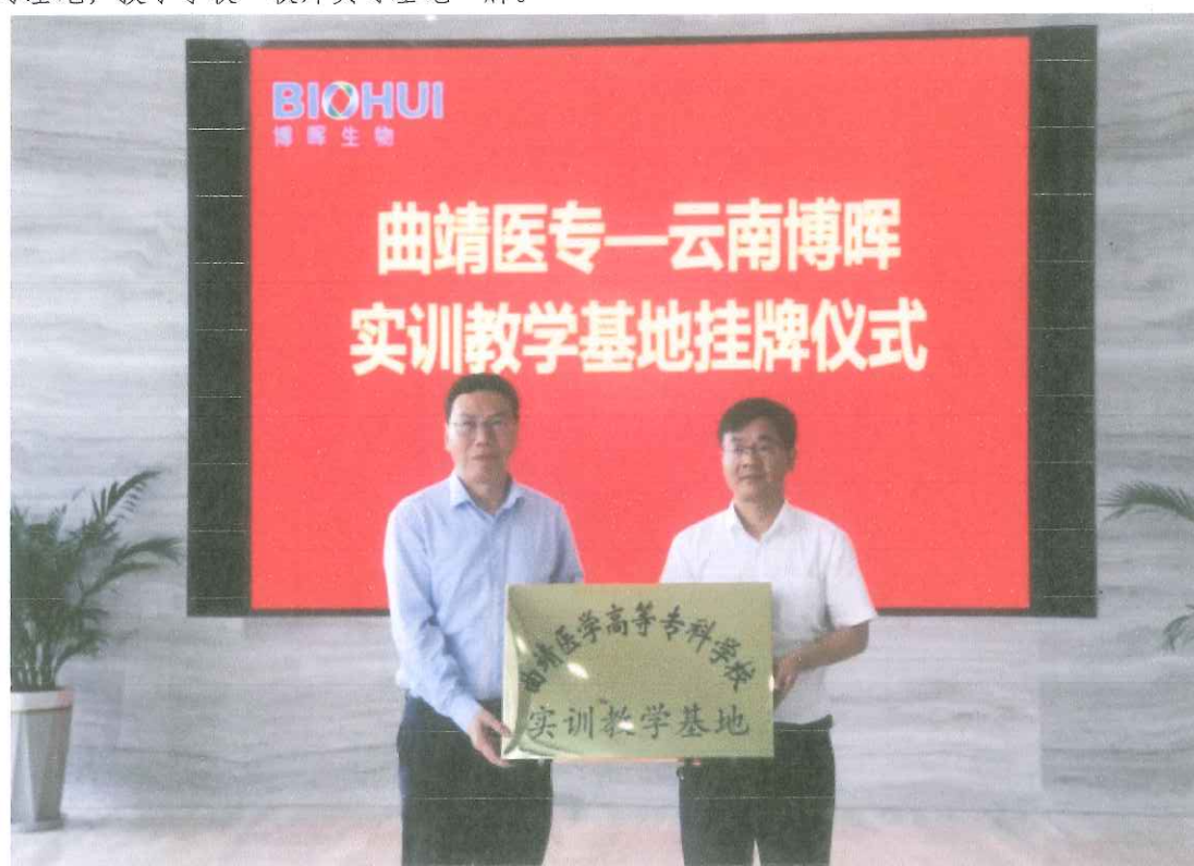
图1 学校校外实训基地授牌仪式

最后举行了学校校外实训基地授牌仪式,校企双方在前期协同育人取得良好成效的基础上,经学校考察评估,学校校长办公会、党委会研究,将云南博晖生物制药有限公司设置为学校校外实训基地,授予学校“校外实习基地”牌。