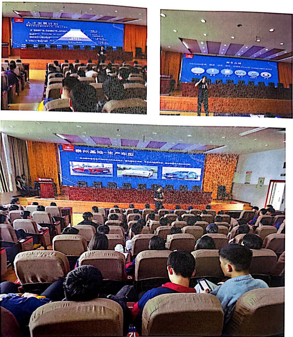
图 4：企业到校宣讲图片