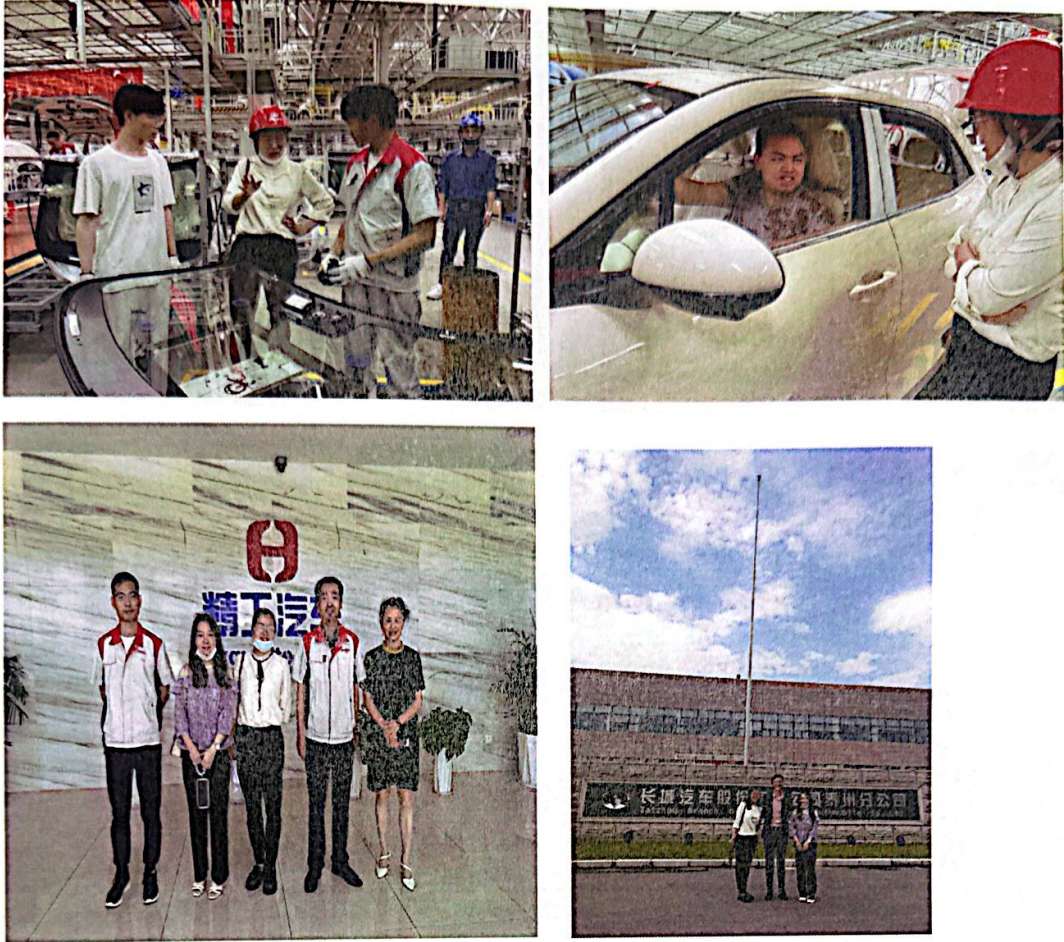
图 2：老师考察企业图片