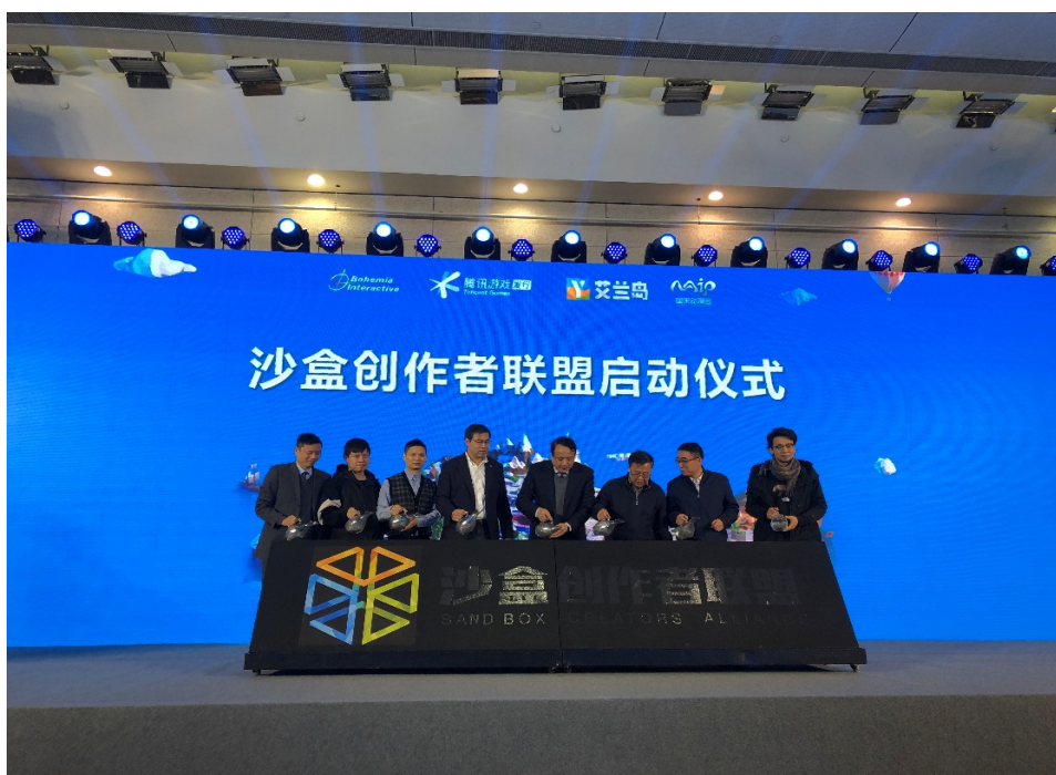
图 3 沙盒创作者联盟启动仪式