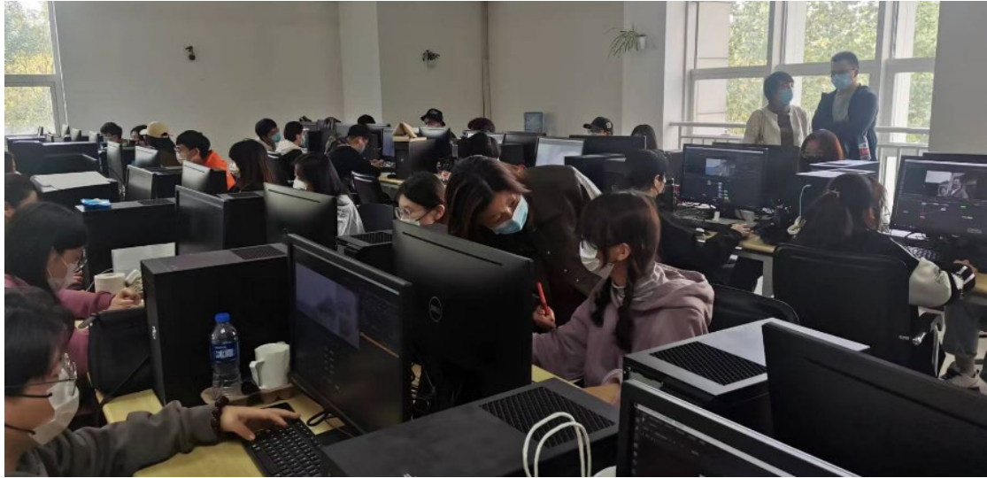
图 6 2020 级国家动漫园产业学院学生跟岗实习