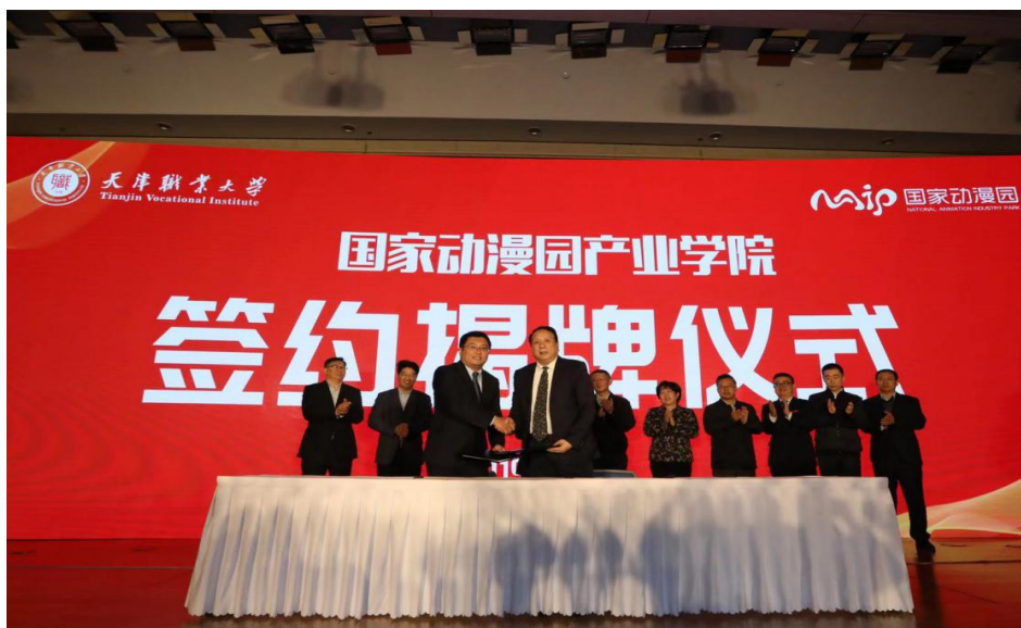
图 2 国家动漫园签约揭牌仪式