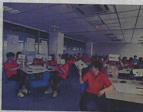
有效沟通职业做事培训