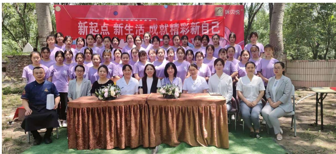
图 2-7 公司为实习学生举办迎新仪式