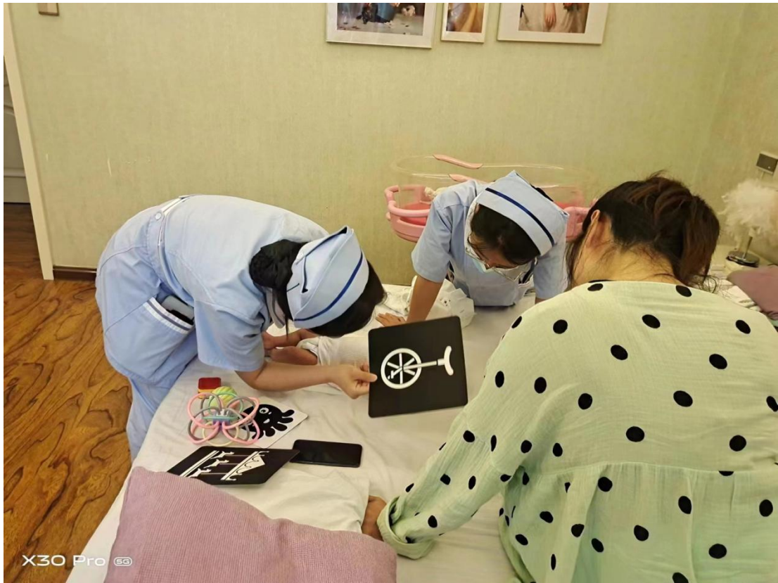
图 2-17 跟岗实操 2 (早早教)