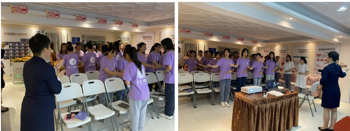
图 2-11 礼仪培训