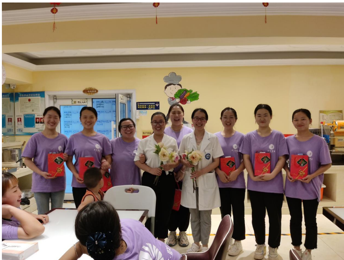
图 2-15 培训结业仪式