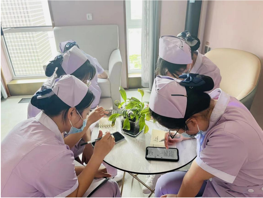
图 2-21 课后学习