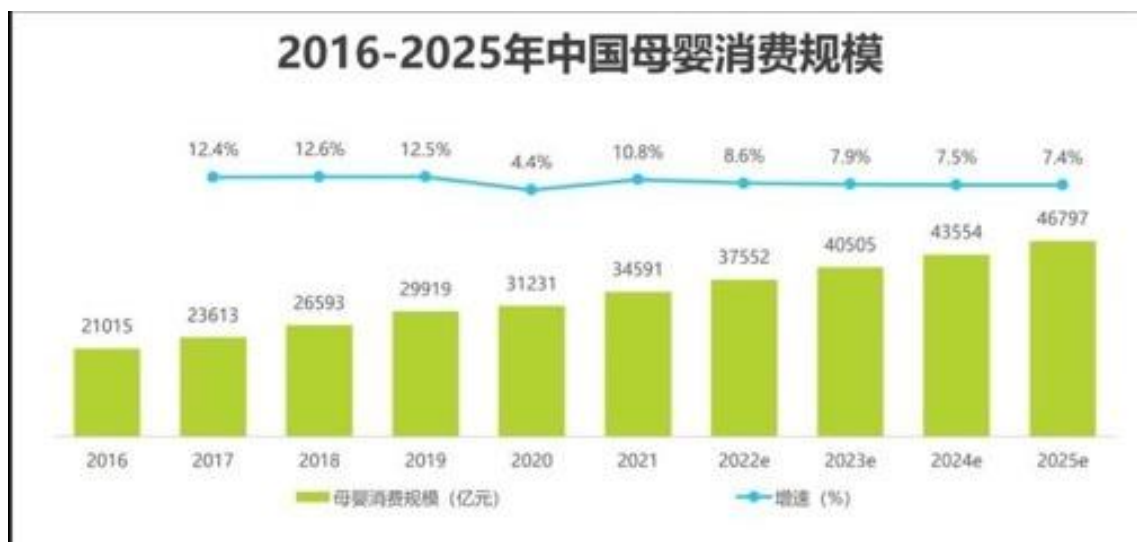
图 1-3 中国母婴消费规模图

母婴市场规模稳步增长，预计 2023 年将超 4 万亿，尽管近年来人口出生率持续走低，但随着人均可支配收入的增加以及母婴童家庭消费能力的提升，中国母婴市场持续增长，2021 年中国母婴消费规模达 34591 亿元，预计未来中国母婴市场仍保持稳定增长趋势，到 2025 年中国母婴市场规模将达到 46797 亿元。