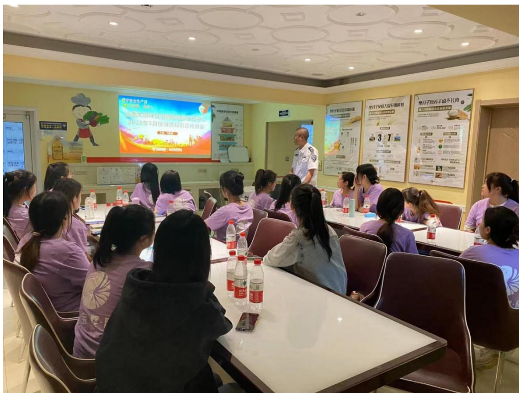
图 2-9 岗前消防培训