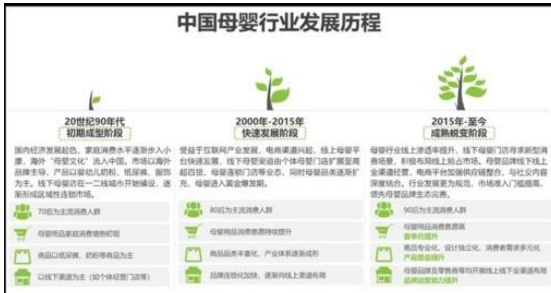
图 1-2 中国母婴行业发展历程图

母婴市场规模稳步增长，预计 2023 年将超 4 万亿，尽管近年来人口出生率持续走低，但随着人均可支配收入的增加以及母婴童家庭消费能力的提升，中国母婴市场持续增长，2021 年中国母婴消费规模达 34591 亿元，预计未来中国母婴市场仍保持稳定增长趋势，到 2025 年中国母婴市场规模将达到 46797 亿元。