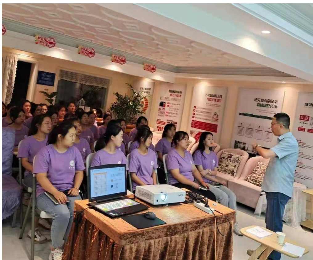
图 2-10 职业生涯规划培训