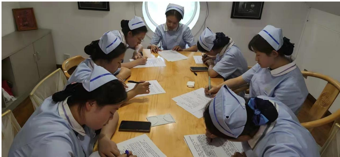
图 2-22 技能考核