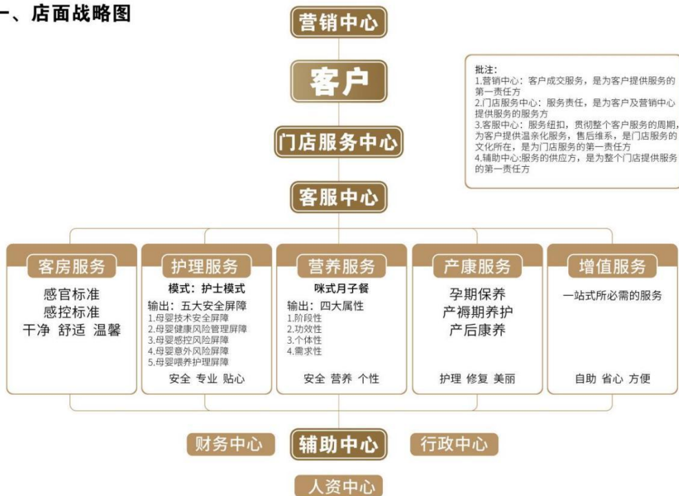
图 1-4 店面战略图