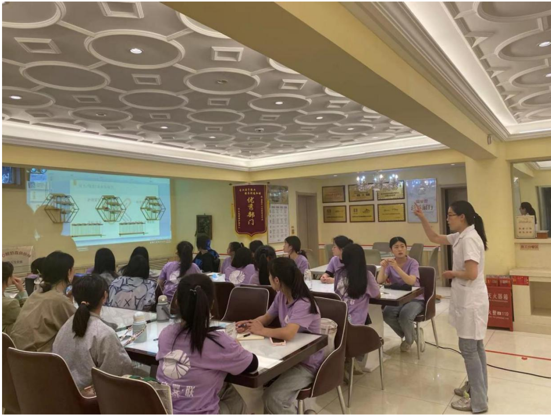
图 2-13 理论培训