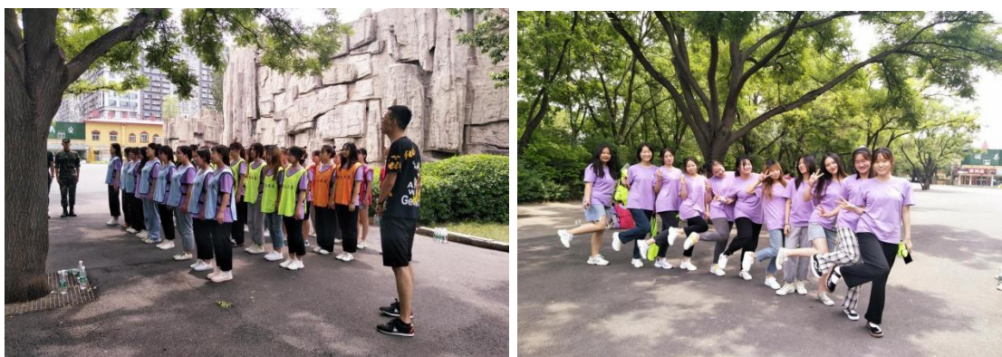
图 2-6 岗 前 军 事 培 训

美宝婴联实施岗前军事培训，培养和磨炼学生们果断、勇敢、顽强、自制和坚韧不拔的优良意志品质，为他们踏上工作岗位、走上社会奠定了良好的基础。