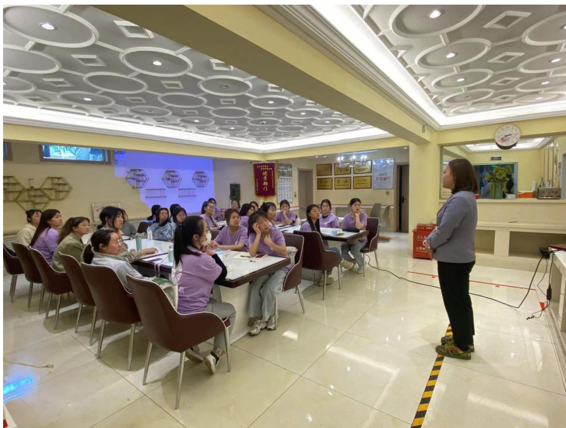
图 2-12 学长分享