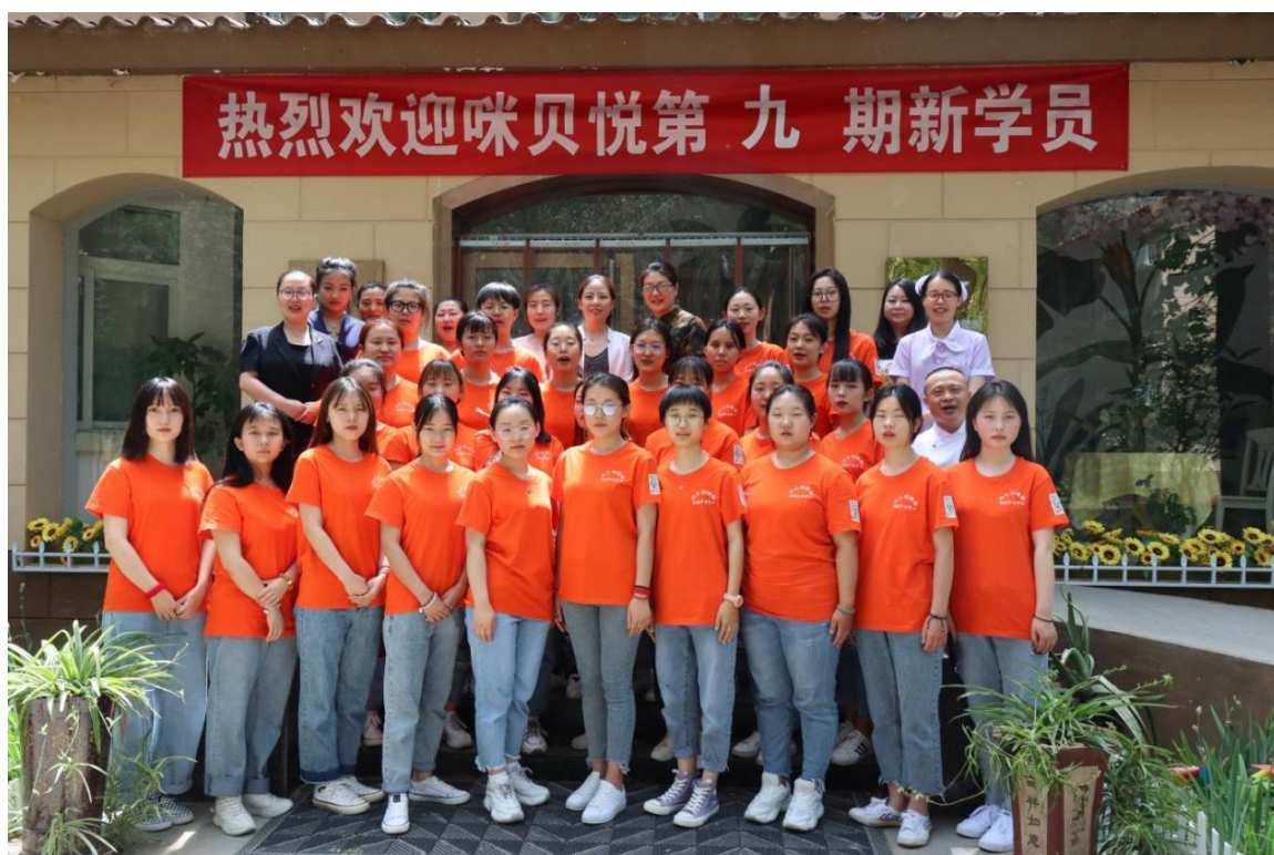
图 2-1 新学员合影留念