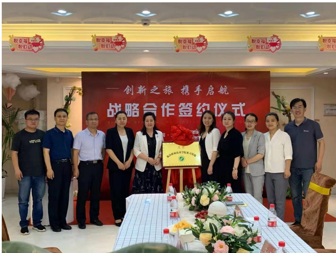
图2-3 合作达成授牌留念