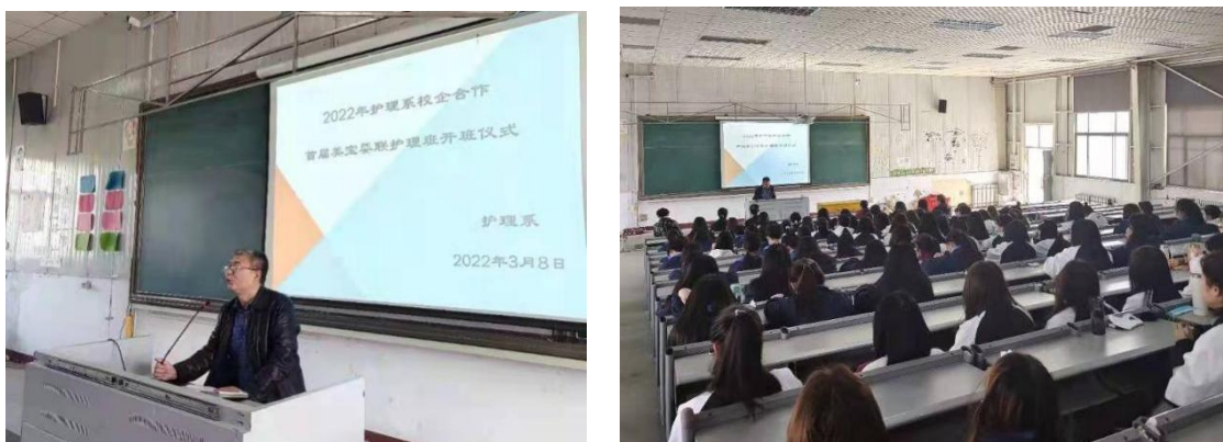
图 2-5 冠 名 班 成 立

2022年3月8日正式成立美宝婴联护理系冠名班，量身定制进行人才培养，培养的人才与企业需求精准对接，为学生就业提供更多的空间，使校企成为责任和利益的共同体。