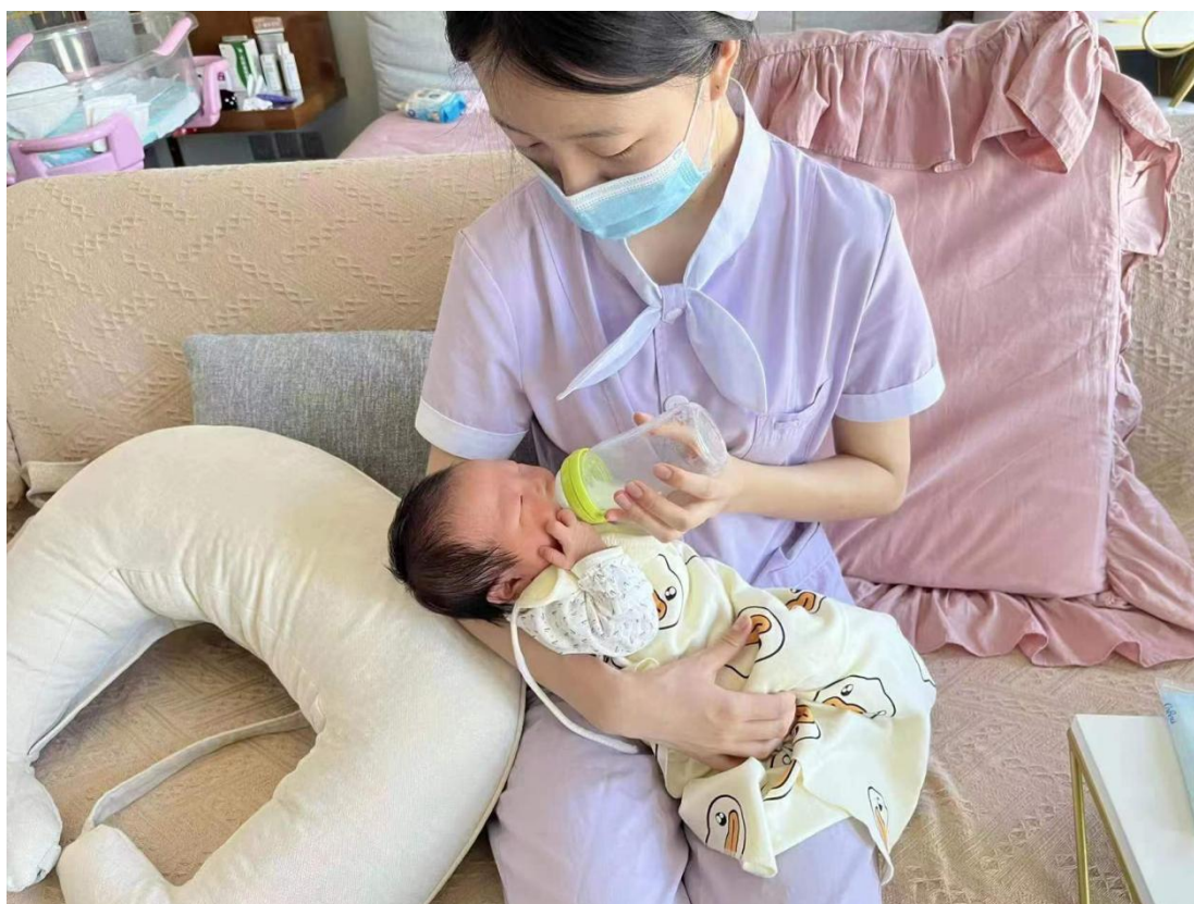
图 2-16 跟岗实操 1 (喂养)