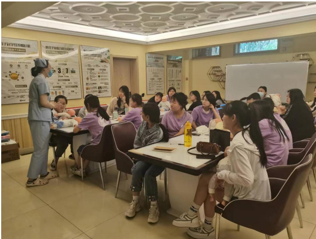
图 2-14 专业技能培训