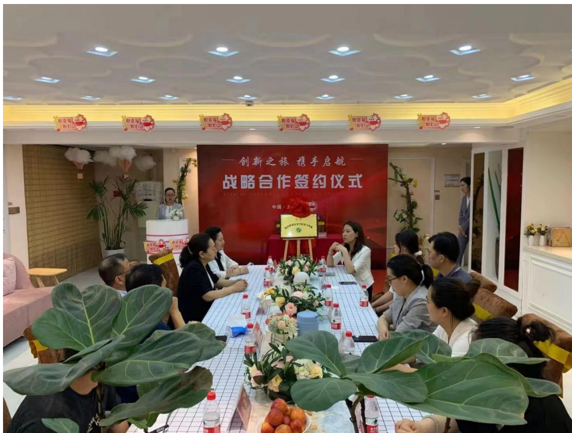
图 2-2 校企合作深入座谈会

为了进一步促进校企融合，山西美宝婴联健康科技有限公司于2021年6月和临汾职业技术学院达成校企合作，正式建立临汾职业技术学院见习基地，真正实现产教融合，让理论和实践相结合，提升学生实践操作能力，通过岗位认知，从不同角度创造提升学生整体素质，为学生的正确择业提供帮助。