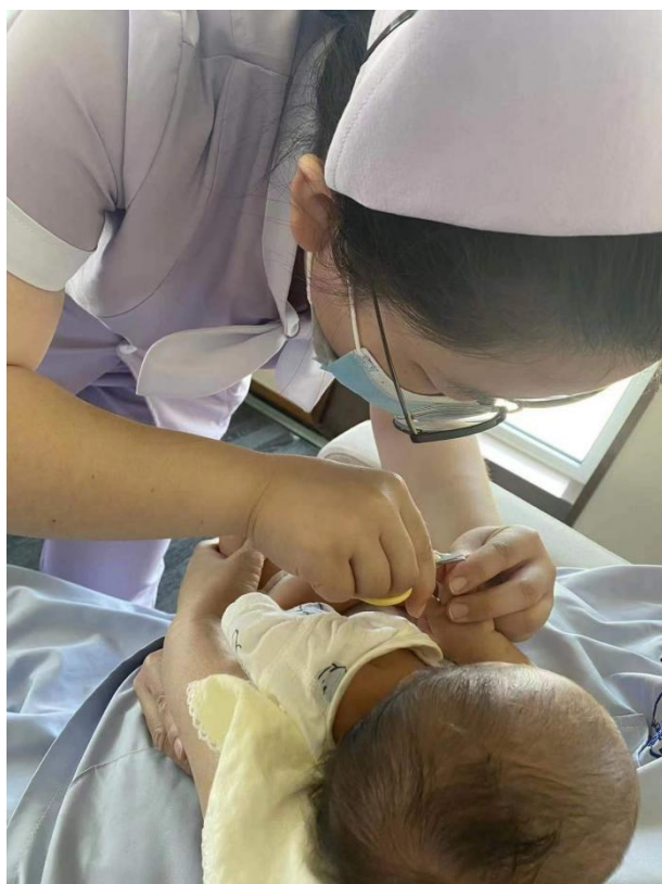
图 2-20 跟岗实操 5 (手部卫生清洁~剪指甲)