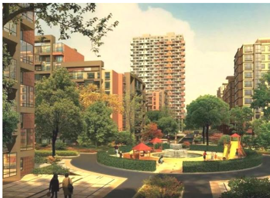
图 1 太原十二院城一期工程获汾水杯

公司多次荣获中国建筑业协会 AAA 级安全文明标准化工地、山西省内建设工程质量最高奖“汾水杯”、内蒙古自治区建设工程质量最高奖“草原杯”，并于 2019 年荣获了国家优质工程奖“鲁班奖”等殊荣。