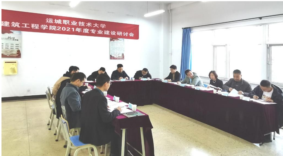
图4 建筑工程学院2021年度专业建设研讨会