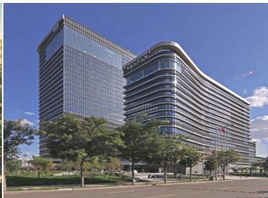
图 2 包商银行工程获鲁班奖