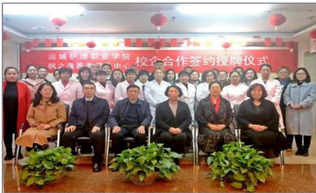
图 1 与枫之逸医养结合中心签订合作协议

加强和完善校企合作机制，在专业建设指导委员会的指导下，院校双方共同参与行业人才需求调研，研究制定以提高素质为基础，以岗位职业能力为本位的人才培养目标及方案；开展教科研合作，共同探讨临床教学和实践，参与课程开发和编写实用性教材；共同投资建立校企共享型实训基地，制订相适应的学生见习、实习管理制度，制定专业技能考核标准及开展技能比赛；依托校企合作平台，校内外师生分别深入院校进修见习，双方互学互促；共同开展学生就业指导及招聘工作；共同制定并实施学校、医院和学生共同参与的人才培养质量评价和监督体系。由此形成学校与医院（行业）人才共育、过程共管、成果共享、责任共担的双赢紧密型合作办学体制与机制，呈现院校合作双方资源共享、优势互补、共同发展的格局。