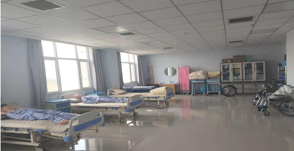
图 5 院内外共建实训基地