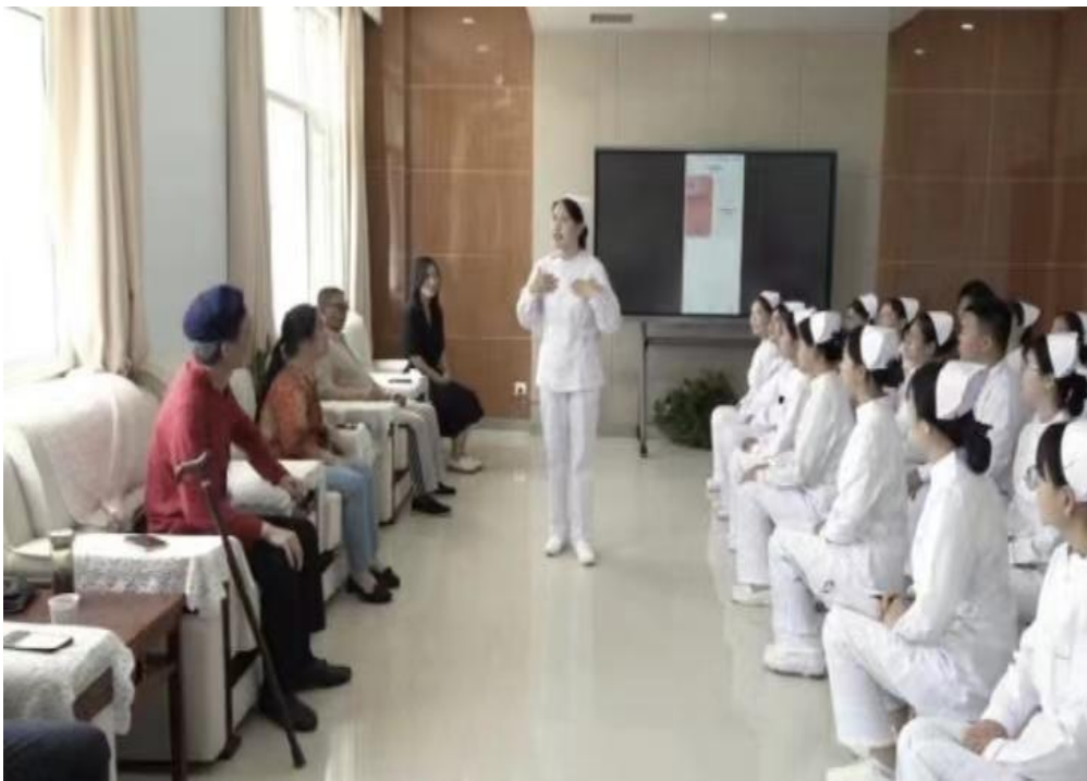
图 7 校内教师为机构护理人员开展“加强护理岗位服务力”培训

为进一步规范护理人员的职业形象，掌握有效沟通技巧，提高我院护理队伍整体素质，为患者提供更优质的护理服务，护理专业教师 2022 年为合作单位开展了三次护理技能和医护服务礼仪培训，共计 100 人次，为全面提升医院的临床护理服务质量、构建和谐护患关系打下坚实基础。