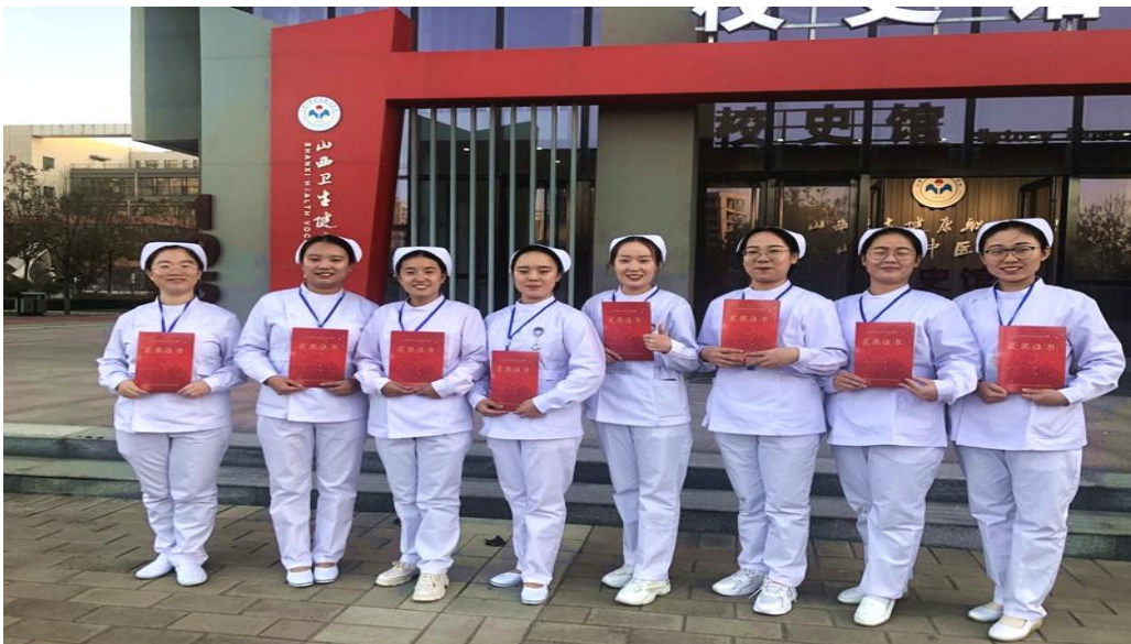
图 6 护理专业学生在山西省职业技能大赛中荣获奖项

护理专业树牢“服务企业就是服务发展”的理念，将企业诉求和自身优势结合起来，2022年为机构输送5名护理专业人才，现在各自的岗位上发光发热。其中2名同学曾在山西省职业院校技能大赛高职组护理技能赛项中荣获二、三等奖，为合作单位在本地区参加技能大赛提供了人才储备。