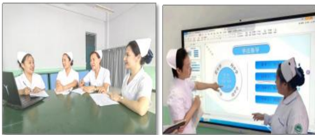
图2 院企双方开展教研交流

护理专业打破院校壁垒，深入推进校企合作，通过组建专业建设指导委员会，合作医院院长、护理部主任和校内骨干教师担任委员，召开专业建设指导委员会会议，2022年度共开展12次教研活动、3次学术交流、1次教材开发以及数次教改创新等教育教学任务与合作，进一步明确护理专业人才培养方式和思路，使专业建设工作更加主动、灵活地适应社会需求。