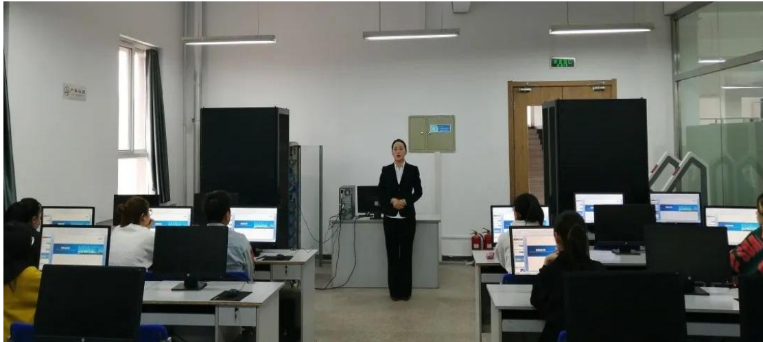
蓝泰集团千丁云智慧物业管理系统教学