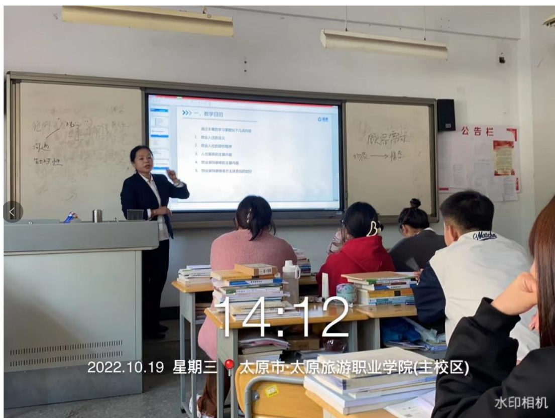
图1 《物业管理实务》课堂