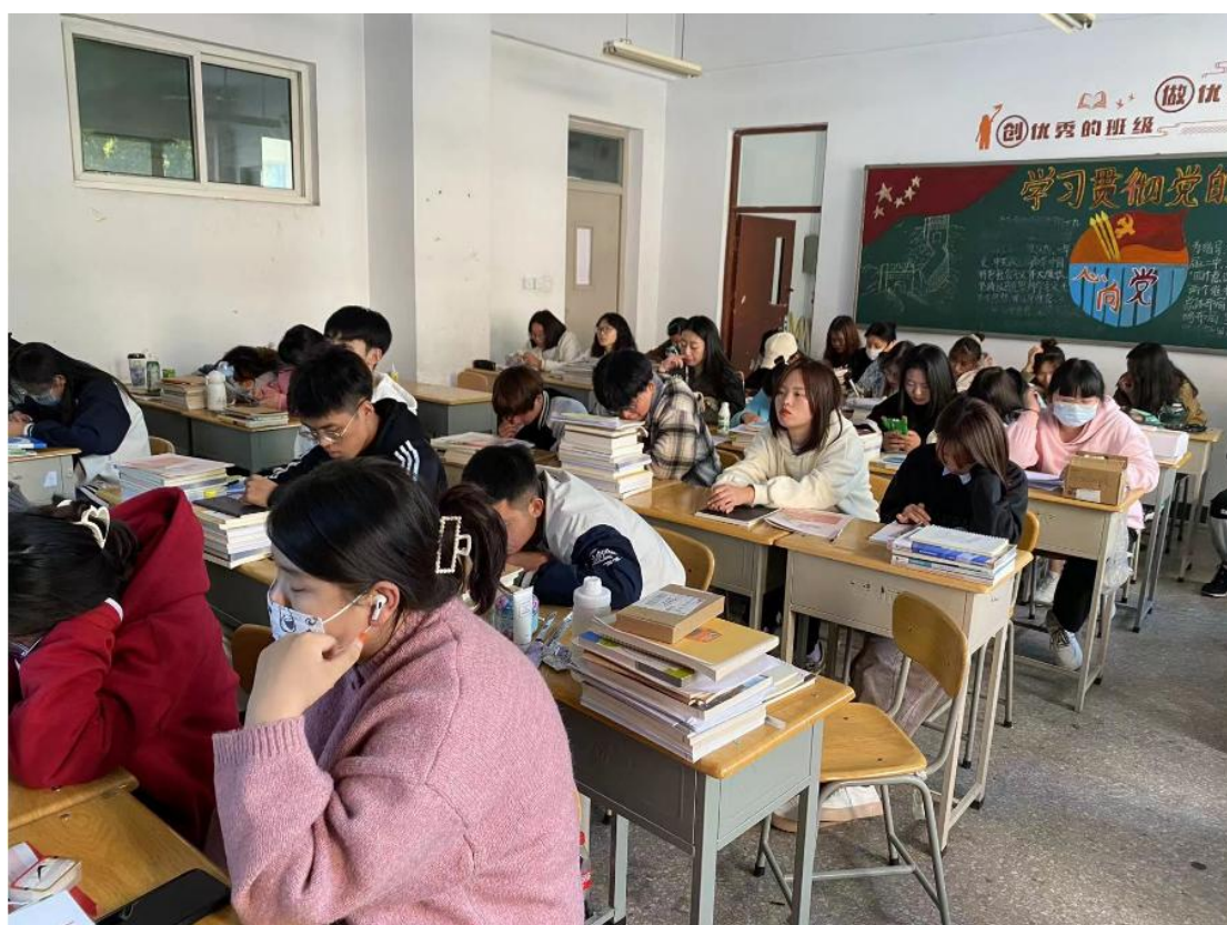
图2 《物业管理实务》课堂