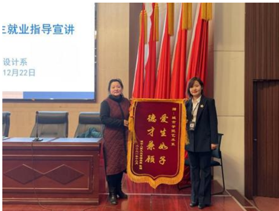
图9 公司向系部赠送锦旗