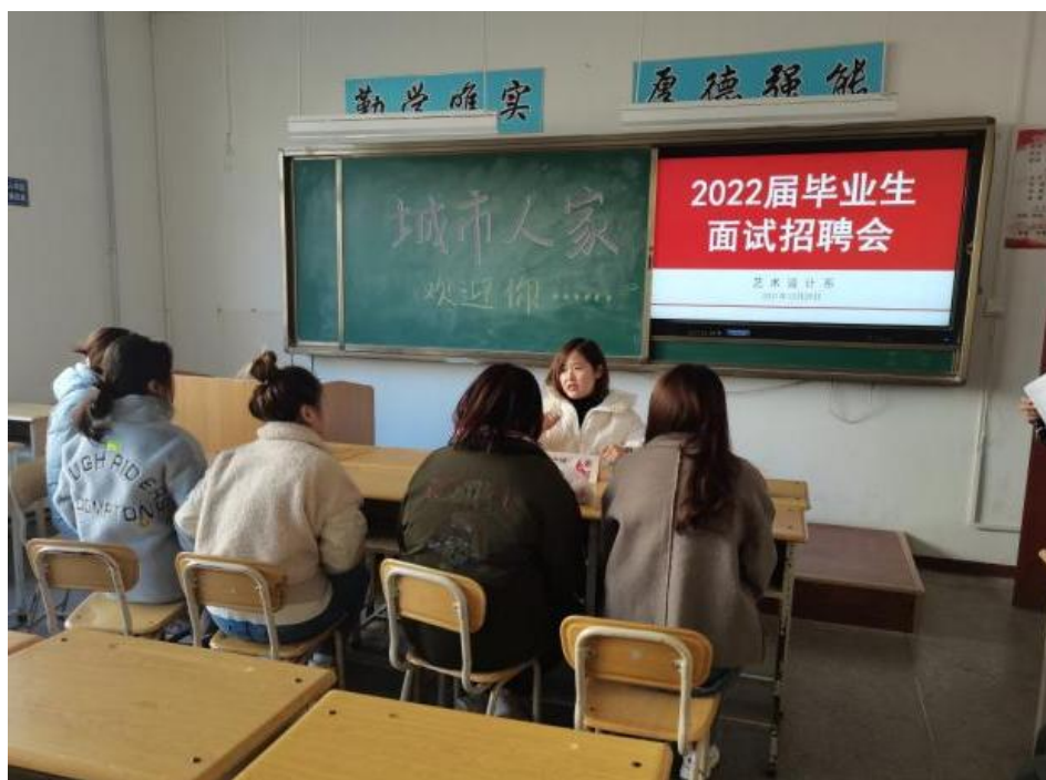
图 11 2022 届毕业生应聘现场

理人员，有的设计、绘图非常出色等，完全符合企业用人需求。企业对学生进行一对一的面试，学生们对就业实习和岗位要求有了详细了解，同时也吸引了非毕业班的学生到现场感受应聘的氛围。