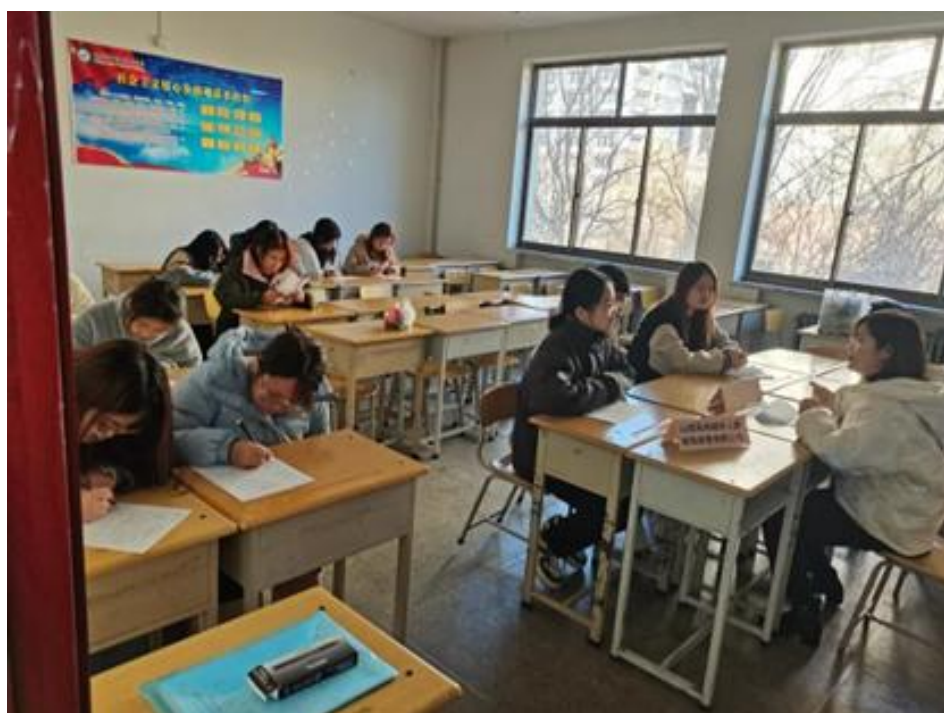
图 12 2022 届毕业生填写意向书