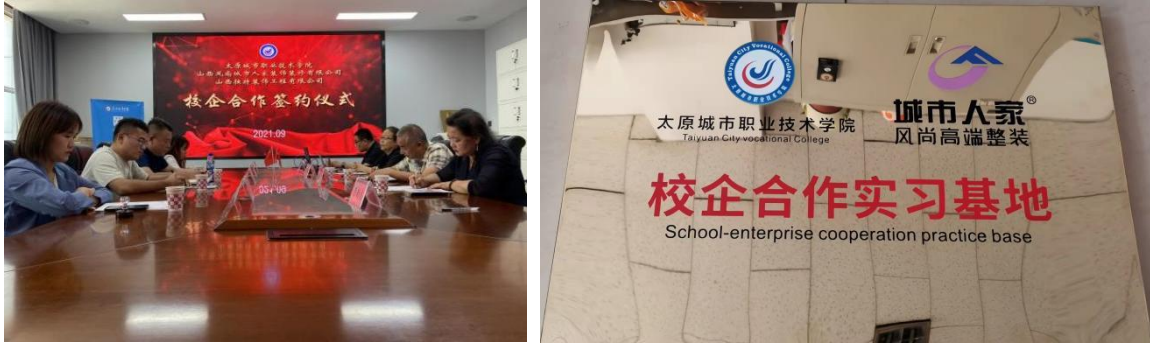
图5 校企合作签约及挂牌