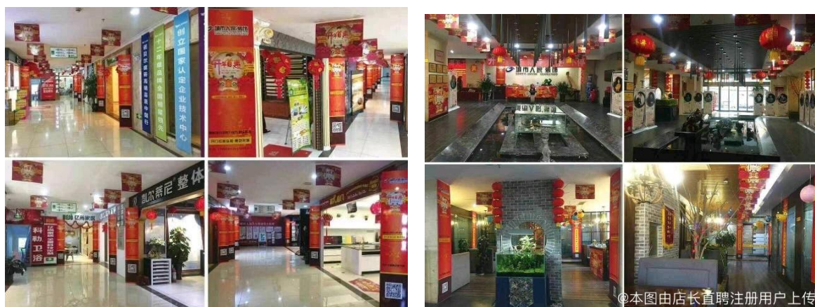
图 2 公司内景