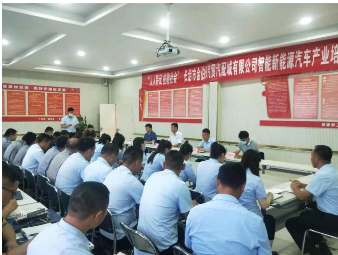
图3 长治市金伯乐汽贸汽配城智能新能源汽车产业培训

为响应省委省政府《山西省“十四五”14个战略性新兴产业规划》文件精神，长治市金伯乐汽贸汽配城有限公司积极组织学员筹划和参与由山西机电职业技术学院承办的智能网联新能源汽车产业技能培训（图3），共同研究教学计划、确定教学内容，围绕纯电动、氢燃料、甲醇、燃气等方向，构建“零部件-系统总成-整车”产业链，加快新能源汽车模化量产。培训结束后，由企业-学校联合进行汽车维修工三级技能鉴定，通过率98%，培训取得圆满成功。