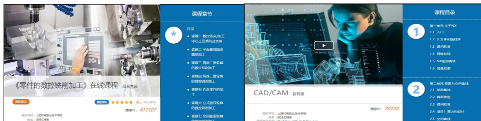
图10 校企共建教材和课程资源

校企双方人员围绕企业人才需求，明确了目标岗位，进行了工作任务分析，梳理了岗位关键任务和核心职责，提炼出完成关键任务所需关键能力，依据关键能力匹配学习目标，并着手编制了《数控加工工艺》课程标准以及校企合作培训教材，建设与教材对应的在线课程资源，使培养目标更符合企业岗位实际。