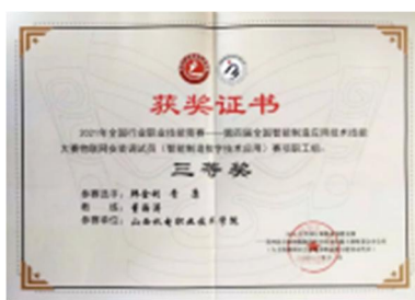
图 15 第四届全国智能制造学校“双师型”教师的获奖荣誉证书

在校企合作的背景下，在现代学徒制班级的授课、技能锻炼中，也在不断提升我校双师型教师的技能水平，在工厂提供的设备，通过不断地练习和摸索，我校师生在第四届全国智能制造竞赛中再创佳绩，获得多个国家级奖项。