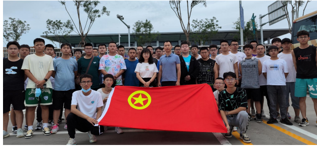
图 5 第二批现代学徒制班级学员派送