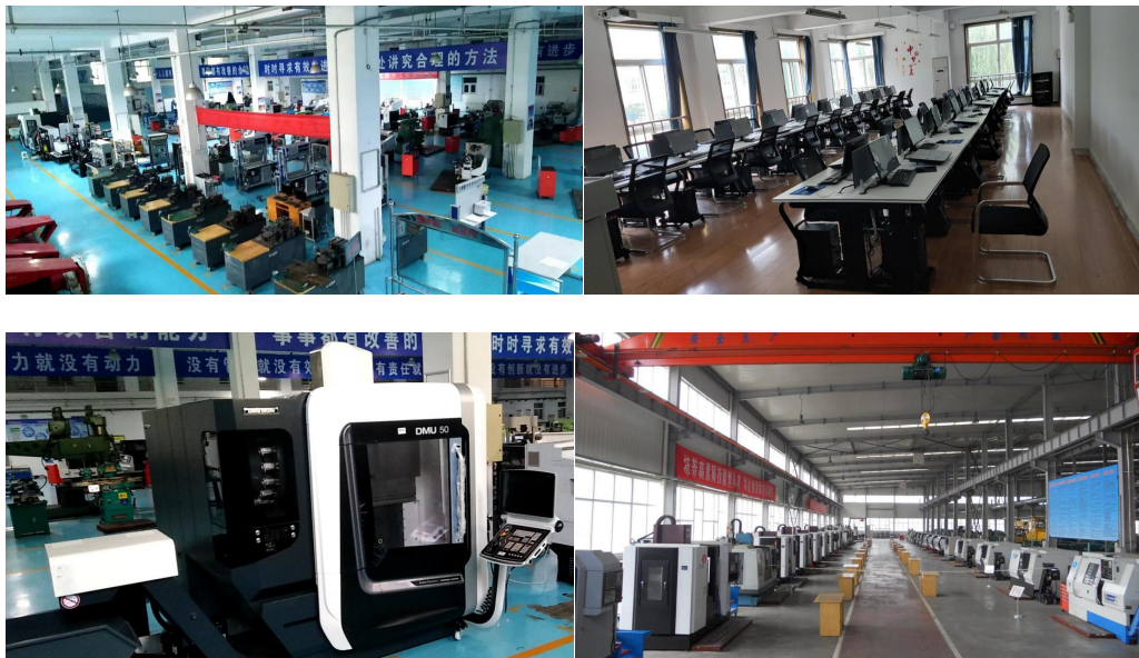
图 11 校内实训基地

山西机电职业技术学院与北京新风航天装备有限公司按照企业标准和教学改革要求，根据生产实际，实现人才培养和企业生产的深度融合。校方导师根据企业生产任务在校内或企业完成理论、基础实践教学任务，企业导师则帮助学徒真切落实完成一线生产岗位任务。