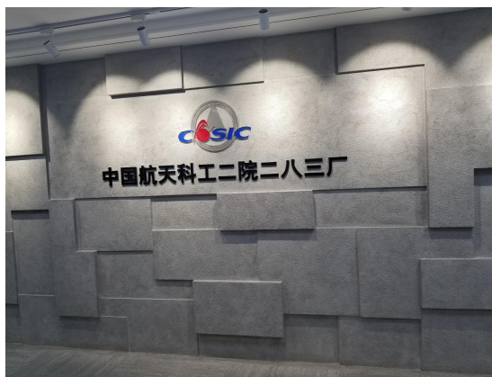
图 1 北京新风航天装备有限公司

北京新风航天装备有限公司隶属于中国航天科工集团第二研究院，作为产品总装厂。1983 年成立，经过 30 年的发展，现已具有承担国家多个重点型号产品预研、研制和批量生产能力，是北京市高新技术企业。企业在精密机械加工技术、黑色与有色金属焊接技术、钣金成型技术、电缆网制造与检测技术、复杂大型构件精密测量技术、精密装配技术、产品总装测试技术、复合材料产品研发等多个专业领域具备雄厚的技术实力，处于国内和行业先进水平，多次获得国家和省部级科技进步奖。三十年来，有近百项科技成果获得各级奖励和表彰，为国防现代化建设做出了重大贡献。企业致力于发挥专业优势，提高竞争实力，现已发展成为具有国际水准的现代化防空防天总装单位。涿州分公司作为新投入建设的生产基地，于 2006 年成立，总注册资本为 2000 万元，组织机构代码 791398798，主要以数控产品方案制定、产品设计、产品中试、批量生产为主要任务，企业在数控加工方面引入 MES 系统和自动化生产线，持续推进智能制造。公司作为数控加工领域的龙头企业，致力于数控加工产品的研发、技术方案提供，满足国家重大军品零部件的加工需求，在科研方面自主研发、精密生产、高效运营，具有以曹彦生、冀晓渊等为代表的一大批“大国工匠”，代表了数控领域的高技术。