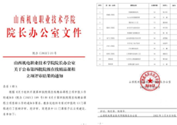
图 14 《数控加工工艺》在线精品课立项书