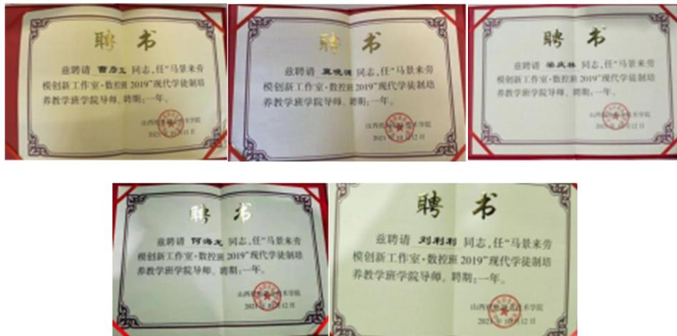
图 13 企业指导教师聘书