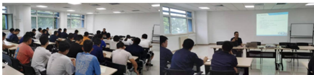
图4 学员入驻企业当天进行安全主题教育

(3) 2021年8月，数控工程系派送第一批现代学徒制学员赴企业实习，并在进入工厂当天进行生产安全教育，为安全有序的学徒制环节保驾护航。。山西机电职业技术学院数控工程系数控技术专业与北京新风航天装备有限公司成立的“马景来劳模创新工作室·数控班 2019”现代学徒制班级，学生均在企业工作，学生具有“学生与员工”的双重身份，同时由校内指导教师、企业带徒师傅共同指导的双导师制。