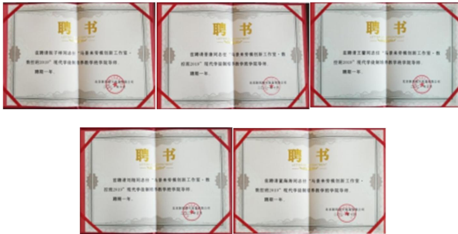
图 12 校内指导教师聘书

学校与企业共同构建了“双主体”员工与学生管理机制，在企业的学生经由学校导师和企业导师指导指导，以课程教学的形式和工作任务问题导向、师带徒的形式进行教学任务式教学，学校教师到企业进行现场教学。