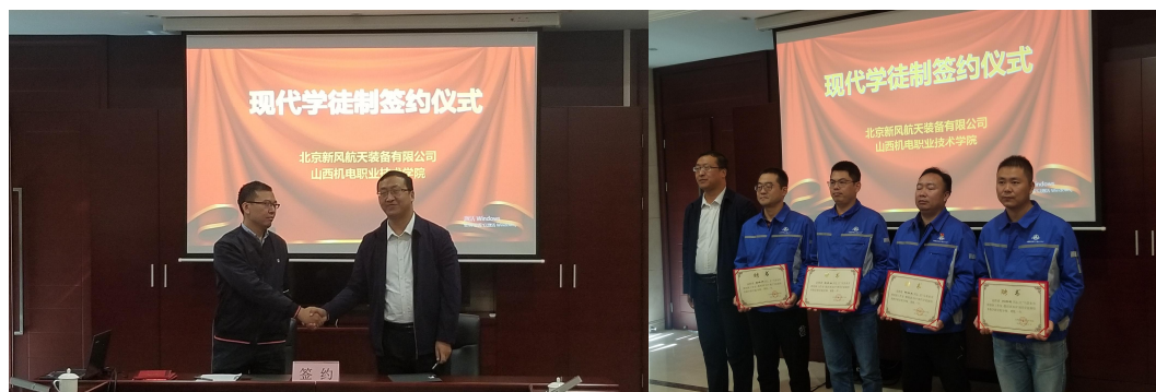
图3 现代学徒制签约仪式

制定的培养协议明确“企业与学校”的办学双主体，在为企业培养人才储备的同时，解决了拓展了学生就业的渠道，提升了学员的就业质量。企业及学院领导分别为学校导师、企业导师颁发了导师聘书。