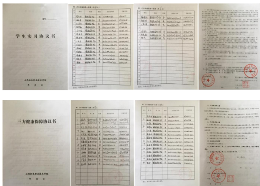
图 8 学校、企业、学徒三方协议

现代学徒制班开班以来，高度重视学员的生产生活安全，在进入工厂之初就进行了学校、企业、学员三方的实习协议书、健康保障协议书的签订。尤其是在 2021 年底，疫情形势变的严峻，学校指导教师与企业共同维护学生的防疫安全、生产安全，通过学习通打卡签到实时了解学生的健康情况，通过校内指导教师与企业带徒师傅及管理者的远程连线定期会议，为学员的健康与安全保驾护航，及时发现并完善监督工作，确保安全不放松。