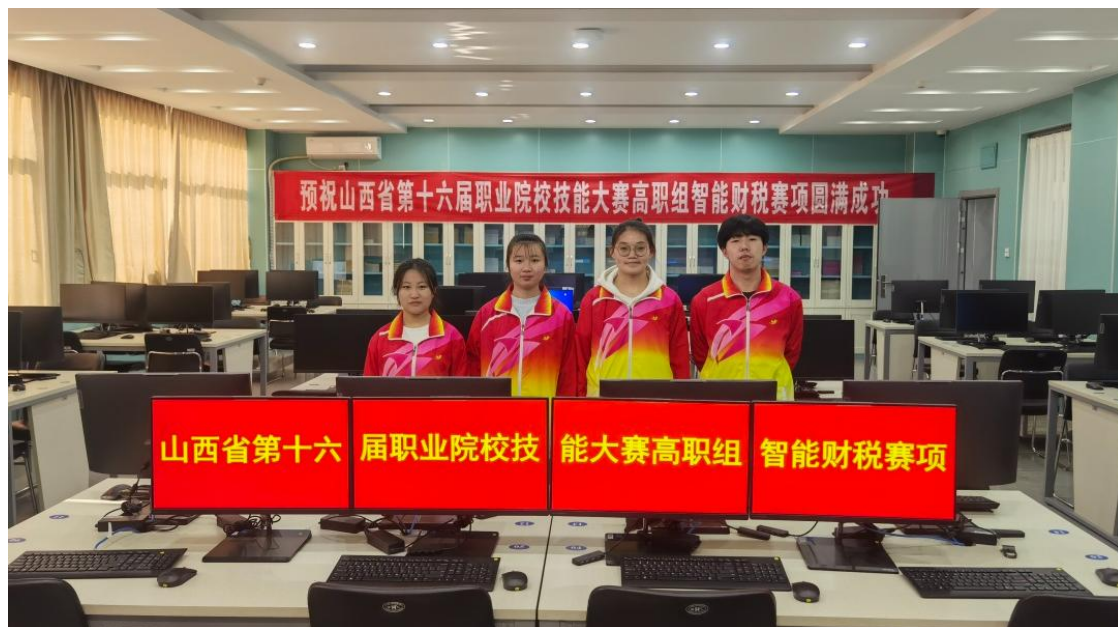
图 5：第十六届职业院校技能大赛智能财税赛项

校技能大赛智能财税赛项高职组学生赛和教师赛圆满落幕。 来自山西省 19 所高职院校的 34 支队伍 136 名选手和 34 名教师参赛。