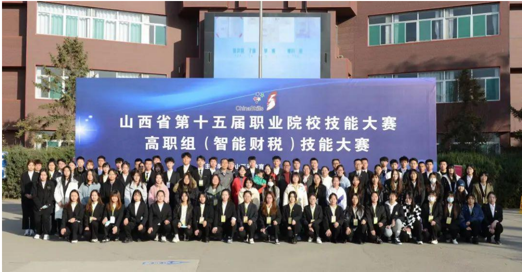
图 1：第十五届职业院校技能大赛智能财税赛项