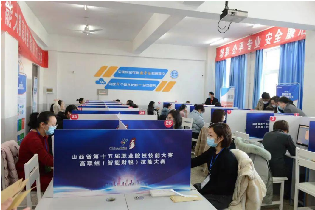
图 3：智能财税赛项教师组赛场