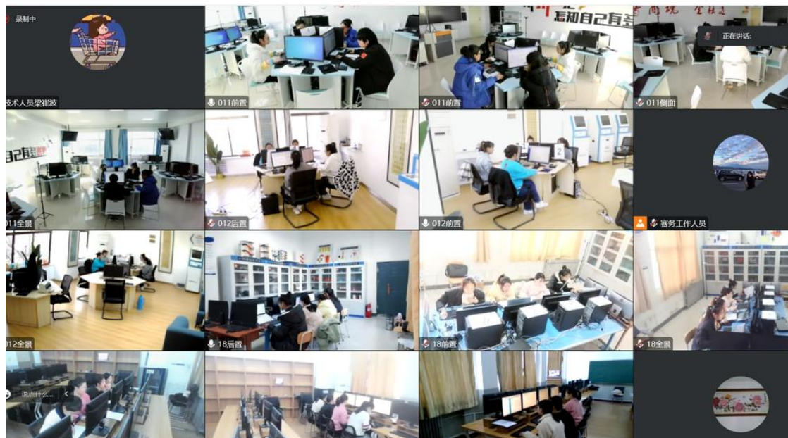
图 6：智能财税赛项线上赛场