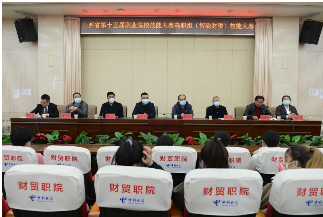
图 4：智能财税赛项闭幕式