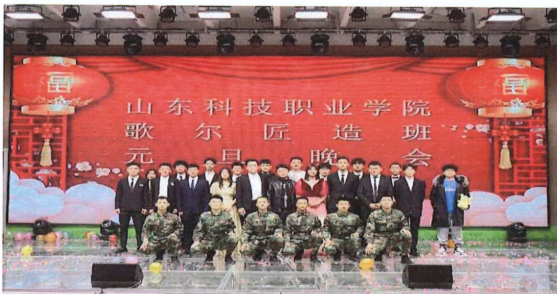
匠造专班开展元旦晚会活动

徒“双重身份”人才培养模式。依据校企共同制定《校企联合招生招工办法》，校企共同组建“匠造专班”，每班学生40人，单独组班进行教学与管理。