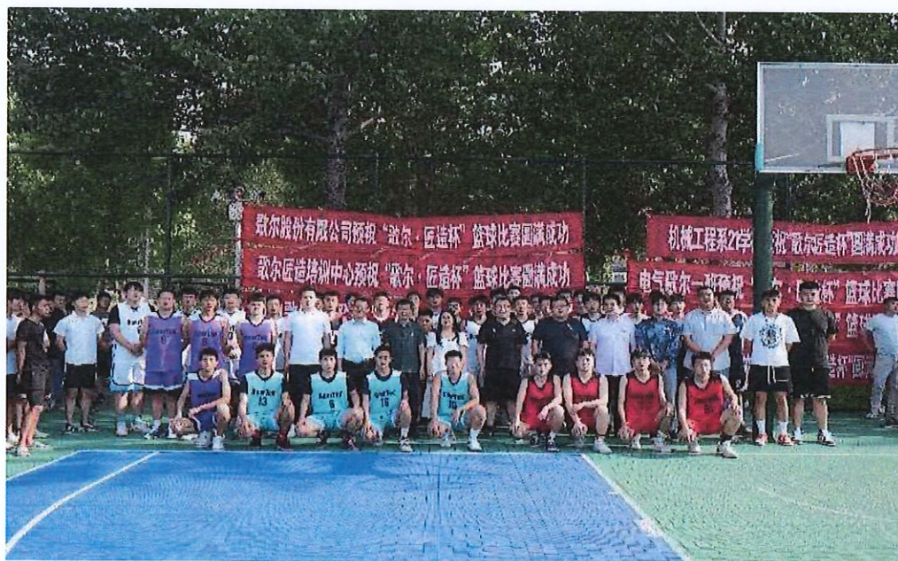
组织歌尔班篮球比赛活动