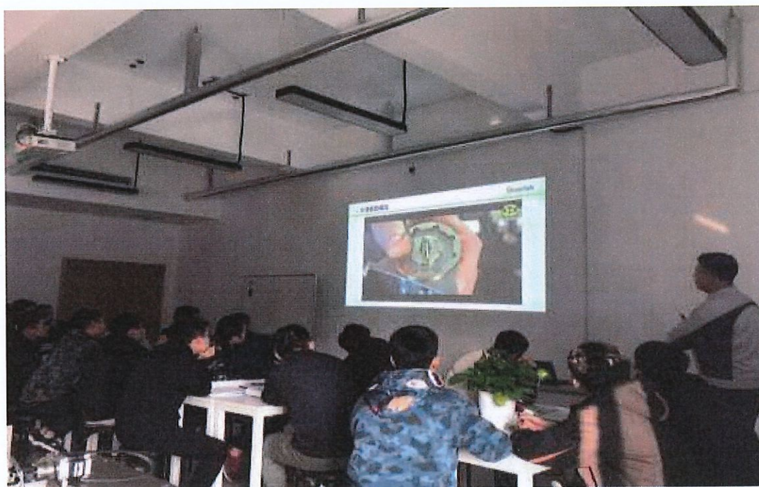
企业师傅为学徒授课

在与歌尔股份有限公司共建“歌尔匠造专班”、共建专业、共同开发课程、共同打造“国际化校企双栖型”教学团队的基础上，为确保校企合作与专业建设的顺利实施，进一步深化合作，成立以二级学院院长为组长，专业带头人、骨干教师和行业专家为主要成员的专业建设领导小组，对专业建设方案的整体实施工作进行统一协调、指挥、监督、组织和实施。小组下设“项目实施工作小组”，负责该项目的建设与发展。实施项目管理机制，将专业建设任务分解为子项目建设，对子项目进行检查、跟踪，保证各子项目按照既定的质量标准按时完成。