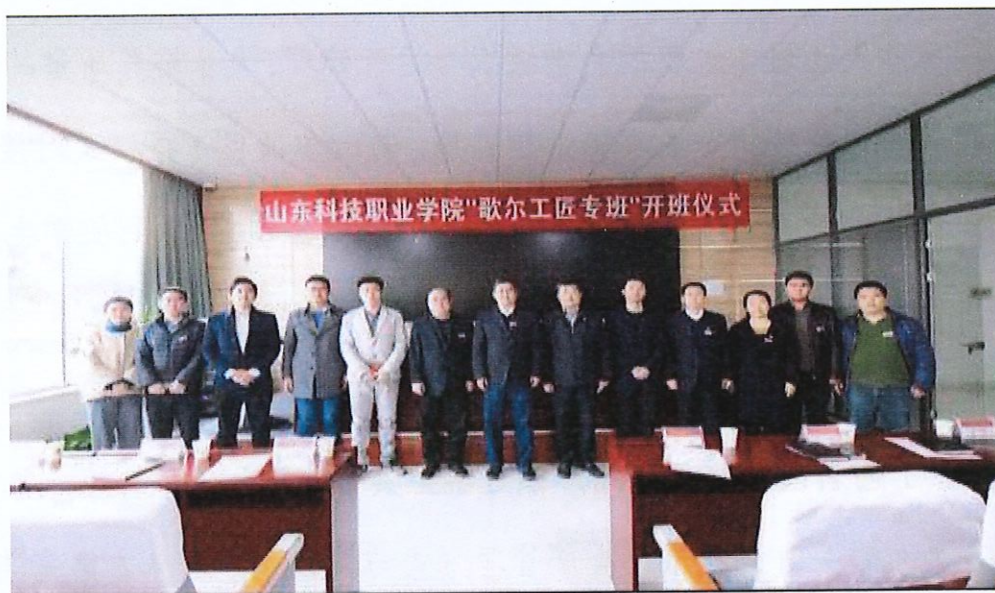
山东科技职业学院歌尔工匠专班开班

学模式。双方合作共赢、职责共担，按照新型学徒制模式共同培养，共同制订人才培养方案，共同开发岗位技能课程与教材，共同组织课堂教学与岗位技能培训、职业资格考证、师资队伍的建设与管理、考核评价等，形成校企协同、合作育人、联动发展的长效机制，不断提高人才培养的质量和针对性。