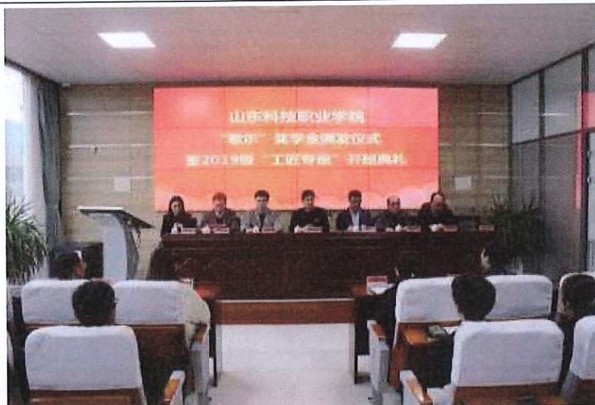
“歌尔”奖学金颁发仪式