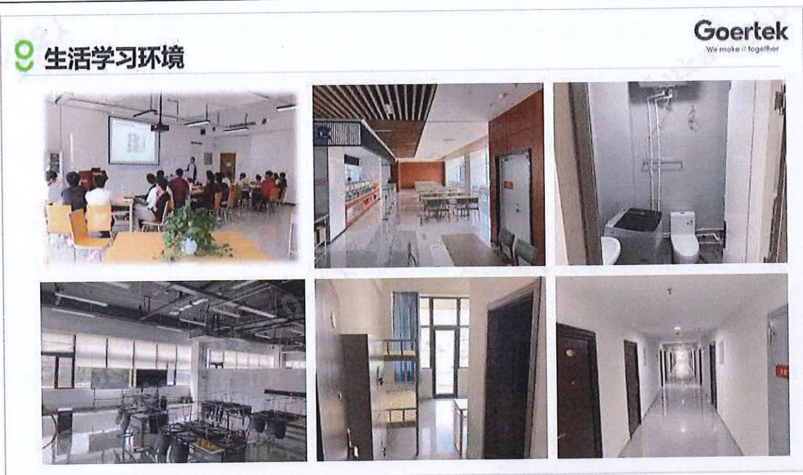
歌尔匠造培训中心照片