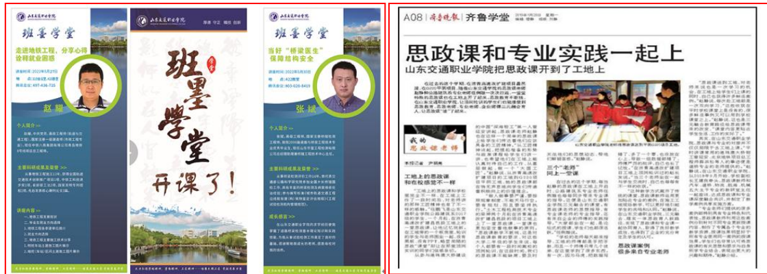
图1 企业进学校、思政进工地