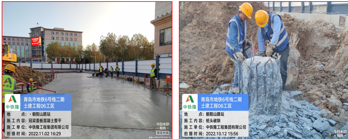
图 6 参建青岛地铁六号线实习学生采影

中铁隆企业领导高度重视、创新引领、多措并举，不断推进校企合作深入发展，公司领导层多次走进校园，与师生们进行深入交流，面对面将企业文化送到校园，让学生们明白好的企业文化在企业健康快速发展中的作用，加深学生们对行业的了解，解决学生关心的就业问题等，通过交流开启了校企合作的新篇章，在临淄高速项目成立校企联合实训基地，并于2022年6月30日在淄博黑铁山项目开展党建共建主题党日活动。