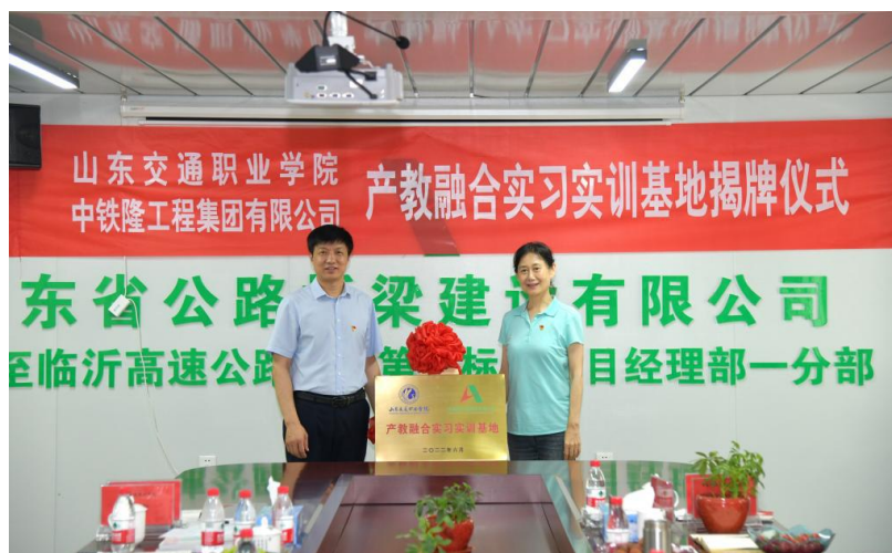
图8 产教融合实习实训基地揭牌仪式

学生岗位实习阶段，由企业技术骨干和专业指导老师联合指导，在工程重点领域进行技术攻关，组建岗位实习提升班。目前，已组建3年度跟岗实习提升班，学徒制学生62人，全部纳入齐鲁工匠后备人才培养计划，为企业的人才供给提供动力，奠定技能提升人才供应地。