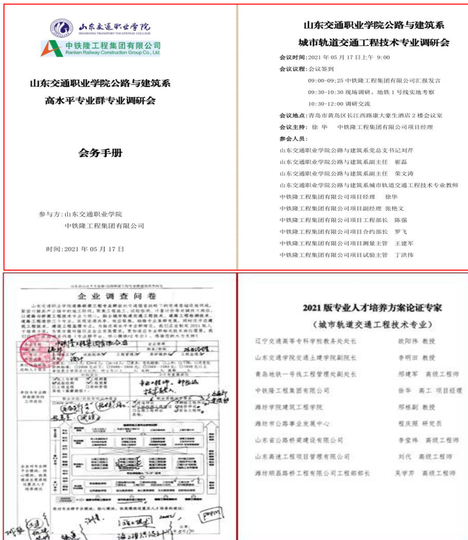
图 4 走访企业、校企共同修订人才培养方案

校企共建城市轨道交通工程技术专业成立校企合作订单班-“技能精英班”，将产教融合的时间节点向前推移到招生宣传节点，在原有校企联合的基础上，推进校企人才共培共育，同时，利用技艺技能传承创新平台实现校企联合资源共享，打破时间和地域的界限，打造了城轨工程技术专业产教用新范式。经过校企双方的研究与实践，在“技能精英班”人才培养目的共同驱动下，通过校企合作，产业融合办学，充分体现“产学研培”四位一体的优势，积累了一定的合作经验。