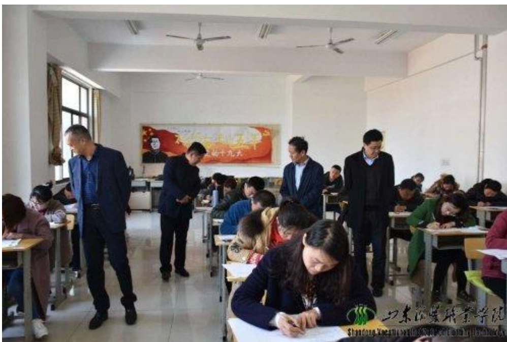
图6 集团国际贸易业务考试

2018年3月24日，岱银集团国际贸易业务考试在我院进行。学院共设立9个考场，岱银集团200余人次参加考试。学院教务处严格按照岱银集团人力资源部的考务要求，狠抓考试安全，强化考试各环节的安全保障工作和应急预案准备，考试工作组织严密、管理规范、监考严格，为考生提供了一个公平公正的考试环境。