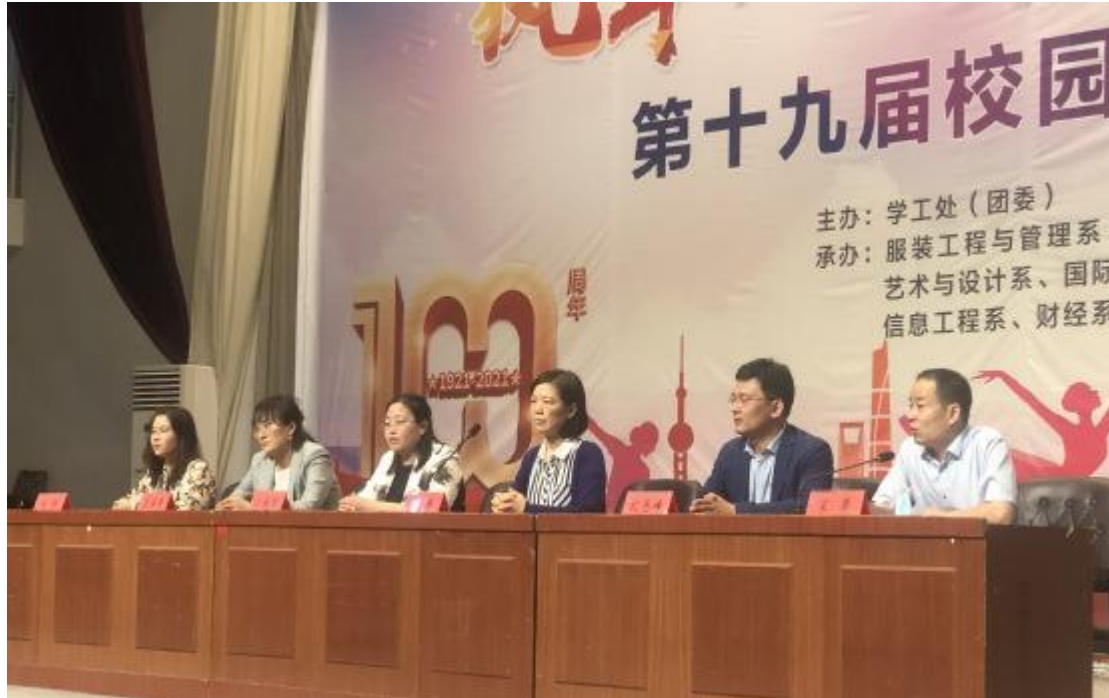
图5 公司在给专业学生做实习宣讲

师制”，学院和公司分别为学生配备校内指导教师和企业实习指导教师，由双方共同管理学生。学生在完成学业和顶岗实习，经学院和企业考核合格后，即可直接留在企业工作，实现学习与就业的无缝连接。