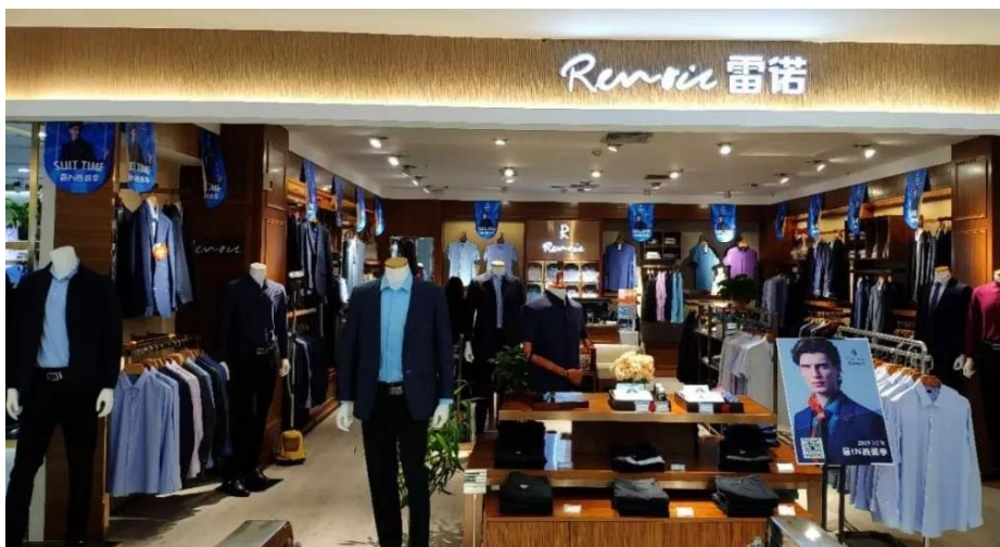
图 1 雷诺服饰专卖店