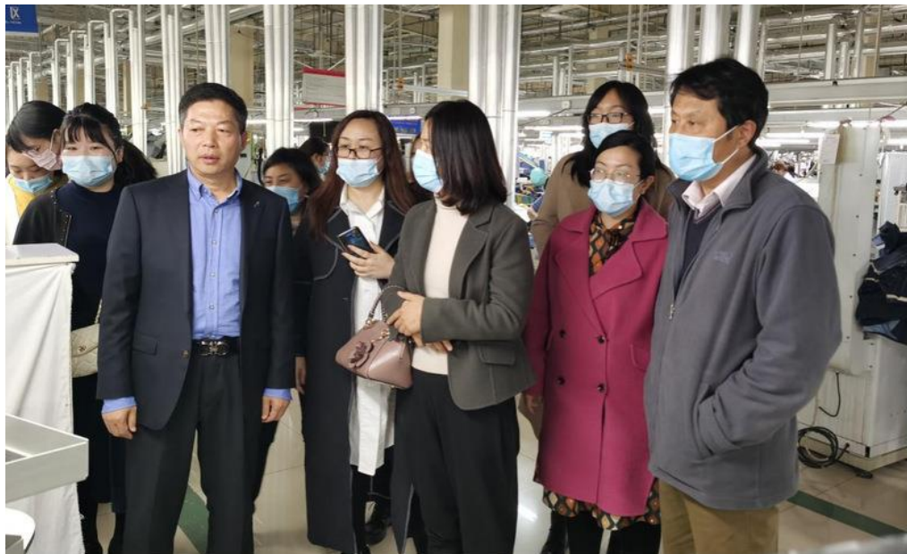
图3 专业教师到公司参观学习

场需求，进行大胆改革创新，不断修订完善专业人才培养方案；继续探索实施校企双元育人的人才培养模式，提高学生职业能力，实现教学与实践的零距离、毕业与上岗的零过渡。