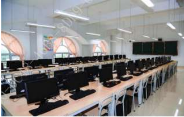
电子类实训中心 实训教室综合楼计算机房, 154 m 2