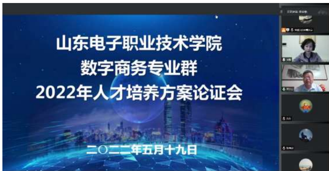
图 2 人才培养论证会

在教学方面，2022 年年度，教学主要分为以下 2 个方面：一方面是在校学生的授课教学管理工作，一共承担 9 门课程教学工作。另一方面是实习就业学生的管理工作，确保 19 级学生顺利毕业，20 级学生顺利入企实