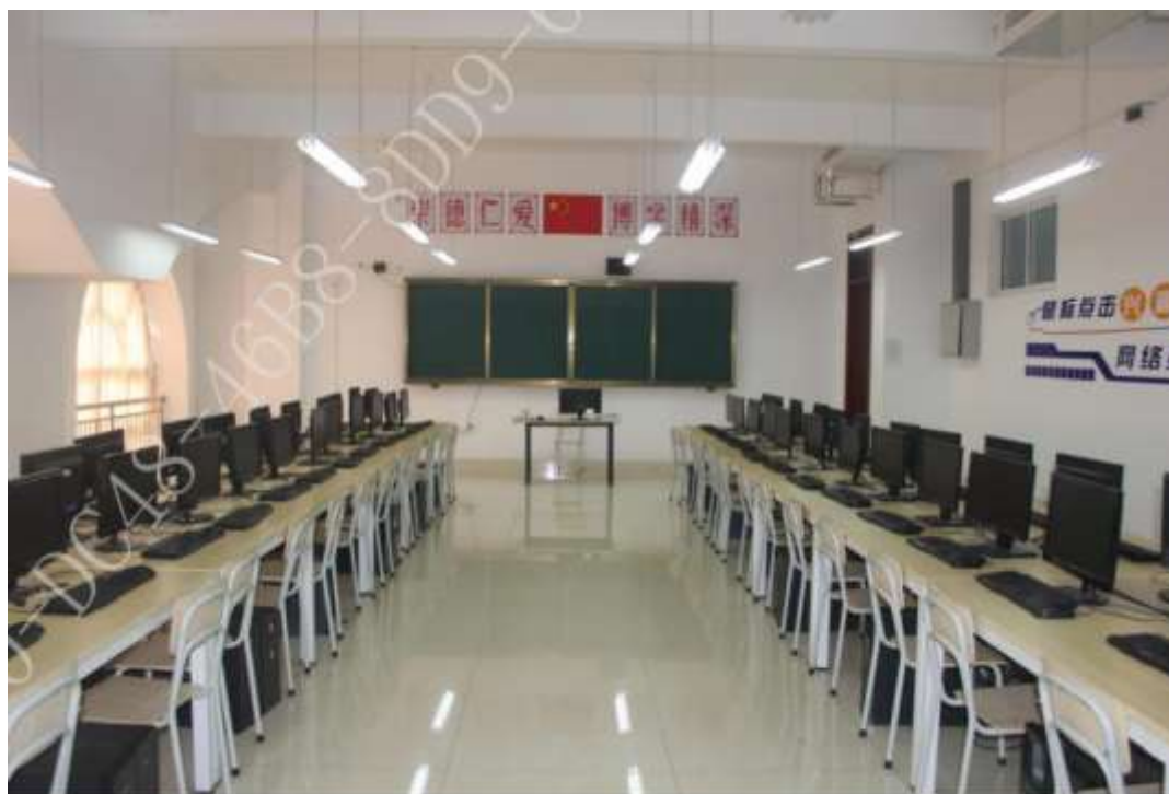
网店运营推广师 实训教室综合楼2楼机房，104 m 2