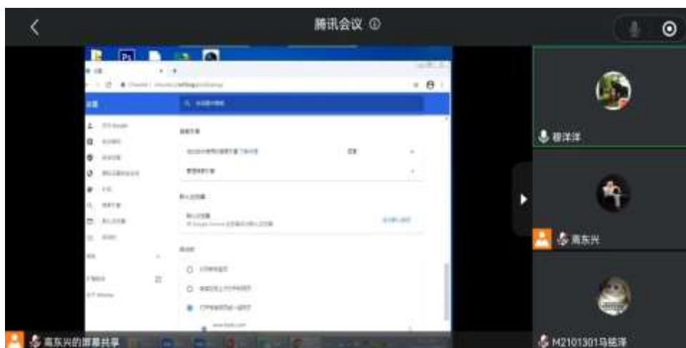
图 3 教学部分照片

招生宣传方面，特亿宝公司积极配合学校开展招生宣传工作，特亿宝公司通过微信公众号、集团企业官网、微信等社交工具，多方位的进行学校的推广宣传工作，在济南市深泉外国语学校高三学生进行学校宣传，鼓励学生学生报考，同时积极参与学校线下招生宣传工作，在聊城、日照等地区参加高考咨询会。