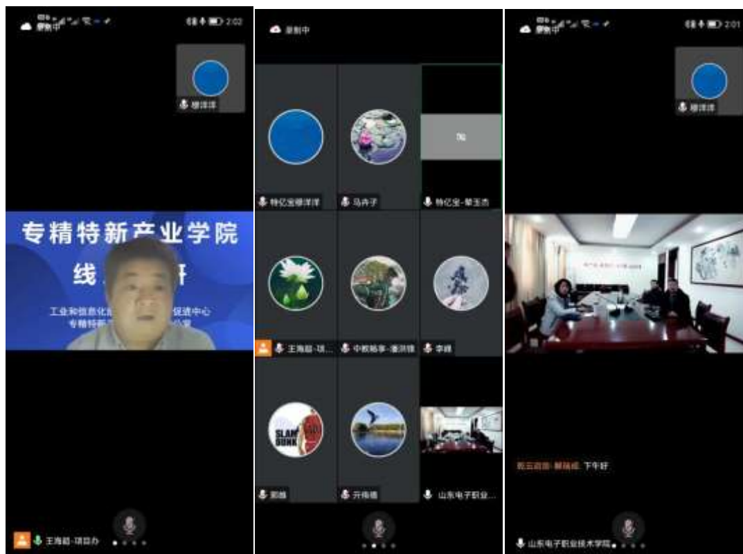
图 1 产业学院调研会