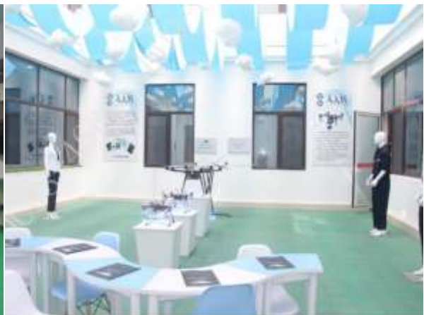
北人的操作维修工 实训室综合楼一楼展厅, 100