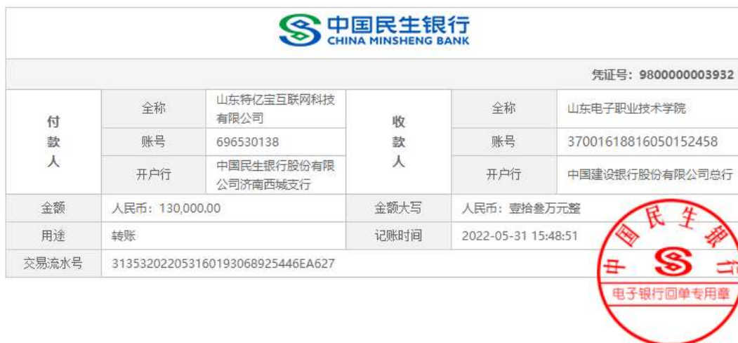
图 6 经费投入