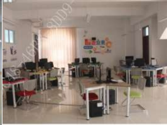
计算机中心综合楼计算机实训室, 102 m 2