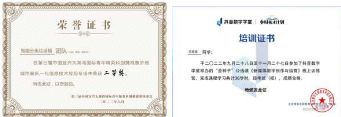
图5 能力提升培训证书

在能力拓展方面，特亿宝公司配合学院积极推动学生参加技能培训、技能大赛。先后参加“新媒体数字创作与运营”培训并取得证书，参加《第二届全省乡村振兴技艺职业技能竞赛农产品视频营销项目大赛》《宜兴太湖湾国际青年精英科创挑战赛》都取得不错成绩。