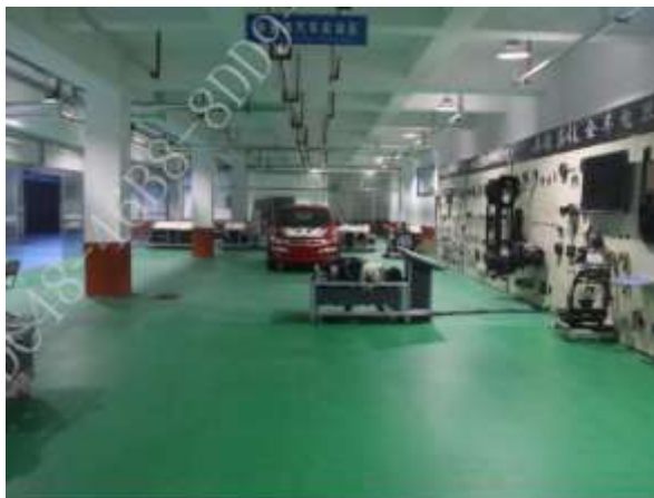
新能源汽车维修工 实训室综合楼地下一层, 1300 m 2