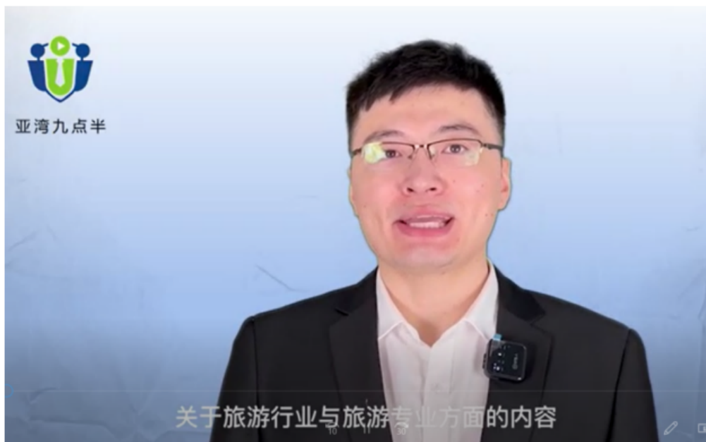
图 14 学校与企业合作开发的课程