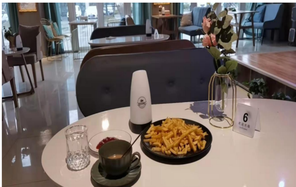
图 4 校内生产实训基地-航院西餐厅