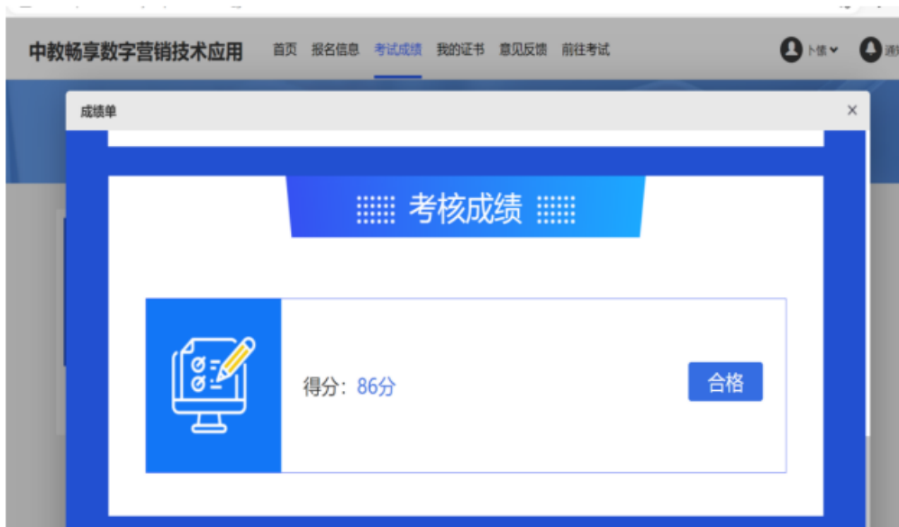
图 12 校内教师考取酒店数字营销师资证书

2. 建设了一支能够满足教学需要的高素质“双师型”专兼教师队伍，设有产业教授岗；企业拥有相关专业方向的师资团队，开展校企教师联合授课，企业师资数量与学生培养规模匹配。