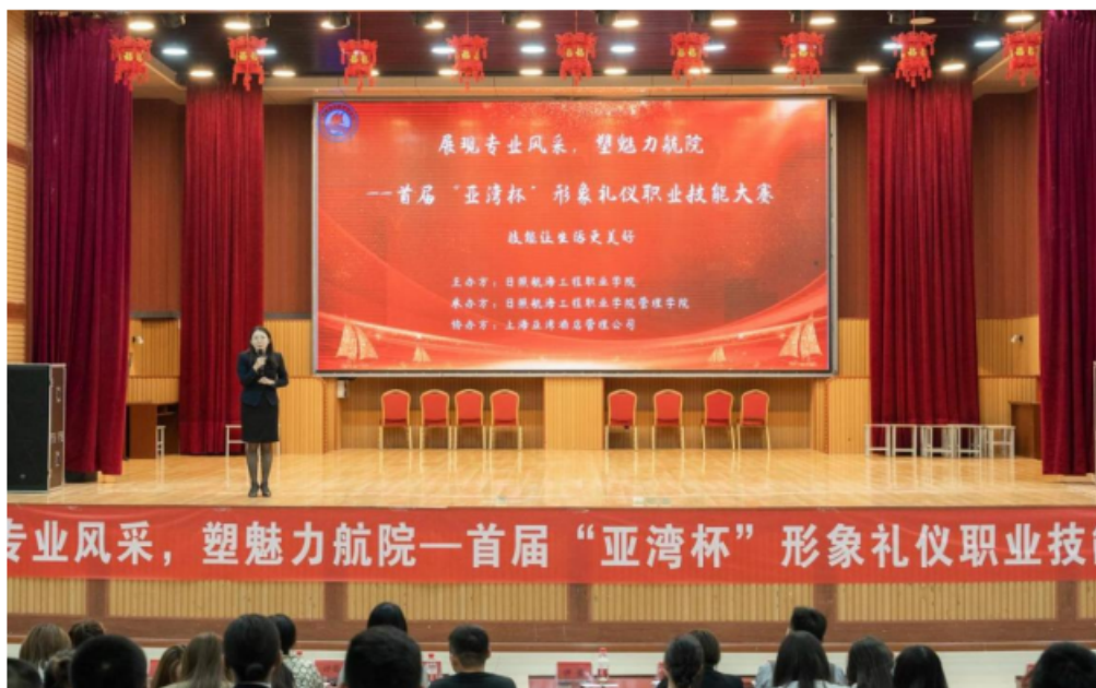
图 16 “亚湾杯”职业技能大赛

坚持以技能比赛为引领，每年根据人才培养方案课程的开设情况，举行“亚湾杯”系列酒店礼仪、职业素养、导游解说等比赛。