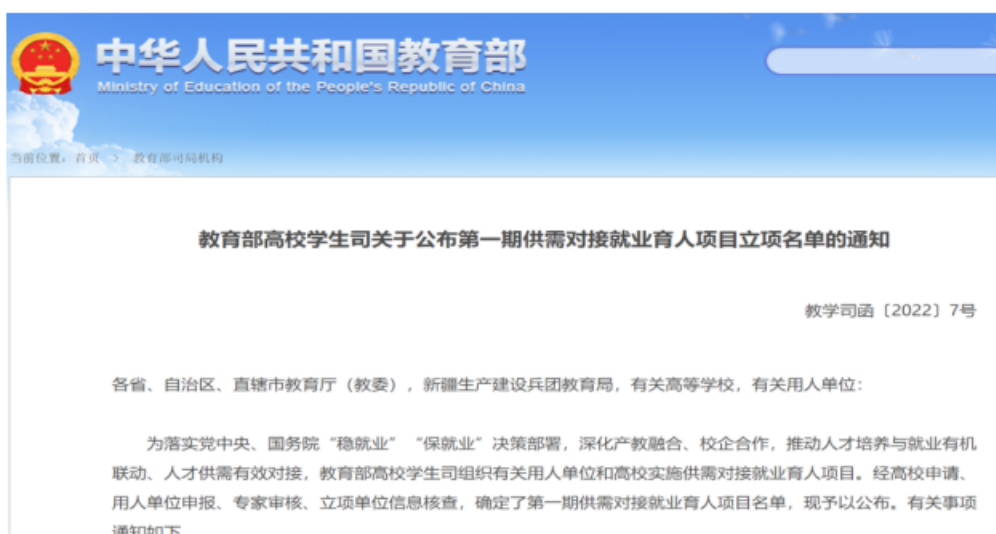
图 1 教育部高校学生司公布的第一期供需对接育人项目立项名单

依托 2021 年日照航海工程职业学院和上海亚湾合作申报的教育部校企供需对接育人项目，上海亚湾投资 45 万元和学校共建实训基地。基于文旅产业行业企业的服务产品、用人要求和发展趋势，计划三年建成符合产业发展和创新需求的实践教学和实训实习环境。创新多主体间的合作模式，共建功能集约、开放共享、高效运行的“带路空间”（以酒店服务与管理为主的文旅服务综合体，总面积不低于协议约定的“酒店管理与数字化运营专业”年均招生规模生均 5 m 2 标准）。