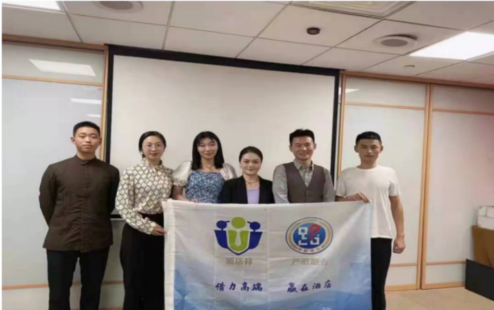
图 13 学校派教师到企业挂职工作