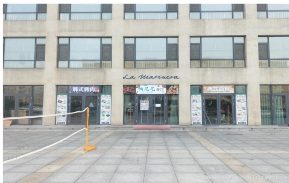
图 5 校内生产实训基地-航院西餐厅