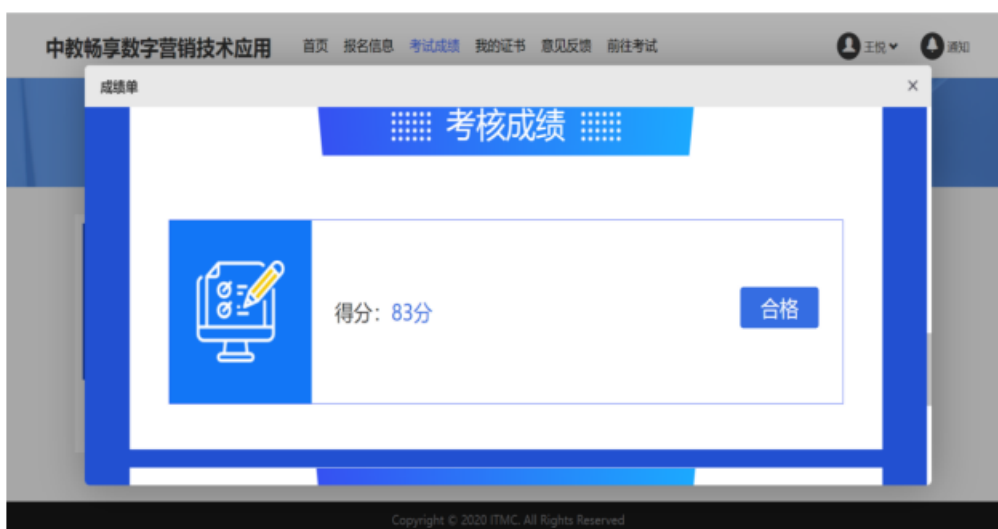
图 8 校内教师考取酒店数字营销师资证书