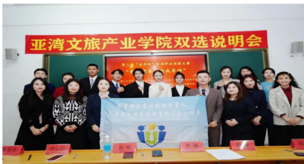
图 18 学校举办的职业技能大赛

1. “订单班”式的培养，直接将酒店需要的技能和培训搬进了课堂，大大提高了专业学习的针对性，提高了学生的素质和酒店需求的契合度。学生在校完成教学计划规定的全部课程后，采用学校推荐与学生自荐的形式，到合作企业进行为期半年以上的岗位实习，学校和用人单位共同参与管理，合作教育培养，使学生成为用人单位所需要的合格职业人。