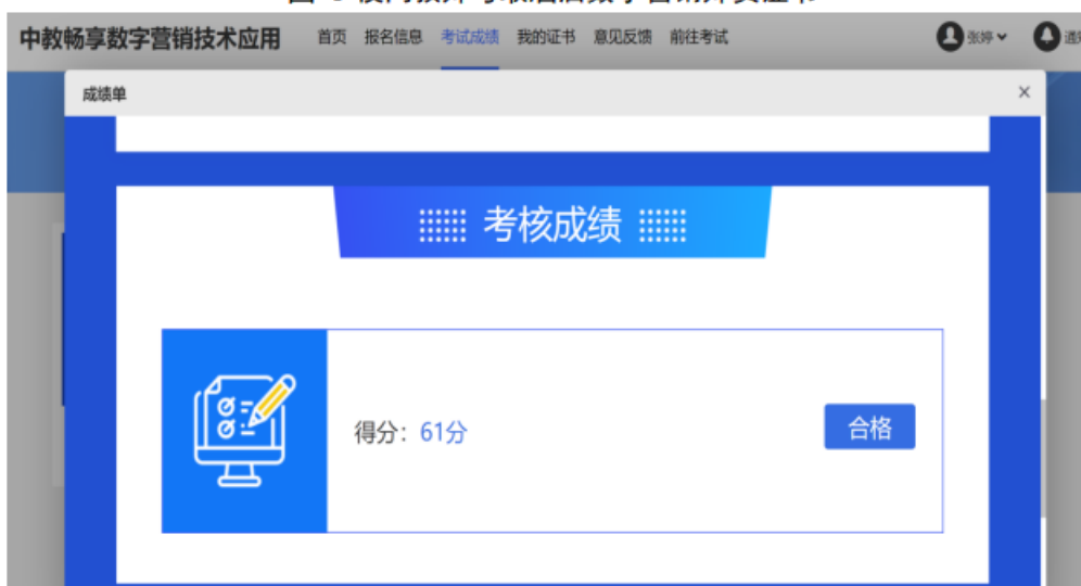
图 10 校内教师考取酒店数字营销师资证书