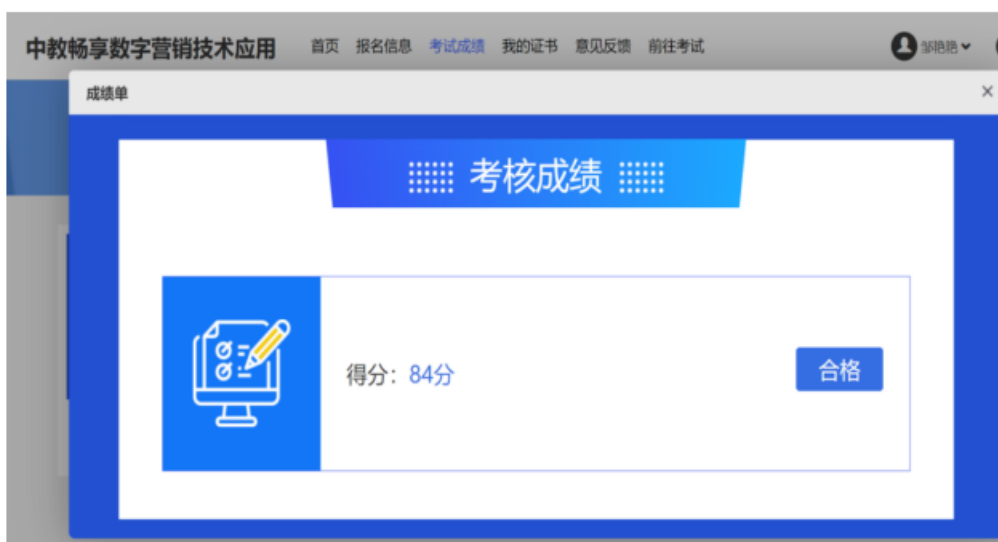
图 7 校内教师考取酒店数字营销师资证书

1. 建立校企人力资源共建共享机制，学校教师和企业技术专家双向流动、两栖发展；建立产业学院教师工作室（坊）和高素质“双师型”教师培养培训基地，经过培训校内教师全部取得 1+X 酒店数字营销师资证书。