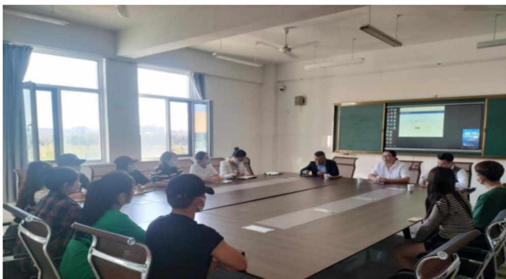
图 6 学校与上海亚湾研讨合作育人

2. 双方联合制定体现产教融合特色以及技能型人才培养要求的人才培养方案，更新专业建设标准、优化专业课程体系，丰富专业教学活动。探索形成“1+0.5+0.5+1”分段培养方式，做好“识岗-跟岗-岗位实习”递进实习，实践教学时间累计不少于1年，实践教学学分不少于总学分的35%。将创新创业教育融入产业学院的专业教学体系，实现创新创业目标在素质教育、专业课程、教学评价等方面有效融合，做强校内专创融合。