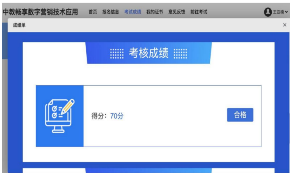
图 9 校内教师考取酒店数字营销师资证书