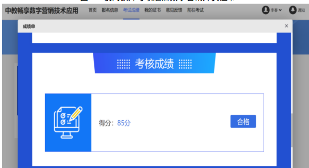
图 11 校内教师考取酒店数字营销师资证书