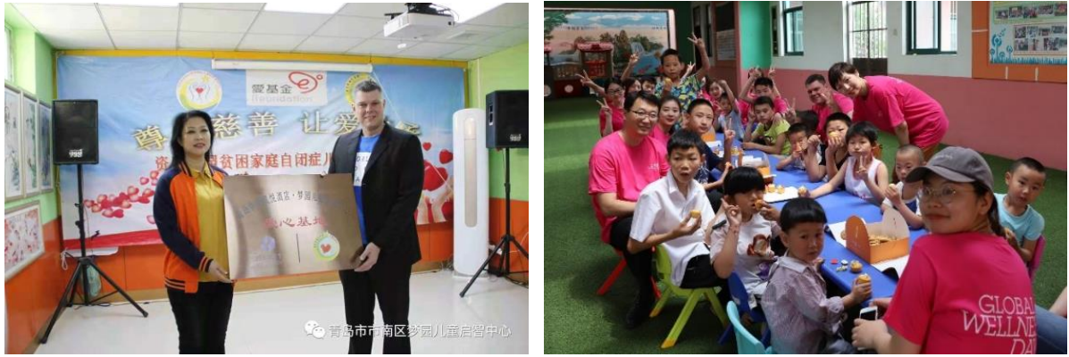
图 1-3：青岛鲁商凯悦酒店“凯悦繁荣计划”项目