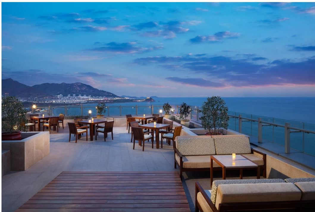
图 1-2：青岛鲁商凯悦酒店 21 楼行政酒廊露台

凯悦酒店集团素以享誉国际的创意美食而闻名全球，青岛鲁商凯悦酒店将凯悦独树一帜的餐饮文化完美沿袭，具有独到见解的资深厨师、现代时尚的餐厅设计，这里已经成为青岛颇受瞩目的美食聚集地。