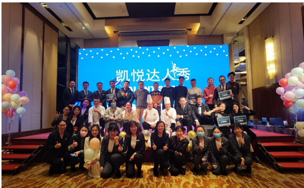
图 4-2：青岛鲁商凯悦酒店“凯悦达人秀”员工活动