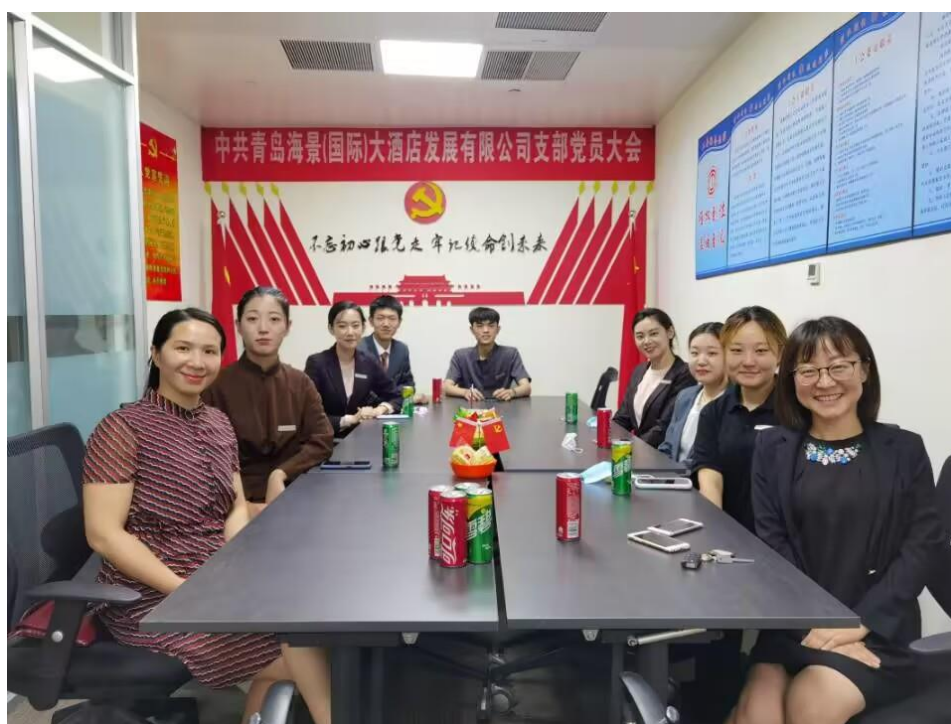
图 2-6：酒店专业两名教师（左一和右一）到酒店挂职研修

利用寒暑假期间，青岛鲁商凯悦酒店为合作院校教师提供两周到四周的挂职机会，通过不同酒店部门的挂职培训获得业界实践经验，丰富课堂授课内容。在学期中，为教师提供挂职研修机会，提供一线操作实战经验，提升教师实践水平。根据学院的教学需求，人力资源部给老师设计培训计划，指定专门部门的负责人作为老师的挂职锻炼顾问，落实培训计划。酒店协助老师进行行业的各类统计调查。酒店成为部分高职院校教师研修基地，定期为教师进行行业技能培训。