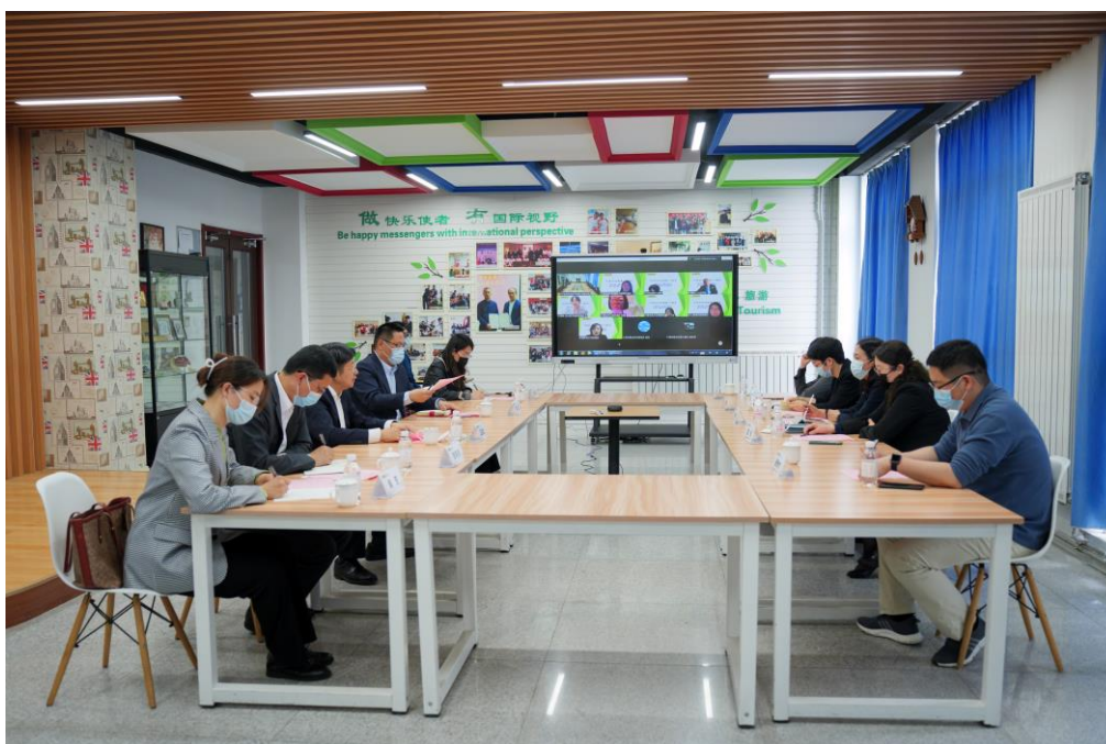
图 2-1：青岛鲁商凯悦酒店高管参加校企座谈会洽谈深度合作

酒店管理層高度肯定了青岛职业技术学院酒店管理专业学生在企业的优秀表现，就酒店业转型发展态势下对人才的新需求进行了交流并提出相关建议。青岛职业技术学院实施以“三化”促“三高”发展战略，通过推进“融合化、智慧化、国际化”战略实施，促进“高水平办学、高水平育人、高质量发展”。青岛鲁商凯悦酒店与青岛职业技术学院通过深化校企合作、拓展合作范围、创新合作方式，推动校企“融合化”发展，关注毕业生“高品质”就业，为学生提供更广阔的发展空间和就业出路。