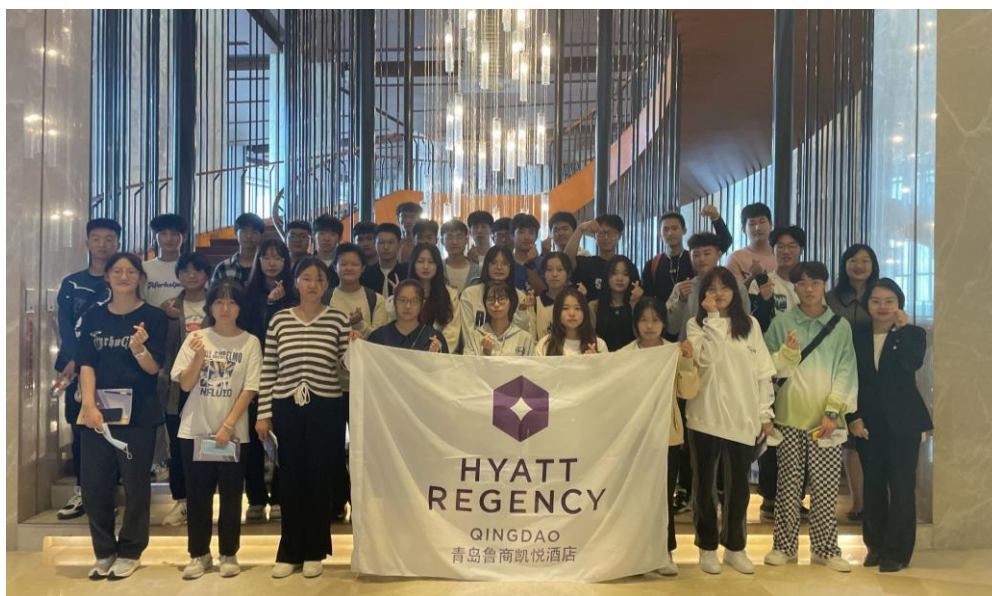
图 2-5：酒店专业大一新生参观青岛鲁商凯悦酒店后合影

每学期为职业院校学生提供酒店参观的机会，通过酒店的参观帮助学生和教师们与业界建立良好关系，并掌握酒店营运的一手资料。参观过程中，酒店管理人员热情地介绍，学生们结合认知积极发问，对酒店前厅、客房、餐饮等部门组织功能有了直观认知。学生们还在酒店经理人员的指导下，对葡萄酒品鉴、咖啡制作、中餐主题宴会设计等进行了现场实操观摩，激发了学生对专业的学习兴趣。通过酒店参观，学生们拓宽了眼界、大大增强了对专业的职业认同感。