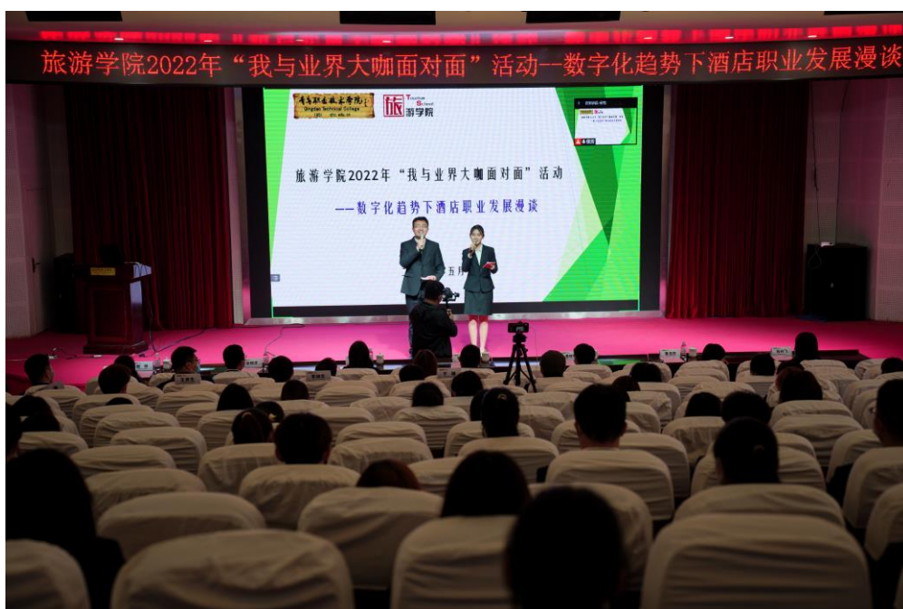
图 2-3：青岛职业技术学院举办“我与业界大咖面对面”讲座

针对合作院校，酒店业界精英通过讲座帮助学生掌握知识、了解职业发展机会和互动沟通，该项目每学期一次，讲座时长两个小时。2022 年 5 月，青岛鲁商凯悦酒店应邀参加了旅游学院举办的“我与业界大咖面对面”活动，活动主题为“数字化趋势下酒店职业发展漫谈”。