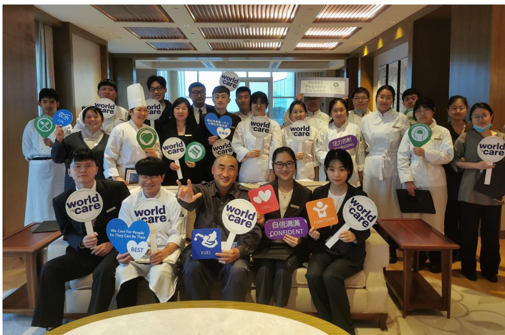
图 4-1：青岛鲁商凯悦酒店员工培训

酒店为员工提供免费每年的定期体检，员工入职后会有两天全天的产品知识和安全生产培训，员工进入岗位后会定期开展岗位安全知识培训。同时，酒店也非常重视员工的身心健康，定期举办心理讲座和瑜伽类，球类运动，在员工工作的同时放松身心。