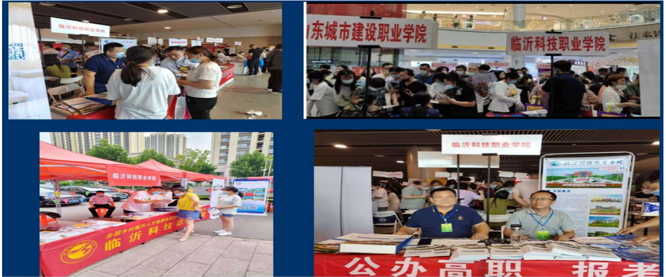
3、2022 年招生区域划分情况一览表