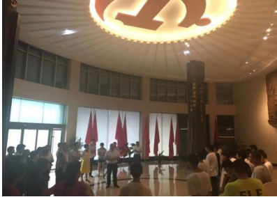
学生及学生家长参观泰钢精神展馆