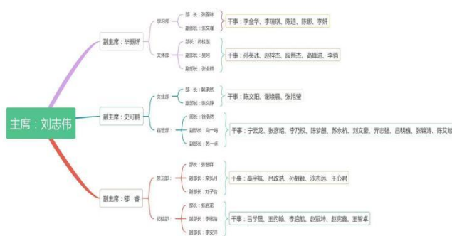
学生会组织机构图

明确了每个部门的职责及工作要求，构建起了学生与老师之间沟通的桥梁，推动了泰山钢铁学院学生管理工作的深入有效开展，同时也为学生的自我成长提供一个展现自我价值的平台。