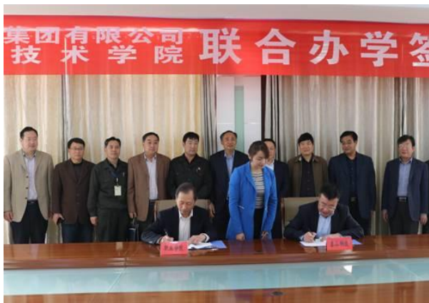
联合办学签字仪式