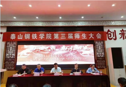
泰山钢铁学院第三届师生大会

在学生管理中，强化正向引导教育，设立奖学金，评选优秀学生，树立正面典型，召开学生大会集中表彰奖励，有效激发了学生的学习积极性，营造出了良好的学风。2020-2021 学年，3 名学生获得国家励志奖学金，多名学生获得莱芜职业技术学院奖学金，30 名学生分别获得泰山钢铁学院一、二、三等奖学金，并在泰山钢铁学院全体学生会上受到隆重的表彰奖励。