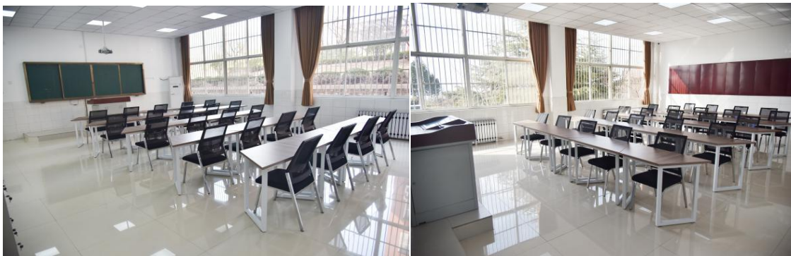
泰山钢铁学院教室