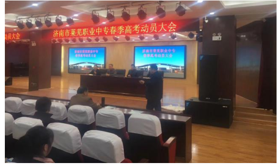
招生动员会招生宣讲会