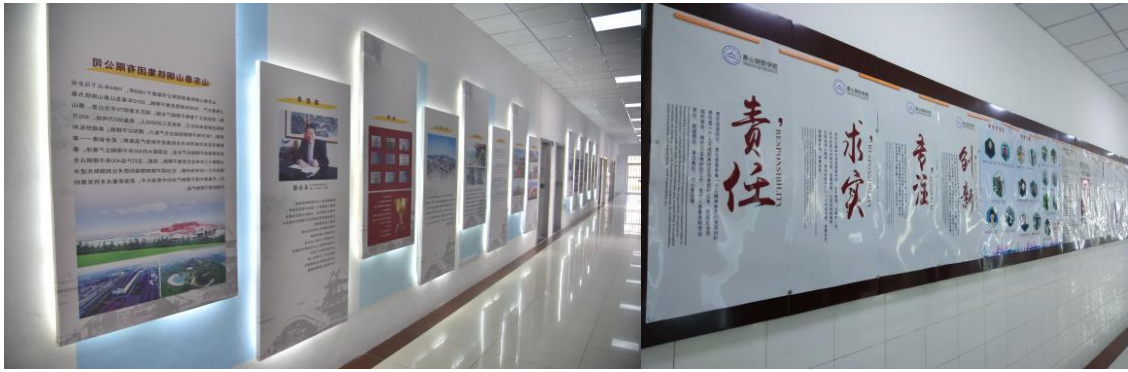
泰山钢铁学院自建文化走廊