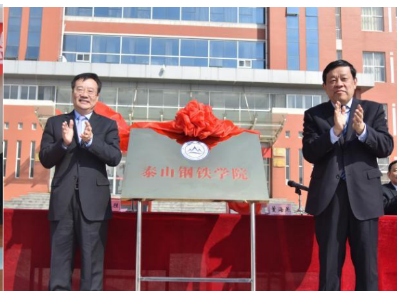
泰山钢铁学院揭牌仪式