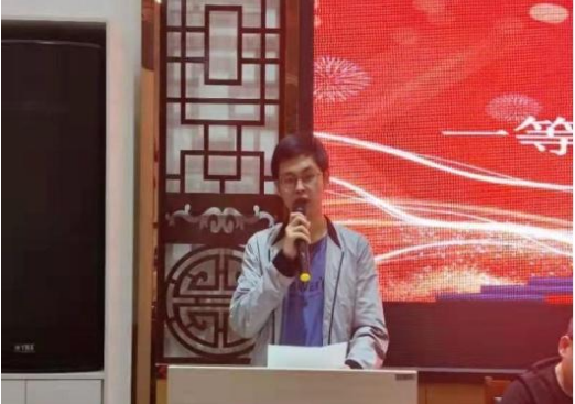
优秀学生代表发言