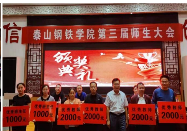
优秀教师、优秀班主任颁奖仪式

泰山钢铁学院的育人模式盘活了师资团队，促进了双师教学团队建设，通过柔性引进高层次人才，培育高水平专业带头人，实施教师能力提升计划等措施，教学团队的教学能力、科研创新和社会服务能力大幅提升。相关专业教学团队先后被评选为山东省优秀教学团队、学校黄大年式教学团队，争取各类省市级科研项目 38 项，获国家专利 89 项，发表研究论文 102 篇；获省教育厅科研成果一等奖 2 项、二等奖 2 项、三等奖 3 项；为 20 余家企业提供技术咨询服务 300 余次，解决技术难题 30 余项，为企业举办各类社会培训 1000 余人次。