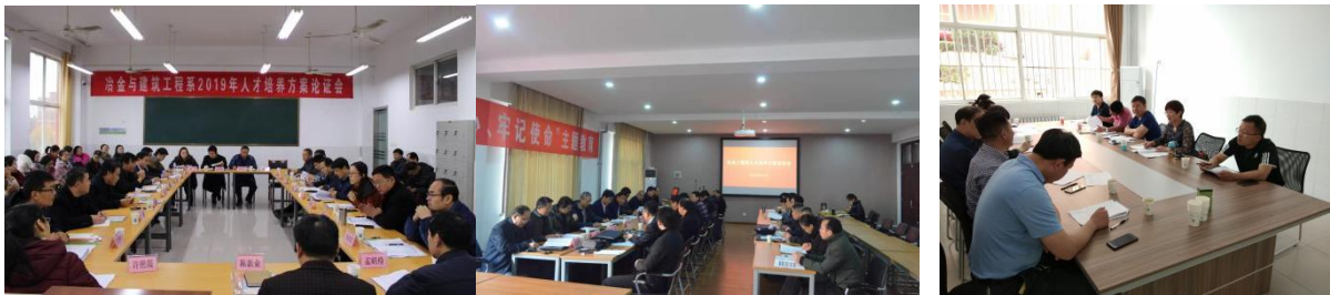
人才培养方案论证会课程研讨会

根据企业人力资源规划，结合岗位实际需求，校企双方选派优秀教师、专业技术人员召开研讨会，确定岗位群、核心专业课程以及人才培养目标，有针对性地制定教学计划，优化理论课学习内容，强化实训技能学习效果，提高人才培养方案的针对性和实用性。