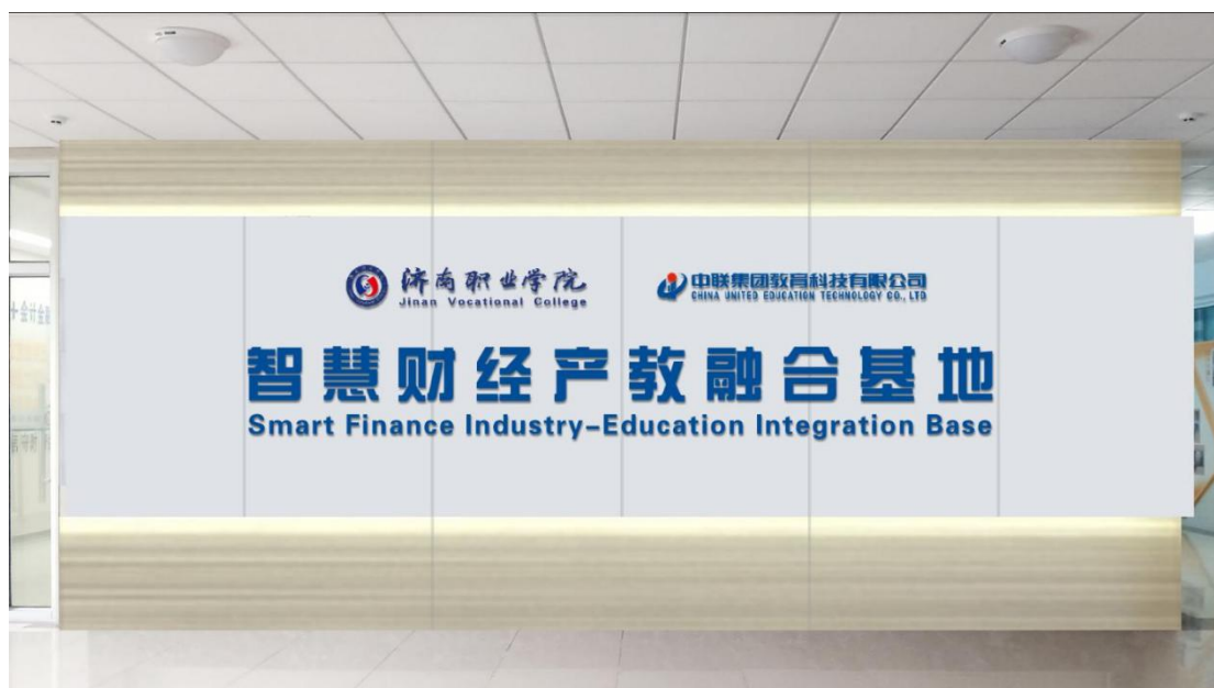
图 12 中联-济职智慧财经产教融合基地

区块链、OCR、RPA 等新技术形成的财经服务社会共享的新业态，将现代财经服务产业实际工作平台及企业供应链、发票链、资金链、财务链、税务链等现代财经产业链真实工作场景和流程引入职业教育，满足学生了解现代财经业工作环境、掌握产业升级条件下真实业务处理技能，掌握现代信息化技术在财经领域的应用，让学生的学习内容更符合产业发展的实际需要，实现产教融合。项目建设依托乙方具有引领性的财经产业优势和丰富的行业企业数据，将企业财经业务落地课堂，实现智慧财经共享业务实战，旨在培养智慧财经产业 4.0 时代下具有智能财税专业胜任能力、有实务经验的高潜质“员工”，达到职业人的能力标准和上岗要求。