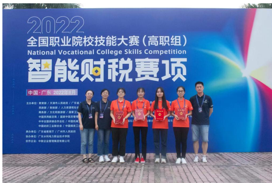
图5 学生获2022年全国职业技能大赛“智能财税”赛项三等奖