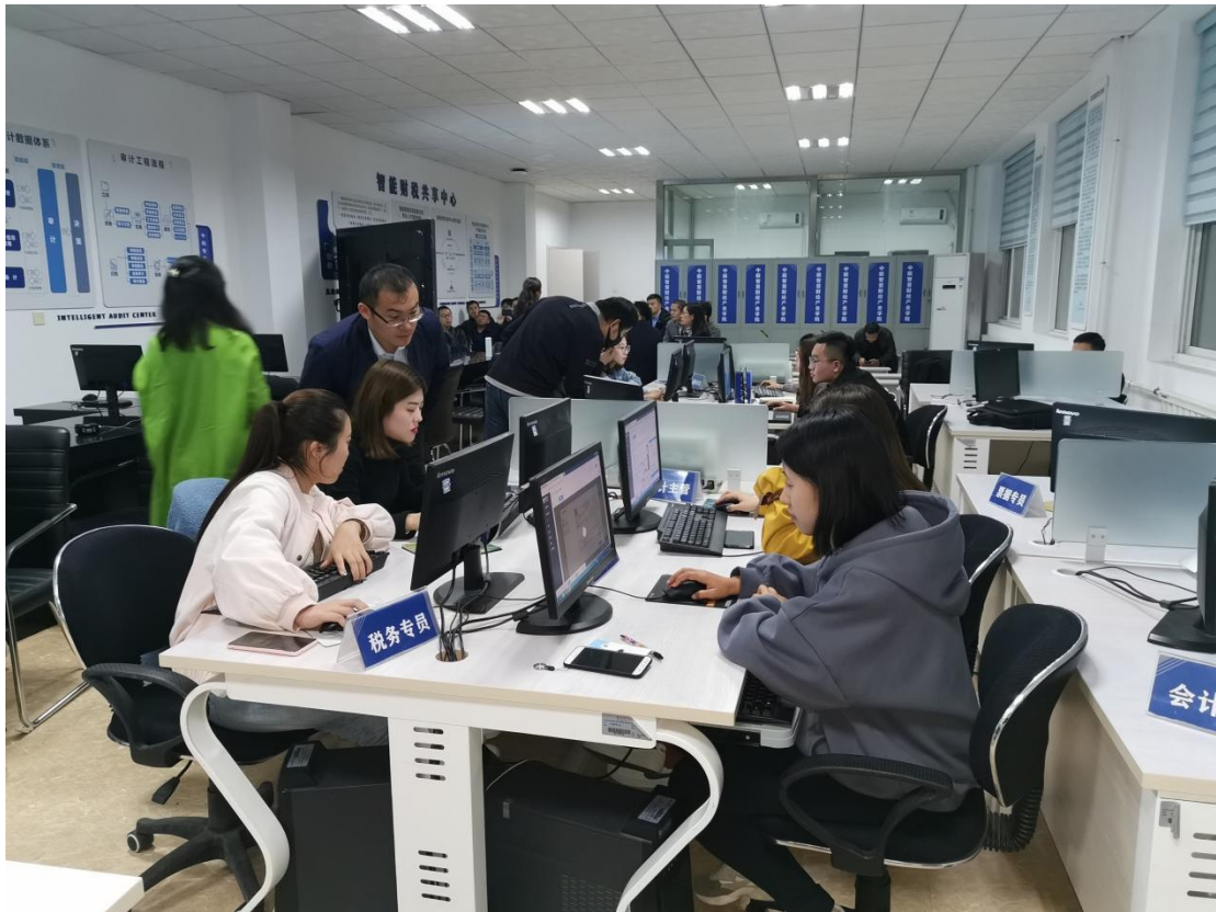
图 6 学生参加生产性实训课程

询服务中心、中小微企业财税数据中心、智能审计函证管理中心。通过产业基地建设，以新型实际训练形式升级原有的专业训练，提高职业技能的学习效果，促进和提升 1+X 证书在学校的落地实施，以可服务产业升级的复合型管理岗位取代传统的会计核算岗位；研究制定智慧财经专业群教学训练环境标准，形成山东乃至全国可借鉴的新模式。