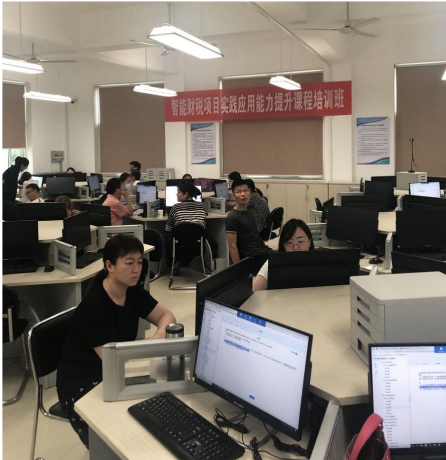
图7 举办山东省“双高计划”引领“双师型”教师培训项目——智能财税提升课程