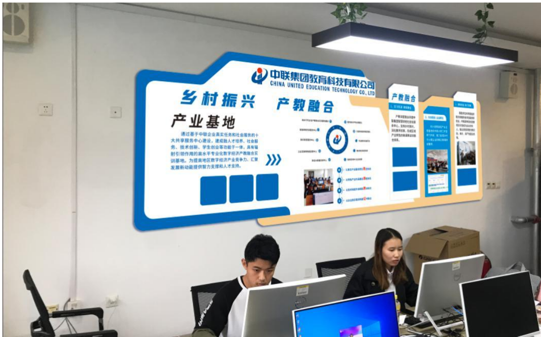
图 8 学生参加智能审计综合实训

(3) 智慧财经产教融合社会服务基地支持乡村“三资”管理代理服务生态及新型农村建设各项专业服务，服务乡村振兴国家战略。