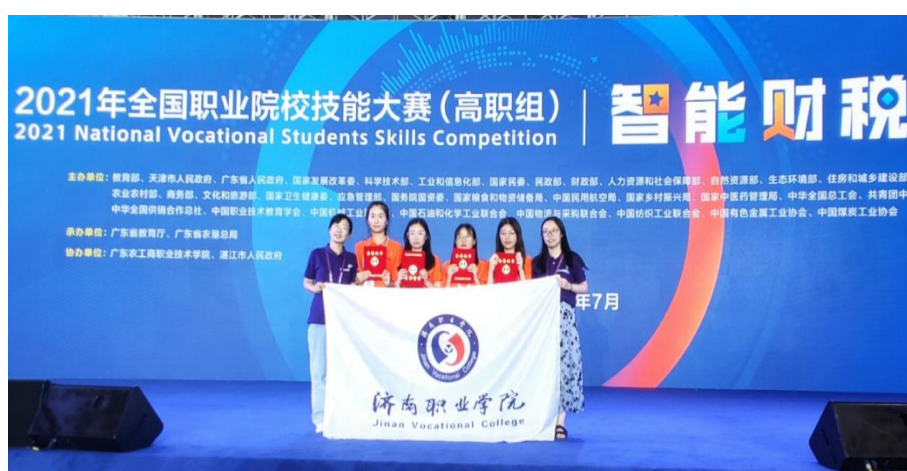
图4 学生获2021年全国职业技能大赛“智能财税”赛项三等奖

根本任务，聚焦财务税务体制改革发展新方向，体现世界技能大赛理念，支撑数字经济与共享经济背景下专业发展趋势。济南职业学院专业学生在智能财税赛项中力压众多传统商贸院校，取得省赛一等奖1项，国赛三等奖2项，圆满完成竞赛任务。优异的成绩充分展现了参赛学生高超的技能和卓越的风采，展示了师生积极向上的精神面貌，实现了“以赛促教、以赛促学、以赛促改、以赛促建”的目标。