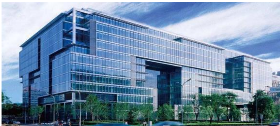
图 1 中联集团教育科技有限公司

机构，其评估已连续八年稳居行业榜首，审计、造价、税务、财务顾问等也处在同行业的前列，年综合收入 20 多亿元。其业务规模和专业水平在国内财经及财经服务领域处于领军地位。