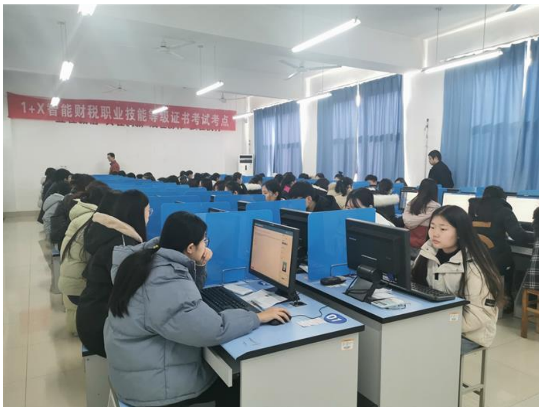
图 3 学生参加“智能财税”职业技能等级证书考试

智能财税赛项是数智化产业最新业态岗位技能需求与学校的课程体系深度融合的典型赛项，是现行全国职业院校技能大赛 102 个赛项中最具代表性的赛项之一。赛项基于智能财税共享服务云平台的大数据、机器学习与 RPA 机器人、电子发票、新一代 ERP 等技术，面向社会财税共享服务机构和企业财税共享服务中心，通过完成业票财税与机器人应用、税务管理与大数据应用、财务管理与大数据应用等工作领域完整的代表性任务考察参赛选手大数据与人工智能等新一代信息技术在财税中的应用能力、在新技术新业态环境下的财税职业判断能力、在企业内控制度约束下的人人协同、人机协同的财税综合业务处理能力。大赛包括团体赛和个人赛，分为业票财税与机器人应用技能竞赛、税务服务与大数据应用技能竞赛和财务管理与大数据应用技能竞赛三个赛段，竞赛总时长 7.5 个小时。赛事设计落实立德树人