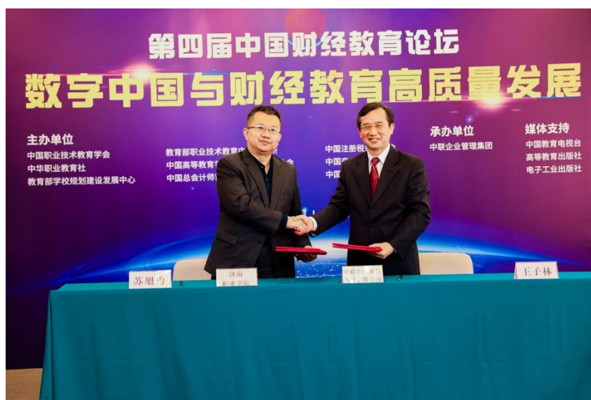
图 2 中联集团科技有限公司与济南职业学院签署校企战略合作协议

2021 年济南职业学院与中联集团教育科技有限公司签署校企共建中联“智慧财经”产教融合项目合作协议，中联智慧财经产教融合基地正式在济南职业学院成立。