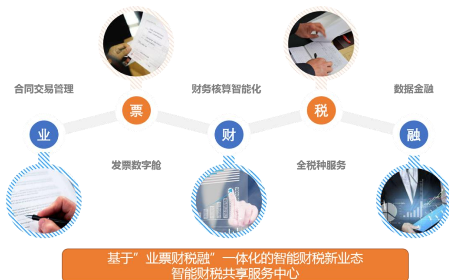
图9 智能财税共享服务中心

建设智慧财经产教融合基地，是实现真正的“产教融合”建设，与财税行业中有引领和示范能力的财税服务产业公司合作，引入财务外包和代理记账真实业务，再现真实工作场景和工作流程，投入财税行业专家，建设以实践教学体系改革为基础，以企业实际业务为内涵，以新兴技术手段为辅助的财税专业复合型财经人才培养模式。