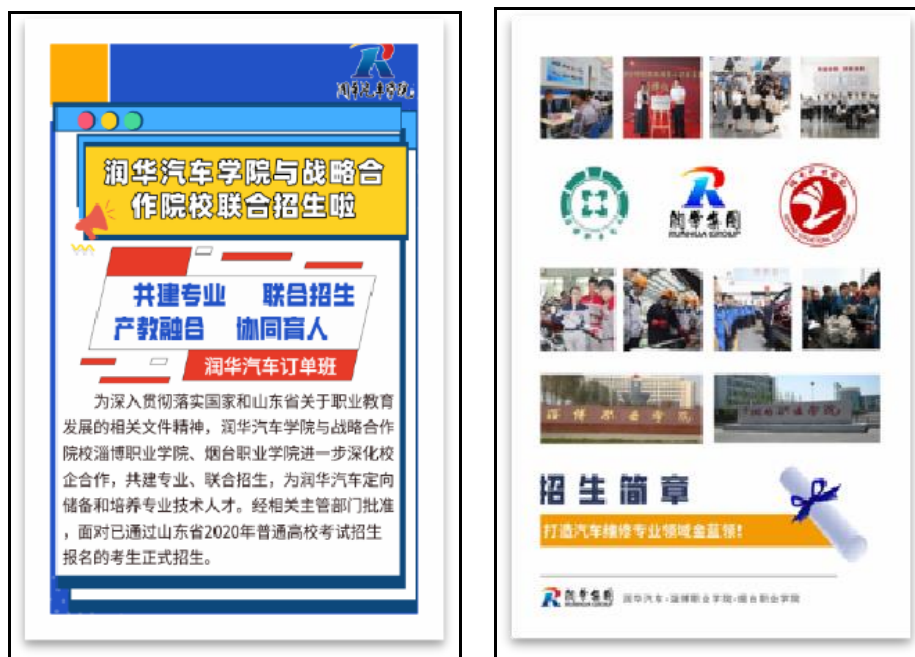
图3 润华汽车与合作院校联合招生宣传页面