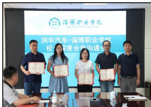
图 6 我院教师被聘为润华指导教师