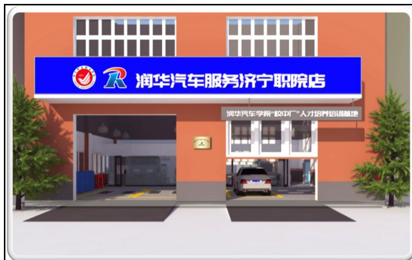
图7 创新合作模式“混合所有制”校中厂暨快修连锁服务店效果图