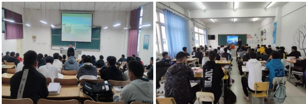
图 4 企业专家、高级技能人才入校实训

为保证人才培养工作的应用及落地，在人才培养的教学实施中，由学校教师与企业技术人员共同承担教学任务，打造学校教师和企业技术人员专兼结合的“双师型”教学团队，以特色的项目教师队伍满足技术技能人才的培养需求。在学校项目组教师教学水平提升方面，项目组教师既作为学校专业课教师，也作为企业专业岗位技师，按照教师及技师岗位的要求系统提升项目组教师的专业能力。润华汽车为项目组教师提供实习平台，项目组教师定期到企业进行顶岗实习，学习行业及企业的新技术、新方法，切实有效提升项目组教师的专业教学水平；在企业兼职教师的选拔方面，润华汽车选拔厂方金牌技师、省市首席技师、省市突出贡献技师、省市杰出技术能手等 10 余位高技能人才，作为项目组技术专家团队，担任学校兼职教师，定期到校开展技术人才培养工作，提高人才培养质量。