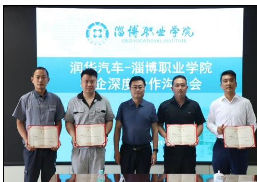
图 5 聘用企业技术专家担任兼职教师