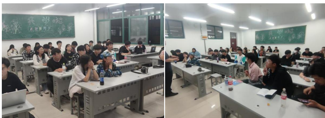
图 2-2 2022 级电子商务 6 班班级照