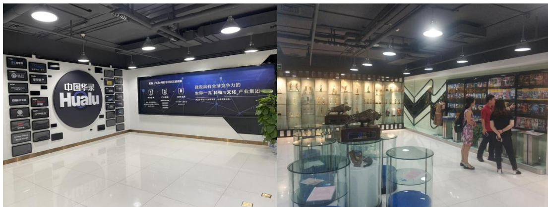
图 1-1 华录实景展示