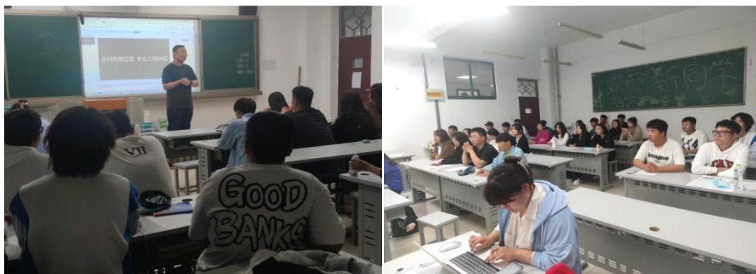
图 2-1 2022 级电子商务 5 班班级照