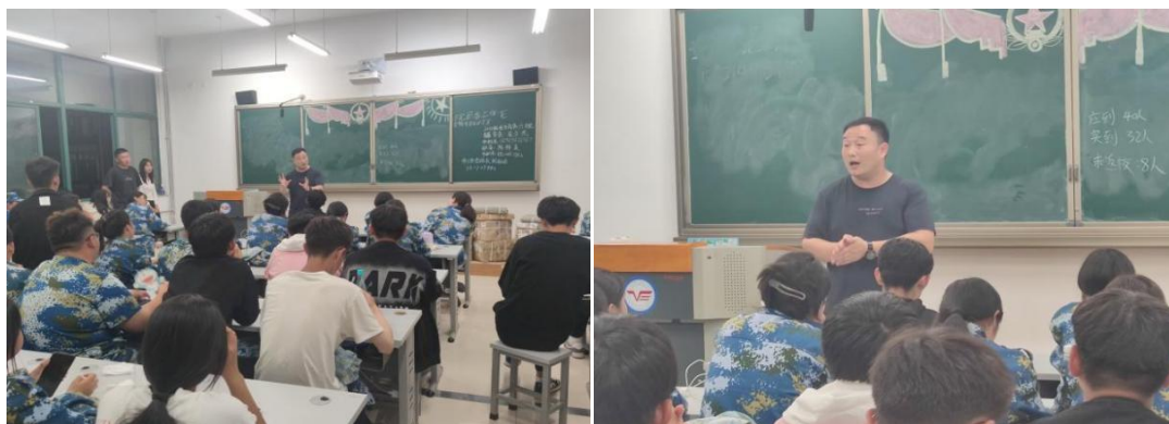
图 2-3 2022 级电子商务 7 班班级照