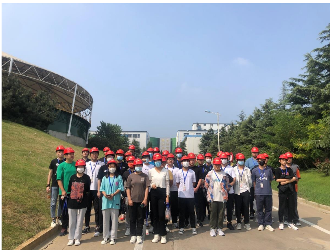
图 3 学生在招金矿业股份有限公司金翅岭金矿实习

作为产业链涵盖矿业链、深加工产业链、科技产业链的集团公司，产业链与学校专业链匹配程度较高，为学校学生实习提供了优质的实习岗位和高水平的技术讲解。2021-2022 学年，集团公司招金矿业股份有限公司金翅岭金矿（图 3）、山东招金科技有限公司、山东招金膜天有限责任公司和招金金合科技有限公司（图 4）等多家单位承担了学校矿物加工技术、机电一体化技术、首饰设计与工艺等 9 个专业的认识实习和跟岗实习教学任务。