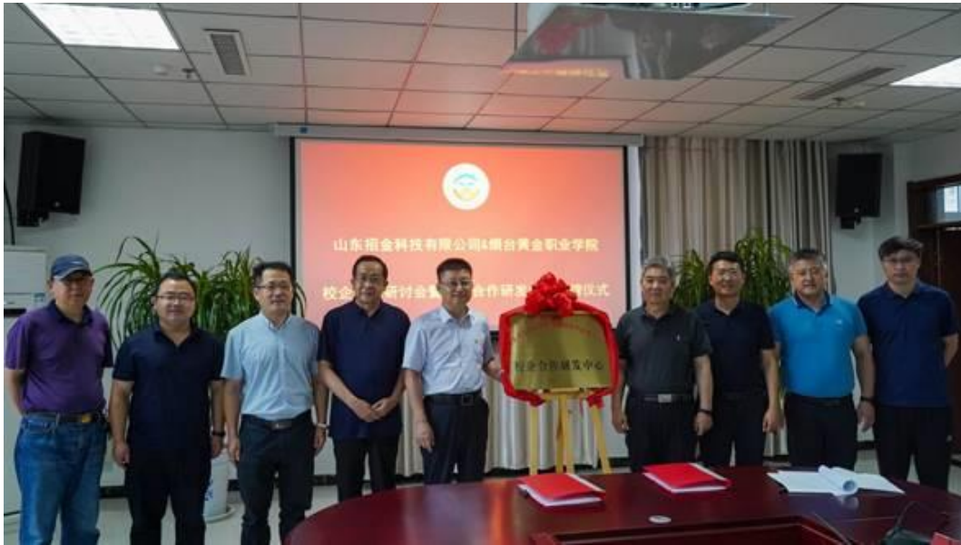
图 1 校企合作研发中心揭牌仪式