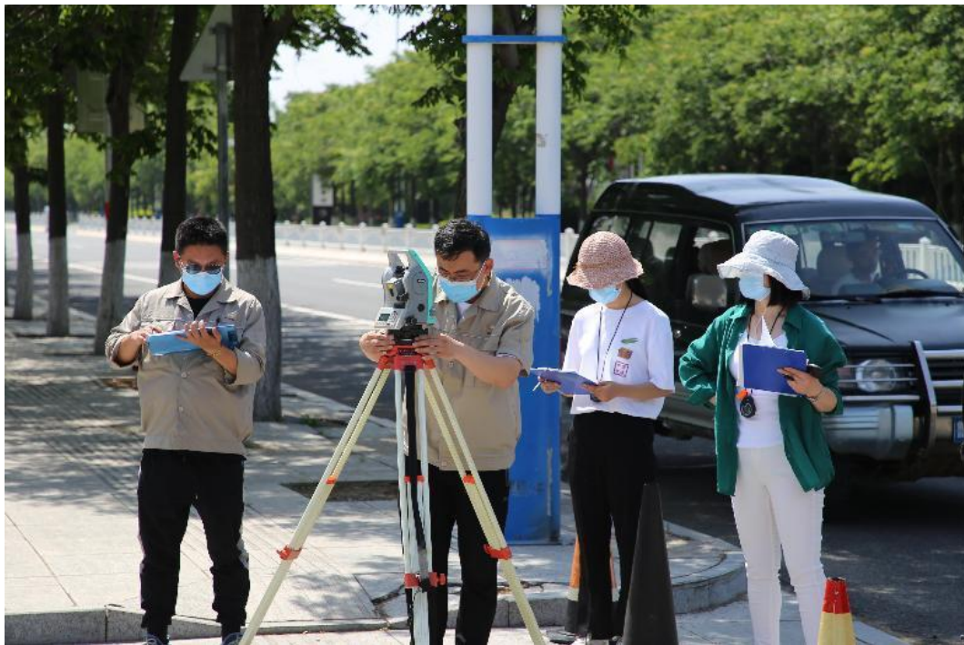
图 6 省冶金工会测量比赛培训