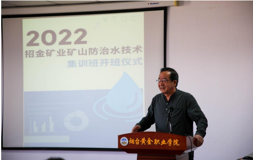
图 5 矿山防治水技术集训班开班仪式