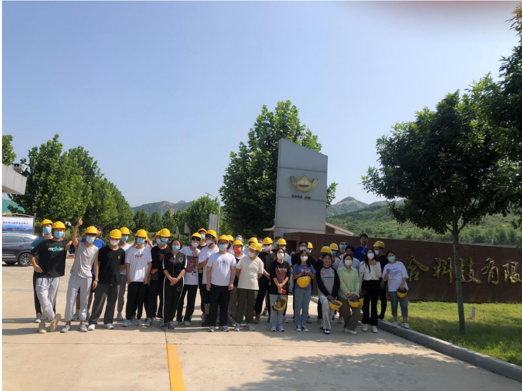
图 4 学生在招金金合科技有限公司实习