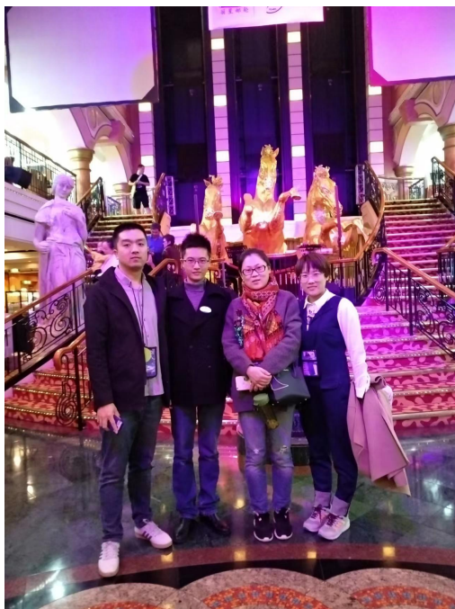
图 7 邮轮专业教师上邮轮学习并慰问实习学生

合作办学的过程中，积极推进教师培养工作、共同申报申报省级校企一体化合作办学项目、鼓励学生积极参加各类型比赛。