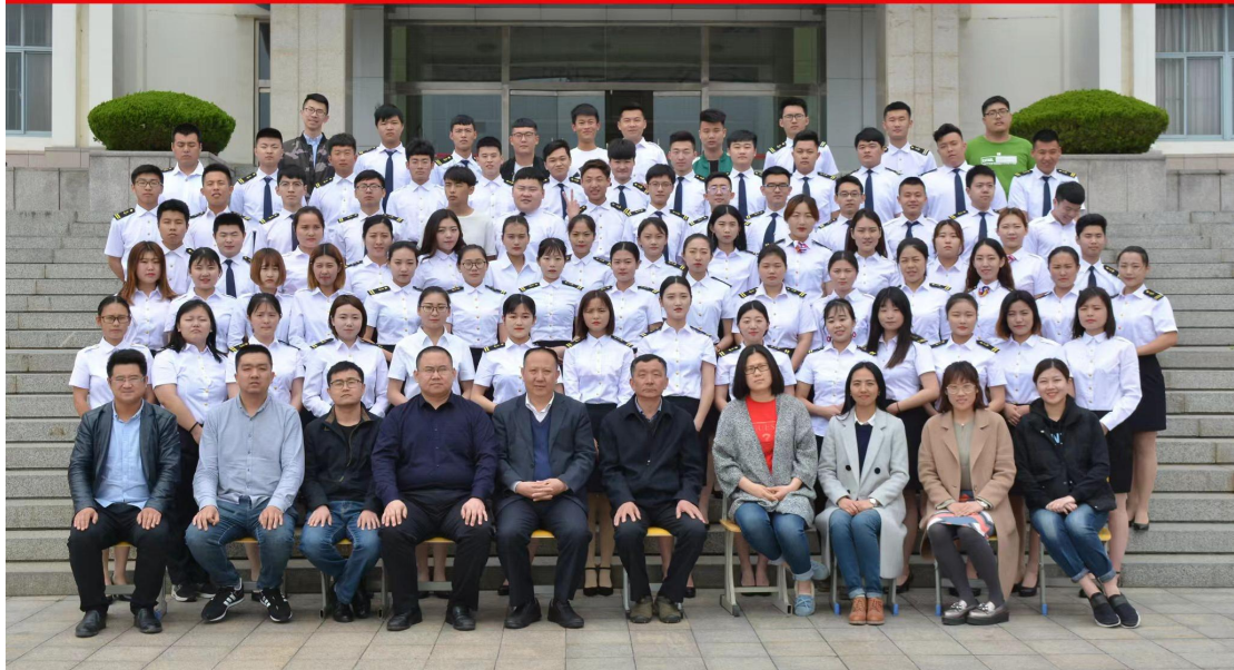
图 1 首届学生合影