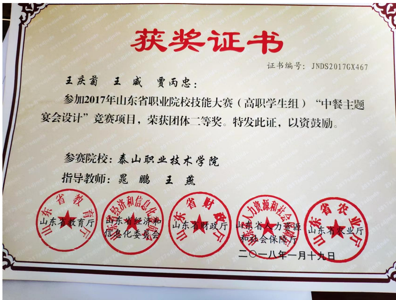
图 11 学生参加省技能大赛获奖