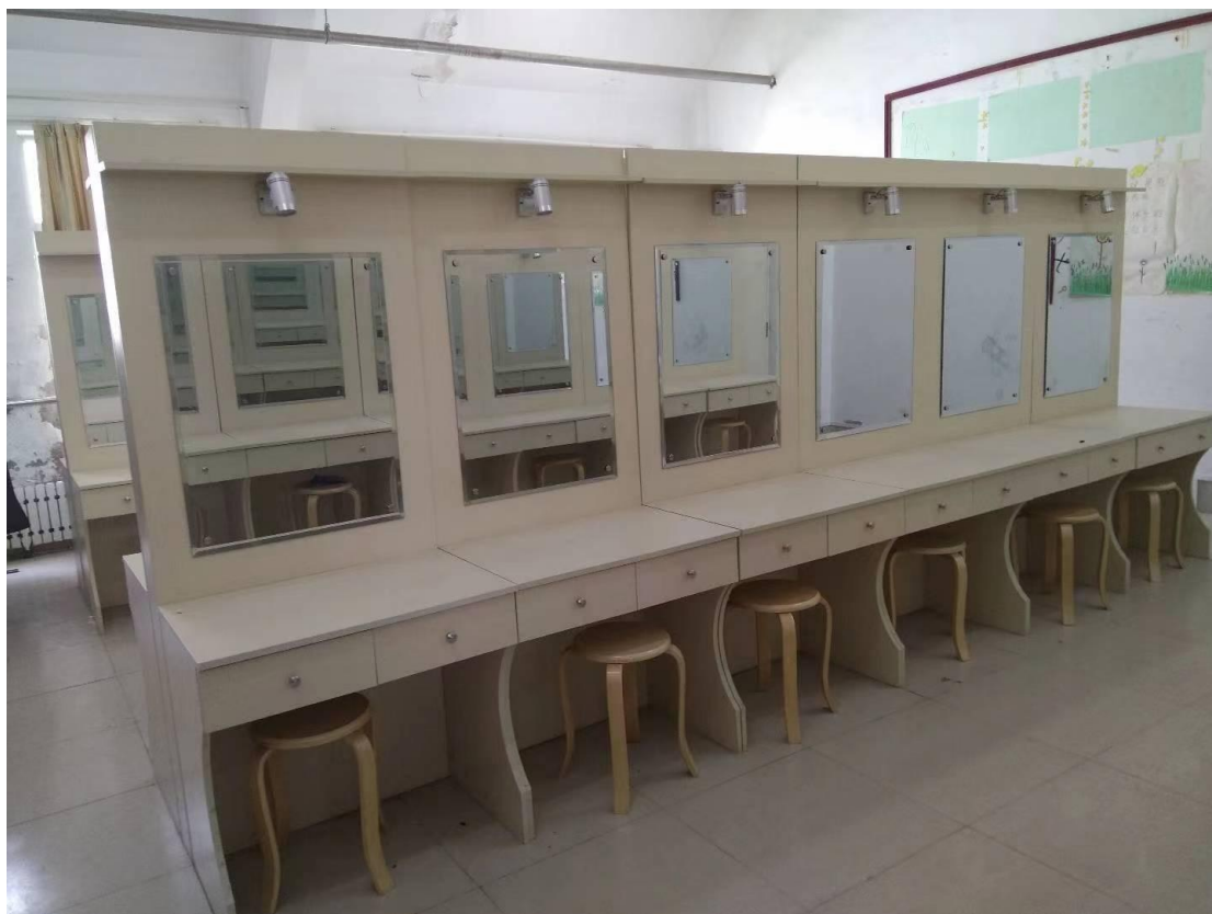
图 2 邮轮实训室