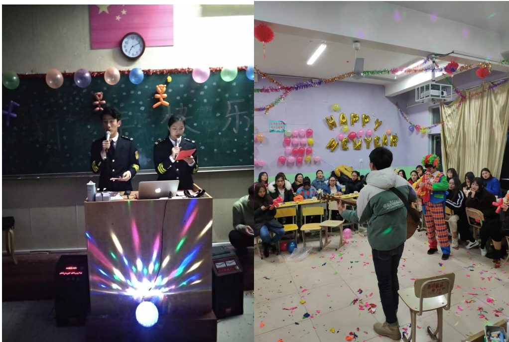
图 6 特色文体活动