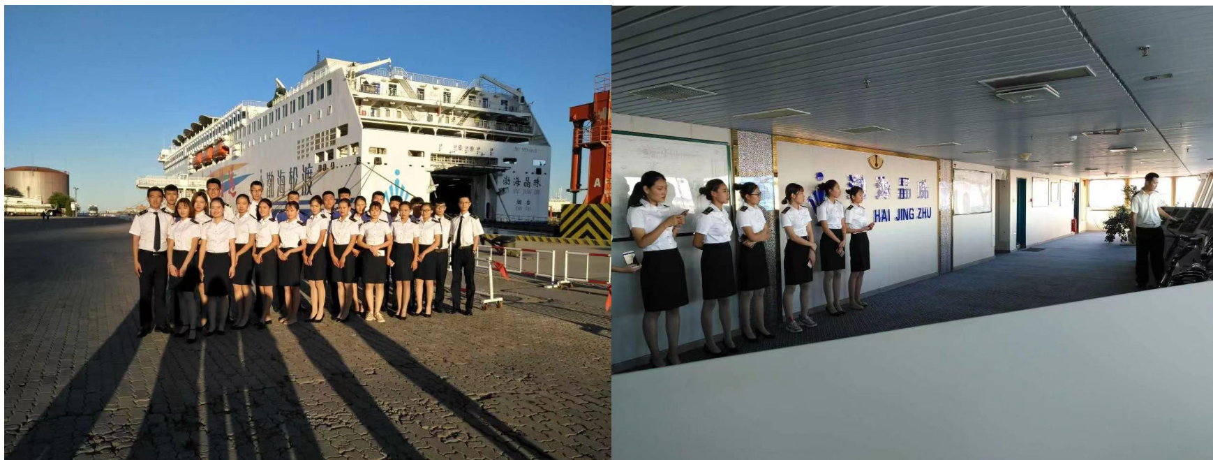
图 10 组织学生去邮轮参观学习