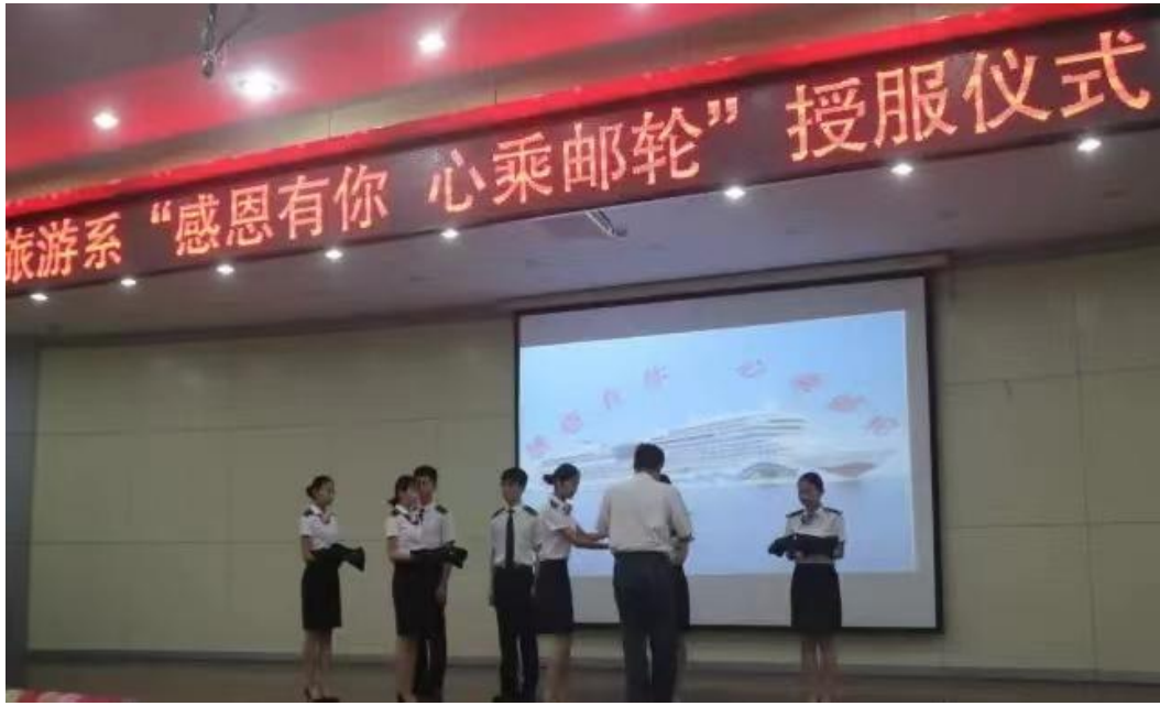
图 5 授服仪式

授服仪式、元旦晚会、航海日已经成为系部文化活动的 一个亮点，通过组织集体活动，丰富学生的课余时间，增加 学生凝聚力、团队意识及归属感。