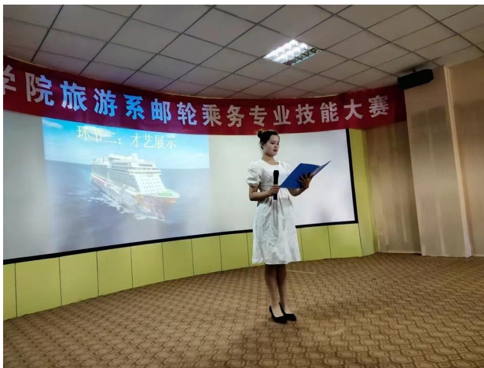
图 8 专业技能大赛