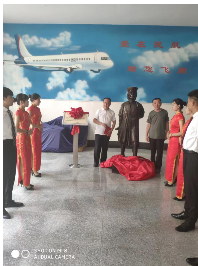
图 9 船员日铜像捐赠仪式