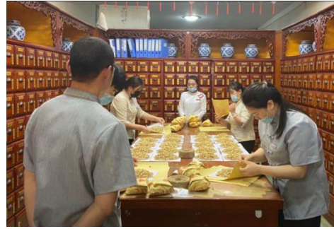
图 8 顶岗实习阶段考核