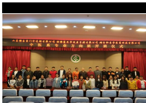
图4 方向班开班仪式

三年来，“博杏霖中医馆学徒班”培养学员约110人，且随着合作的深入，方向班发展也不断壮大，2022年，“博杏霖中医馆学徒班”招收人数达28人次。学生在进入企业实习就业后，工作中具有良好的敬业精神、较高的综合素质、扎实的基础理论、过硬的专业技能，深受企业的好评。