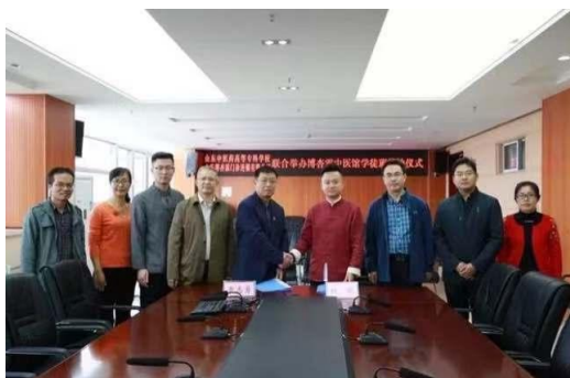
图3 方向班签约仪式