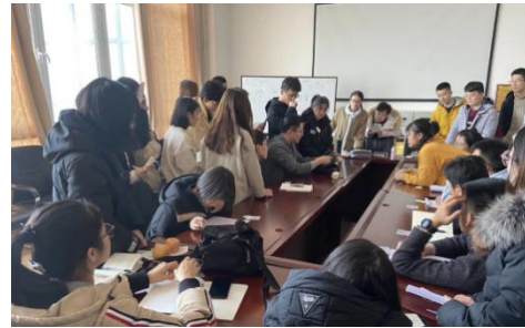
图 6 企业专家技能培训

校企共同建设了校外教师研修锻炼工作培训站、“双师型”教师培养培训基地和教师企业实践基地，开展教师企业实践锻炼，为相关专业教师提供职业能力提升和技术深造的培训。