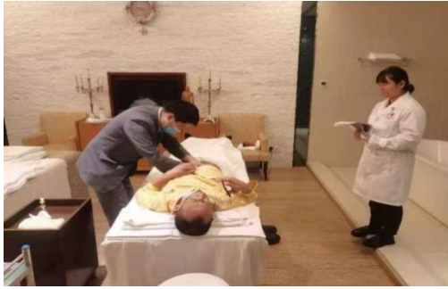
图 7 顶岗实习技能训练