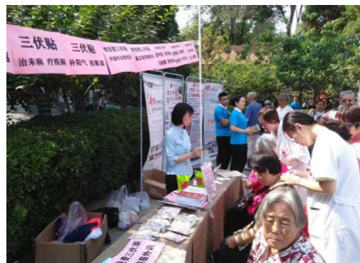
图10 社会服务—三伏贴

围绕健康服务业现实需求与发展趋势，引入现代企业管理制度，融入职业资格标准和行业企业标准，校企共同开发课程、修订完善课程标准、开发校企合作教材，实践课程教材内容与职业标准、教学过程与生产过程的深度对接。基于真实的工作过程与岗位需要，对专业核心课和职业方向课进行了项目化设计；挖掘一线工作中的思政元素与案例，充实完善了课程思政建设，夯实学生职业技能的同时，培育其职业精神，提高综合素养，实现立德树人、精技善能的人才培养目标，适应健康服务业对技术技能人才的新要求。