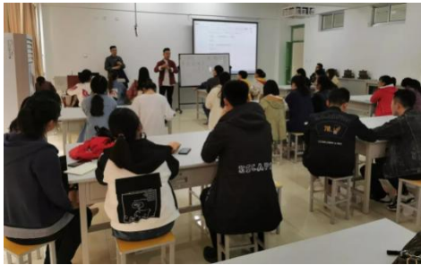
图 5 企业专家理论授课

校企联合办学采用“校企共育、双链对接、分段培养”的“双主体”人才培养模式，山东博杏霖中医门诊连锁有限公司选派优质的行业企业专家和“能工巧匠”担任兼职教师，参与人才培养方案制定和专业课程建设，定期开展专家讲座，承担部分专业课程的讲授、校内实训指导、校外顶岗实习指导等工作。