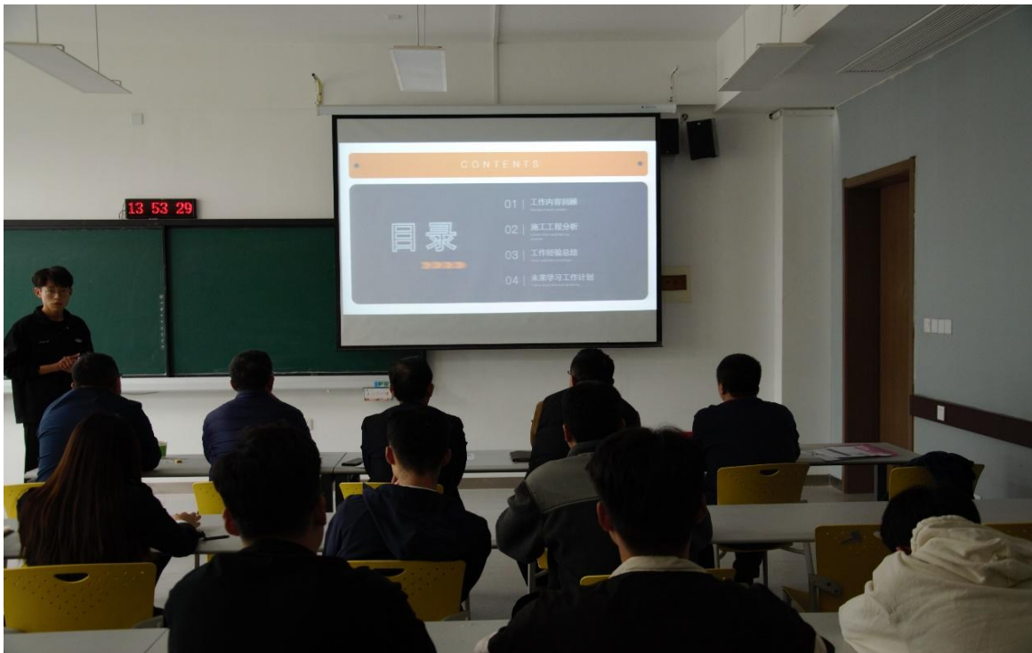
图4 教学团队考评学生