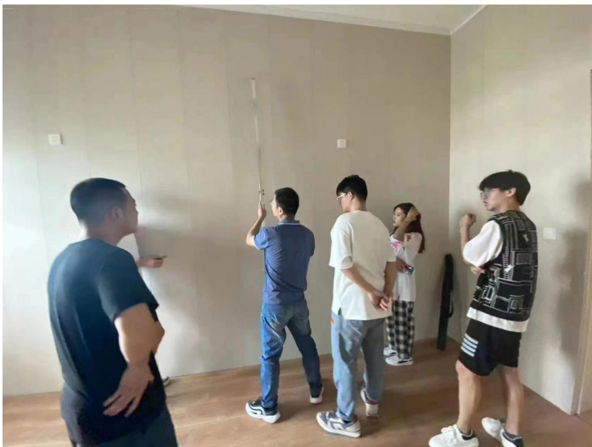
图6 顶岗实习“一生一导师”

校企双方根据海逸恒安项目管理有限公司工程项目建设进程，结合教学规律，利用假期时间，接收山东职业学院学生到公司进行顶岗实习，制定针对工程项目的实习方案，建立“一生一导师”师带徒制度，为学生建立实习档案，购买意外伤害保险，按国家要求支付顶岗实习的实习工资，实习结束后组织企业工程师团队对学生进行考核评价，考核优秀学生优先推荐就业。