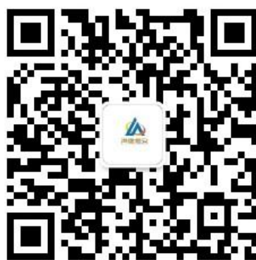
图 1 海逸恒安微信公账号