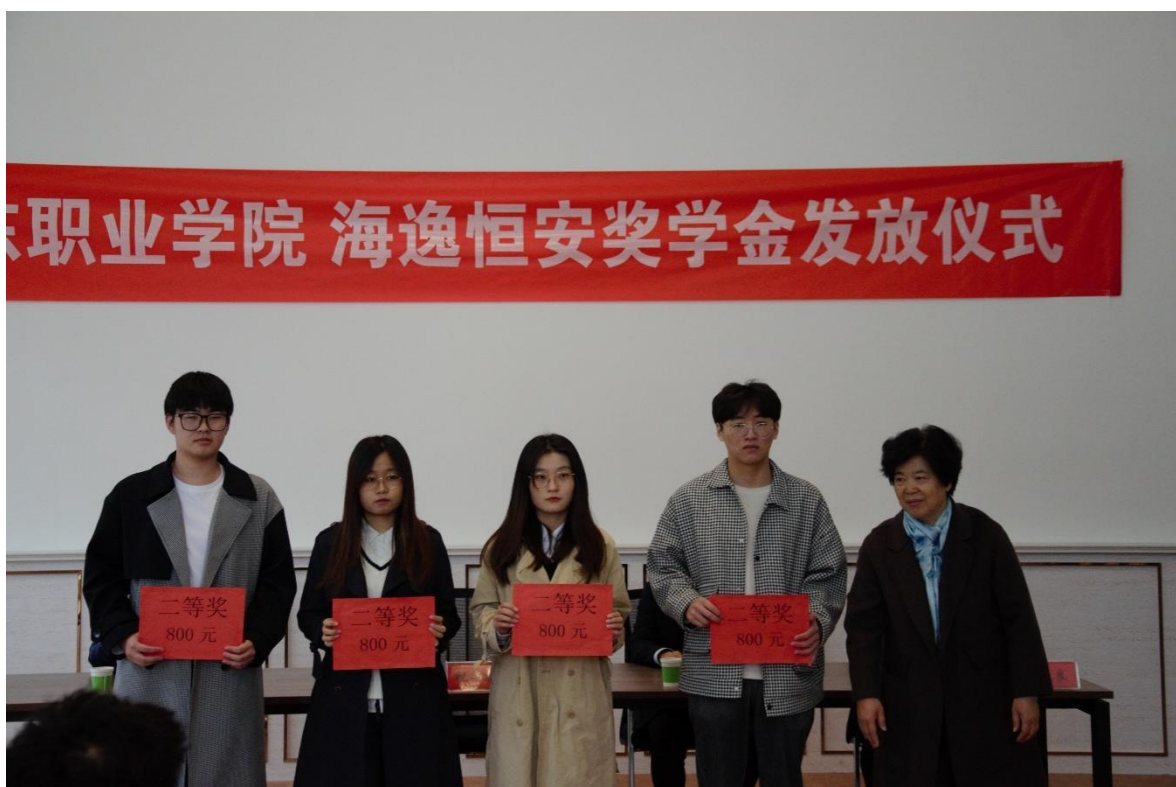
图 5 颁发“海逸恒安”奖学金