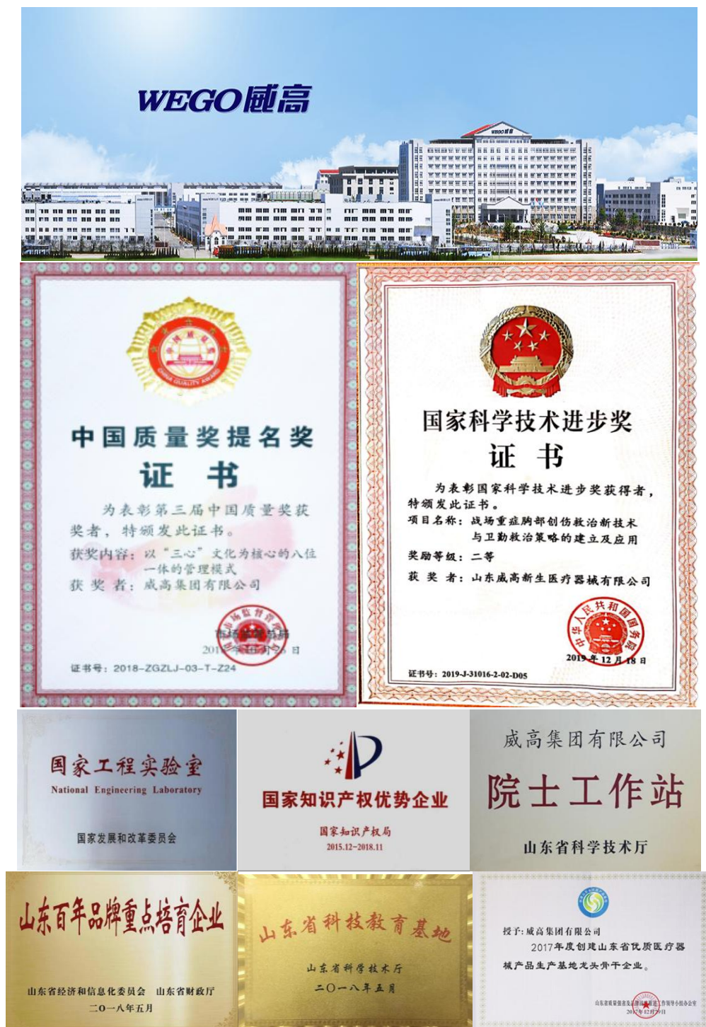
图 1 威高集团各项荣誉证书