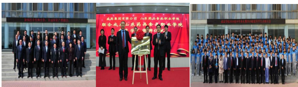
图3 深化校企合作，打造威高学院

和就业等。2014年12月学院医疗器械系成立以后，校企双方合作更全面更深入更紧密，威高集团捐赠价值总值238万元的仪器设备共建医疗器械实训室，积极参与学院专业建设、师资队伍建设、课程开发、人才培养等教育教学工作。2019年3月在校企双方合作的基础上，依托学院的办学优势与威高集团的企业优势，整合双方的特点及发展需求，共同打造具有混合所有制特征的二级学院—威高学院，开设医疗设备应用技术（血透工程师方向）、精密医疗器械技术（智能制造方向）两个专业，2020年新增护理专业（血液透析方向）。现开设智能医疗装备技术专业和医用电子仪器应用技术专业，截止到目前，在校生有288名，威高学院培养出一届82名毕业生，部分学生业已成为骨干。