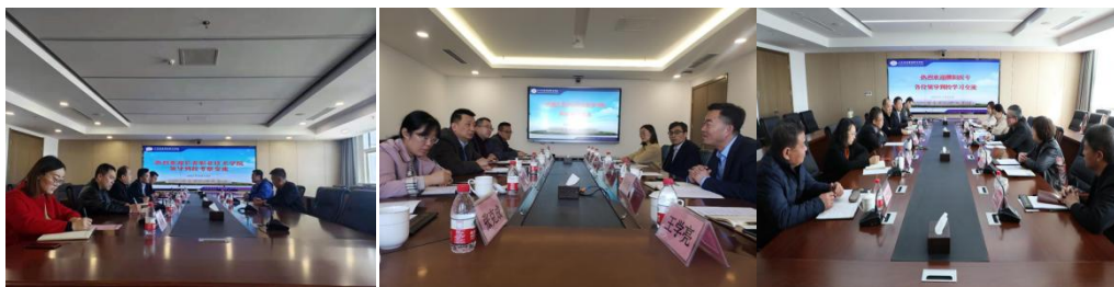
图 16 学经验吸引多所院校

威高学院合作办学经验吸引中国医学装备协会血液净化装备技术专业委员会专家来学院考察和交流，该专委会对血透临床工程师培养工作举足轻重，初步达成更深入合作意向。同时也吸引江苏食品药品职业技术学院、长春职业技术学院、濮阳医学高等专科学校、威海海洋职业学院等众多兄弟院校参观考察、交流合作，在行业企业和兄弟院校中产生良好的引领示范作用。