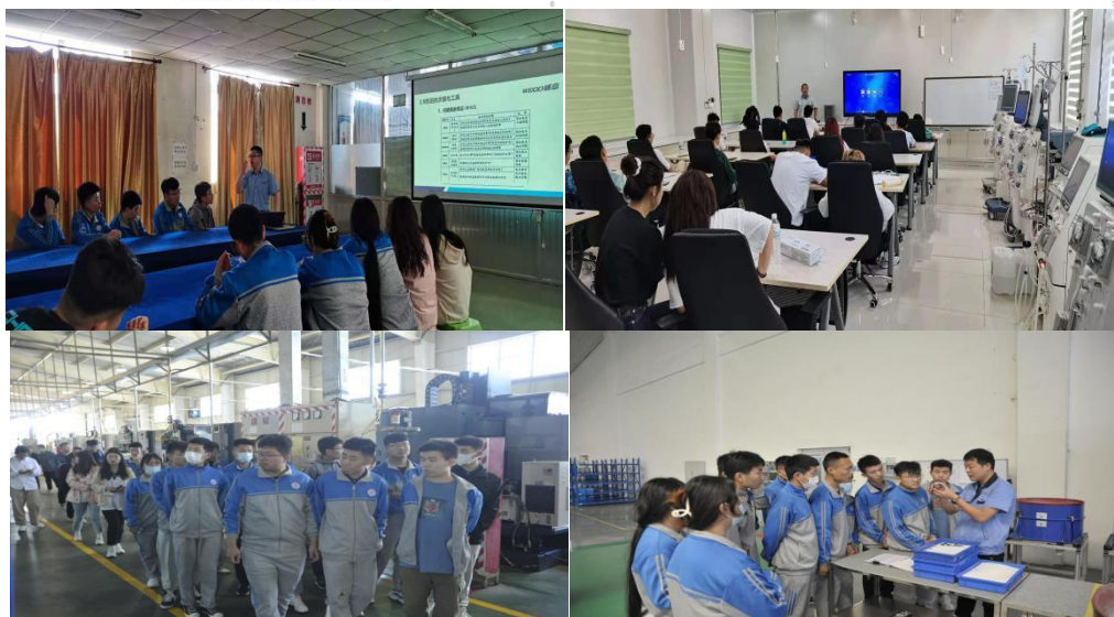
图 13 构建理实结合、知行统一的课程体系

董斌，本科，工程师 发表国家级论文13篇（均为第一作者）； 山东省医院协会肾脏病与血液净化专业委员会技师学组委员； 中国非公立医疗机构协会临床工程分会第一届委员会委员； 中国非公立医疗机构协会肾脏病透析专业委员会透析工程技术学组委员； 威高集团医疗教学（学术）教研室内部讲师； 山东药品食品职业学院兼职教师（技术专业）； 参编教材1部； 威高大学讲师； 2019第五届肾脏病透析创新发展高峰论坛血液透析临床工程技术技能竞赛最佳个人优秀表现奖； 山东威高医疗控股有限公司执业8年。