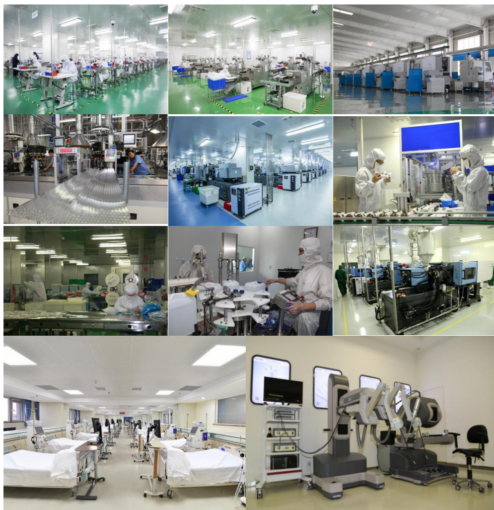
图 6 威高集团生产线