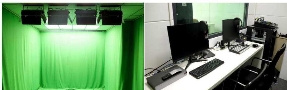
图 9 威高集团整合教育