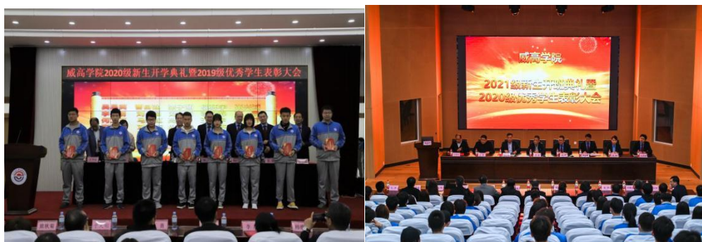
图 7 威高学院设立“威高奖助学金”