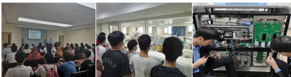
图 12 “1+6 融合” 创新型人才培养模式