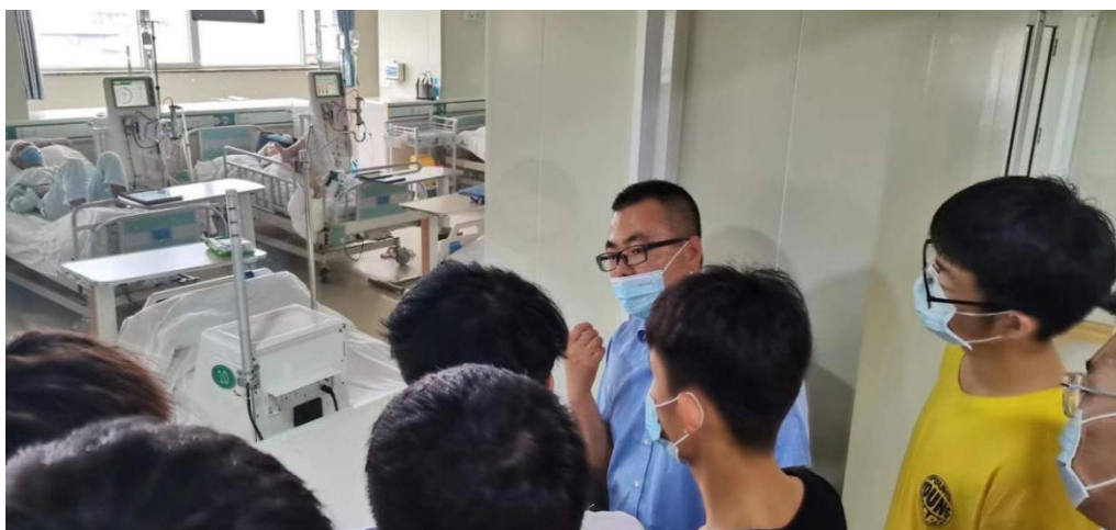
图 15 血液透析临床工程技术技能竞赛团队一等奖