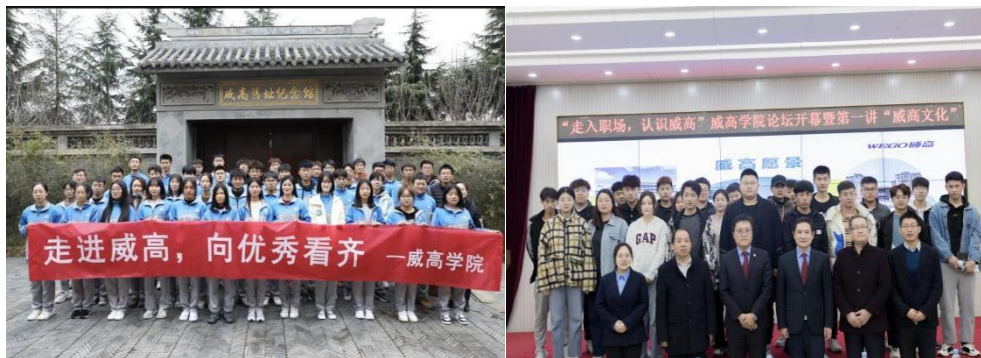
图4 威高学院师生大合照