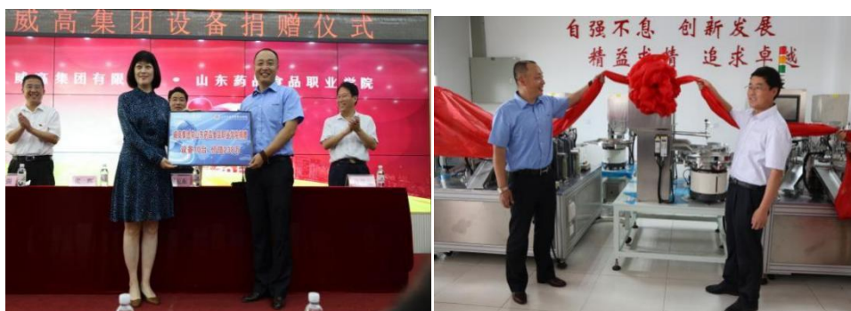
图 5 威高集团捐赠医疗器械设备

威高集团捐赠医疗器械设备总计 10 台（套），包括威高集团自主研发的成品输液针组装机、新设备输液塞铝盖自动组合机、加药塞铝盖自动组合机及内窥镜检验工装等设备，总价值 238 万元。设备到校安装就位后，安排专业人员到校开展产品生产、设备操作、维护保养等相关知识的培训，与学院共建医疗器械实训室，促进学院实践教学条件的提升。