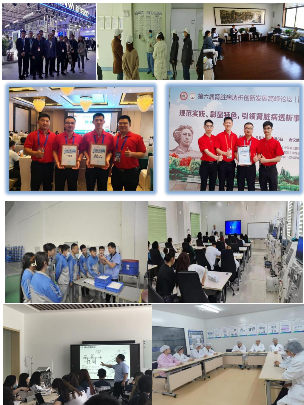
图 14 企业教师竞赛团队连续获奖