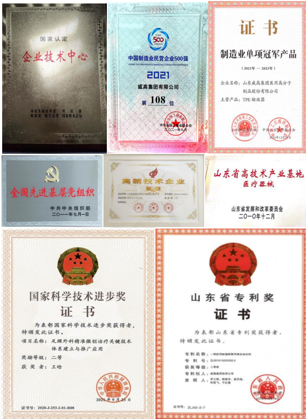
图 2 威高集团打造国际化品牌

合作山东药品食品职业学院自 2005 年在威海市建校伊始就与威高集团建立校企合作关系，选派企业管理人员和业务骨干进校开展专题讲座，接纳教师、学生参观学习，接收学生顶岗实习