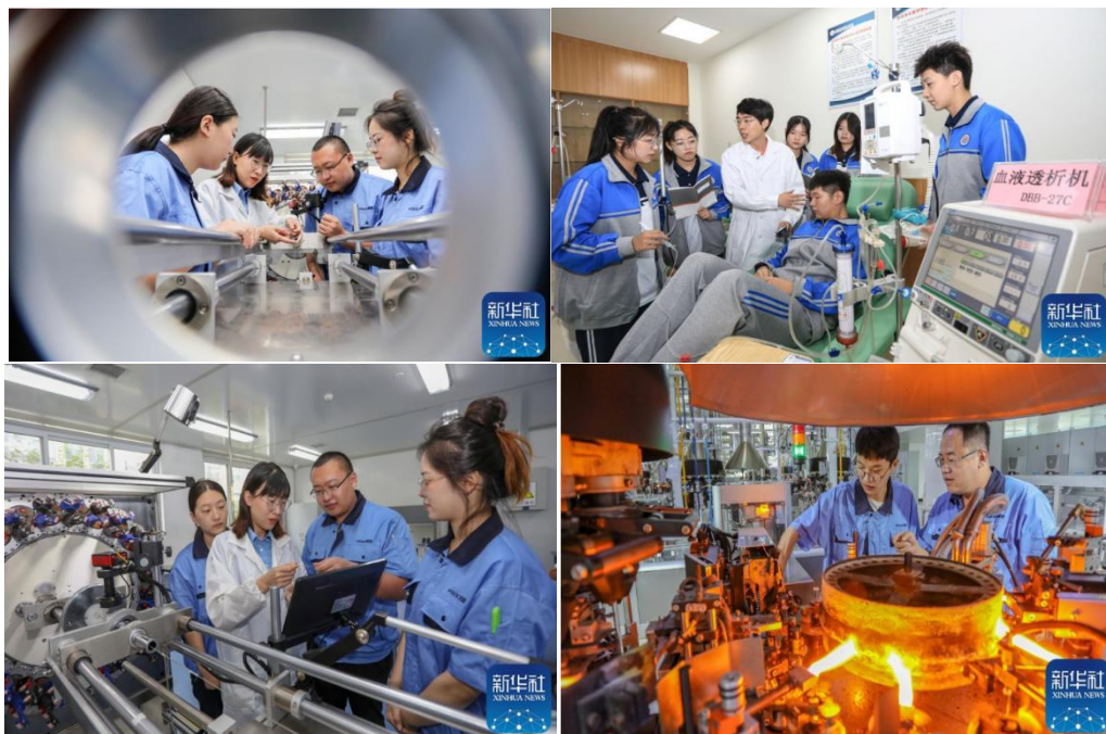
图 17 威高学院学生岗位训练

继2022年7月22日威海日报以“威高学院走出首批毕业生”为题报道学院与威高集团合作共建的二级学院—威高学院人才培养成果以来，威海市人民政府网站、威海晚报等新闻媒体纷纷转载。威高学院以素质教育为根本，以能力培养为主线，以岗位训练为重点，以职业资格证书为引导，实现“就业主导，项目带动”的人才培养模式引起新华社记者的高度关注，并于7月25日在光明网以“威海：“订单”教育 对接供需促就业”为题进行转发。2022年9月15日新华社记者又亲赴学院教学现场和威高集团生产车间进行专访，以威高学院产教融合、校企合作为背景，聚焦区域人才供给和毕业生就业，于9月16日在新华网以“山东威海：“订单”式育才 对接供需促就业”为题发表专访报道。