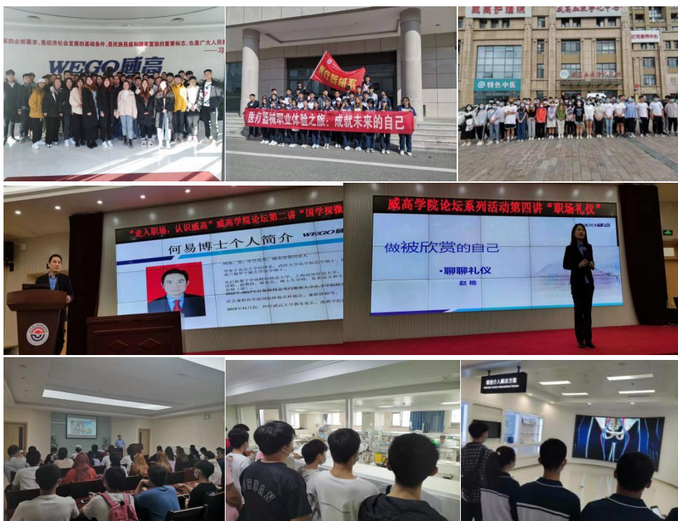
图 10 构建特色教育模式

作为专业带头人，与学校一名老师共同组成双带头人，发挥各自优势，共同负责专业建设、规化和发展。引入血液透析临床工程师职业标准，重新修订课程标准；将威高文化引进校园、引进教材、引进课堂；共建生产性实训基地，引进企业具有丰富实践经验的教师共同培养学生，学中做、做中学、边学边做、教学做一体化。