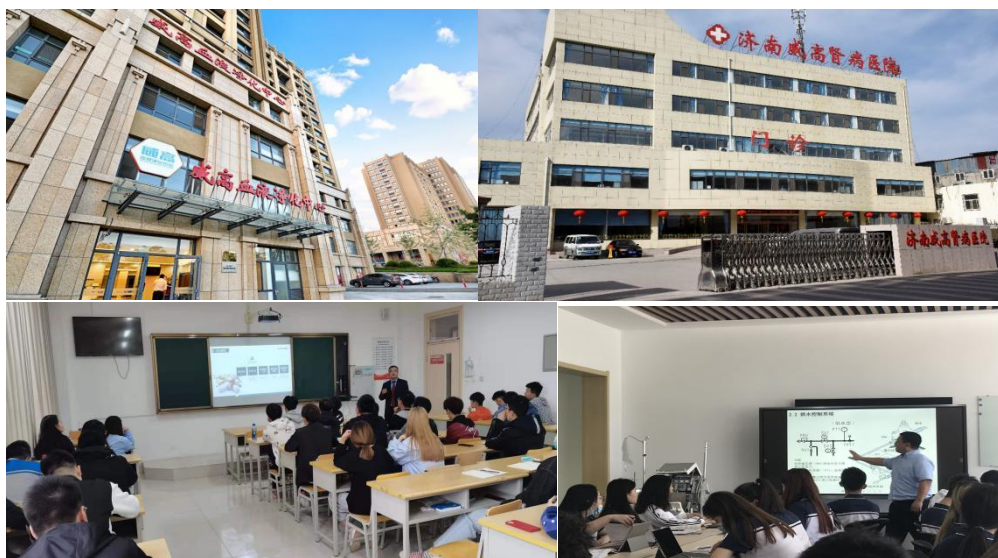
图 11 学生参与威高培训

学生入学后，到威高集团参观学习，增加职业认知，更好的了解威高集团、威高文化和专业人才培养方向。同时也将企业文化引入校园，开展“走入职场、认识威高”威高学院论坛系列活动和进入职场前的入职培训，为学生更好地开启实习生活和融入威高集团做好思想准备。