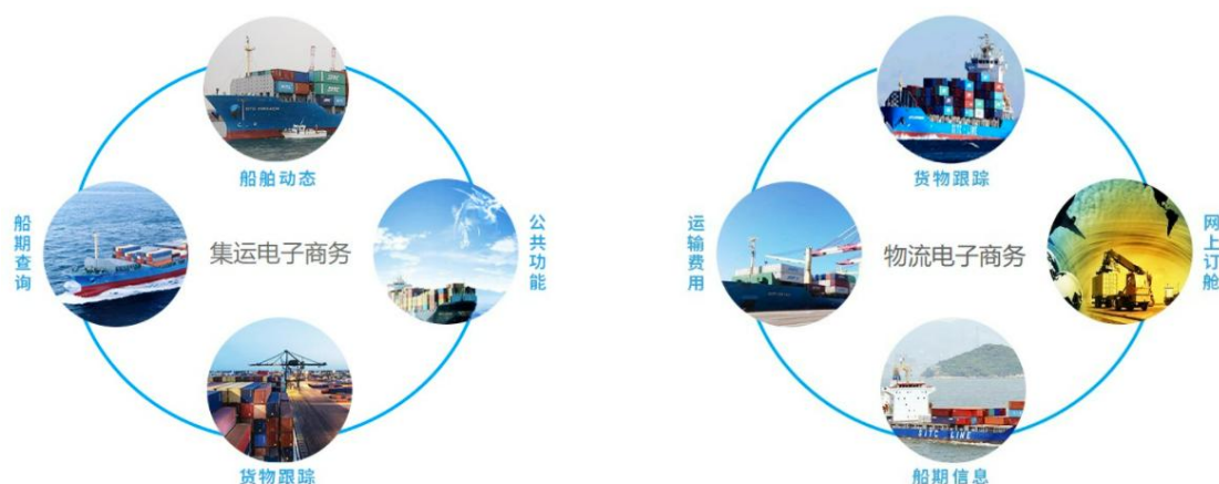
图 1 海丰国际的业务基本情况

目前，海丰国际在中国青岛、上海、宁波、天津、大连、厦门，越南海防、胡志明，泰国曼谷、林查班，印尼雅加达、泗水、三宝壟，马来西亚，南非约翰内斯堡、开普敦已建成经营堆场、仓储业务的物流园。同时，分别与丹马士物流、胜狮、青岛啤酒、海信等世界物流及著名生产企业保持着长期的合资合作关系。