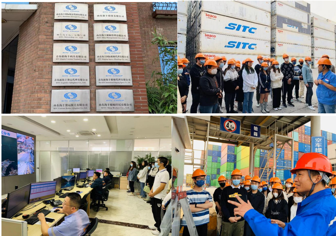
图 8 学生观摩实习

海丰国际作为学院实习实训基地，资深业务人员作为指导教师，接收学生进行观摩实习和顶岗实习。