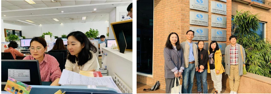
图 7 教师在海丰国际实习

公司接收山东外贸职业学院专业老师进行物流货运、堆场业务、仓库业务、智慧物流等岗位的实践进修。