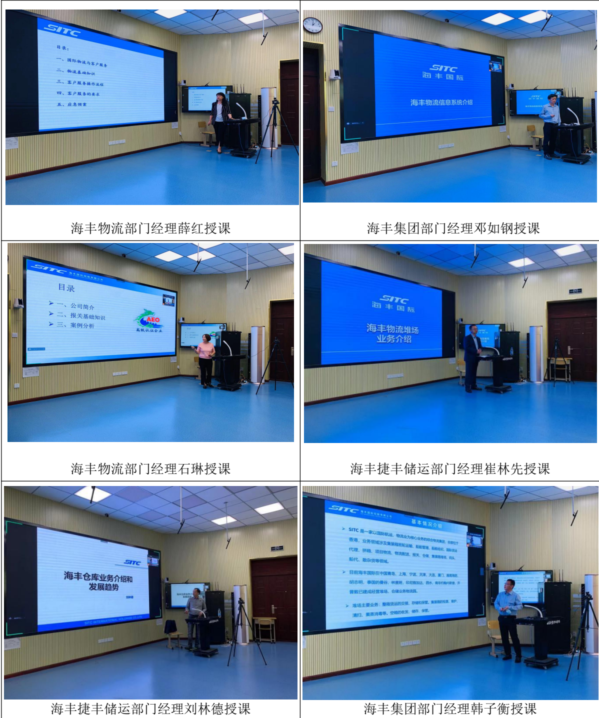
图 6 企业专家授课图

海丰国际先后派遣物流、报关、场站、仓储部门等 6 名资深业务经理到山东外贸职业学院担任兼职教师，承担授课、指导实训等任务，累计培训、指导学生 300 余人。