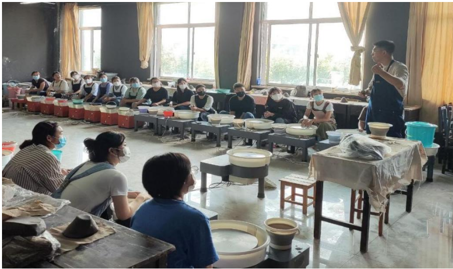
图3 公司高级拉坯技师赴学校授课场景

生在校学习期间便能够直接接触企业专业工作为毕业后进入社会工作打下良好基础，学习到陶瓷工艺行业中的新知识、新技能、新设备、新工艺。拓宽学生就业领域，使学生从事的工作由传统行业和岗位延伸至陶瓷陈设、陶瓷文创产品设计等相关专业领域。