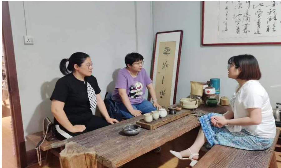
图5 工艺美术专业教师赴企业沟通课程建设方案