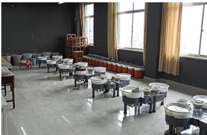
图1 公司生产大功率拉坯机在工艺美术专业坯技艺工作室中投入使用

2022年6月公司与学校签订了生产性实训基地建设协议，基地建设包括校内陶艺拉坯工作室、陶艺雕塑工作室、陶瓷烧制车间等实训工作室建设，工位60个；校外建立以淄博桢寅堂陶瓷文化教育基地为基础的校企合作实习实训基地，具有工位60个，可满足该校工艺美术专业学生专业实践需求。充足设备引进以及实训基地建设为学生在陶瓷工艺专业实训、实习就业等方面提供更广泛的学习空间。为推动校企深入合作、教学资源共享提供有利条件。