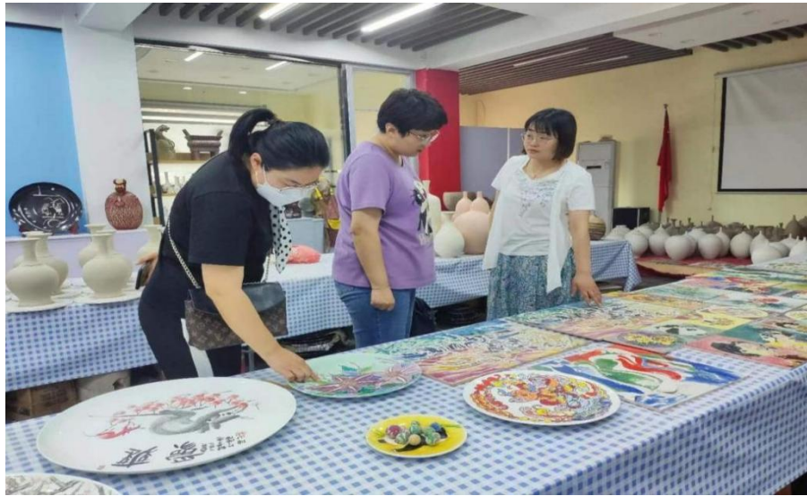
图4 工艺美术专业教师赴公司考察交流

在专业建设方面公司积极参与制定山东外国语职业技术大学工艺美术专业人才培养方案，专业的人才培养方案是保证工艺美术专业教学质量和实施人才培养工作的根本性指导文件，是安排教学任务、组织教学、编写和选择教材、实施教学管理的依据，也是对人才培养质量进行监控和评价的基础性文件，同时反映了学校在人才培养上的指导思想和整体思路及培养方向的定位，学校每年都组织专业负责人、骨干教师到公司进行专业调研，听取公司高级技师对人才培养的建议，了解行业企业发展的新动态，掌握新设备的使用情况，以及新技术技能岗位要求的能力要求，以实现人才培养方案要求与企业岗位技能要求对接，与职业技术标准对接。