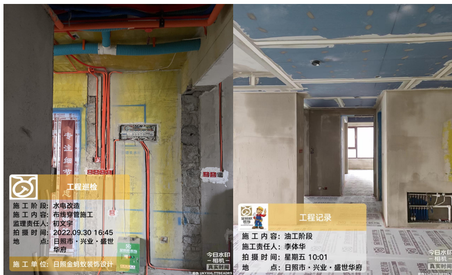
图 5 在施工现场

2. 公司为该校实习生提供 200 多个家装在工地供学生“实战演练”，对接实战项目，并提供实习津贴。实习训练期间完成相应相关项目并通过考核后，实施奖励机制。