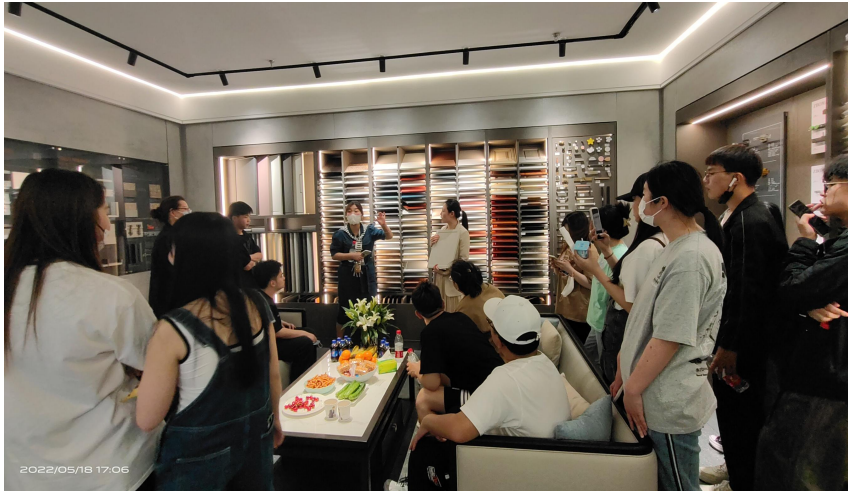
图8 学生走进企业调研学习（2）