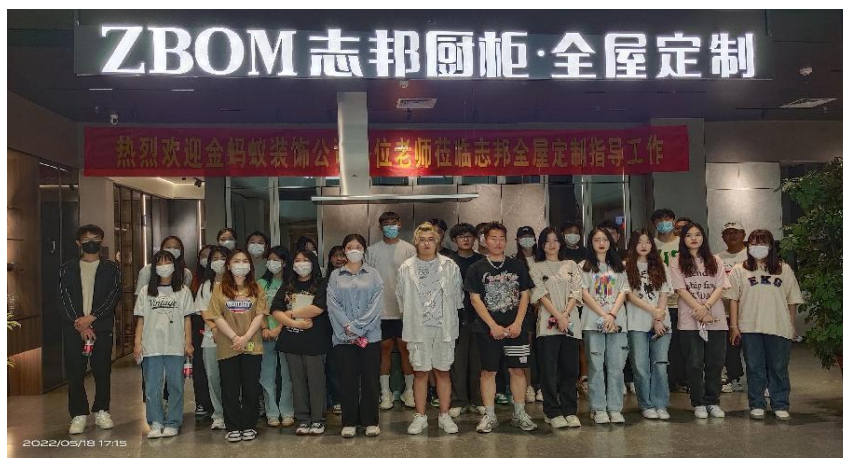
图7 学生走进企业调研学习 (1)

公司除了参与该校的教学改革之外，还积极为学科专业的建设和发展提供力所能及的帮助。2022年，为帮助该校2020级环境艺术专业《软装与陈设设计》课程开展产教融合工作，公司联合该校专任教师鲁晓燕，共享金蚂蚁主材合作品牌资源，带领学生走进企业调研学习，有效提高了课程效率和学生的实践能力。