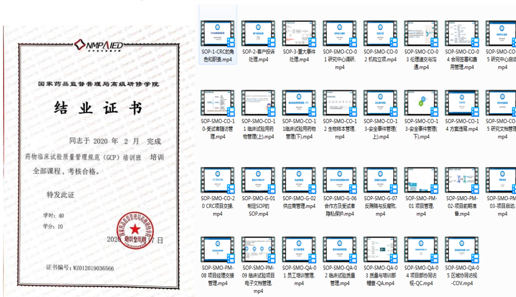
图 2：企业开发课程讲义和教学视频

3. 为科研护理(方向)学生提供具有自主研发知识产权的教学课件、微视频、项目案例，为实习生提供 GCP 相关认证。