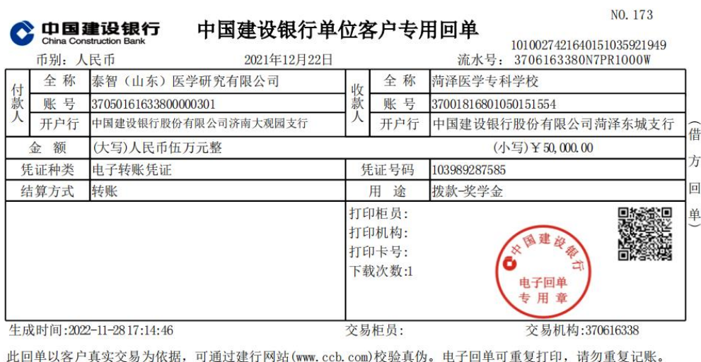
图 3：奖学金转账凭证