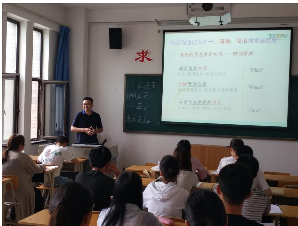
图 1: 企业讲师进行职业素养讲座