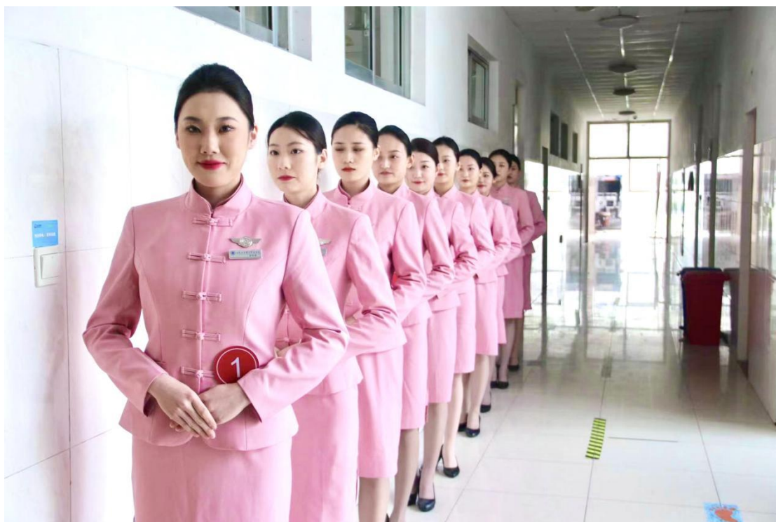
图9 国赛选手候场精神面貌