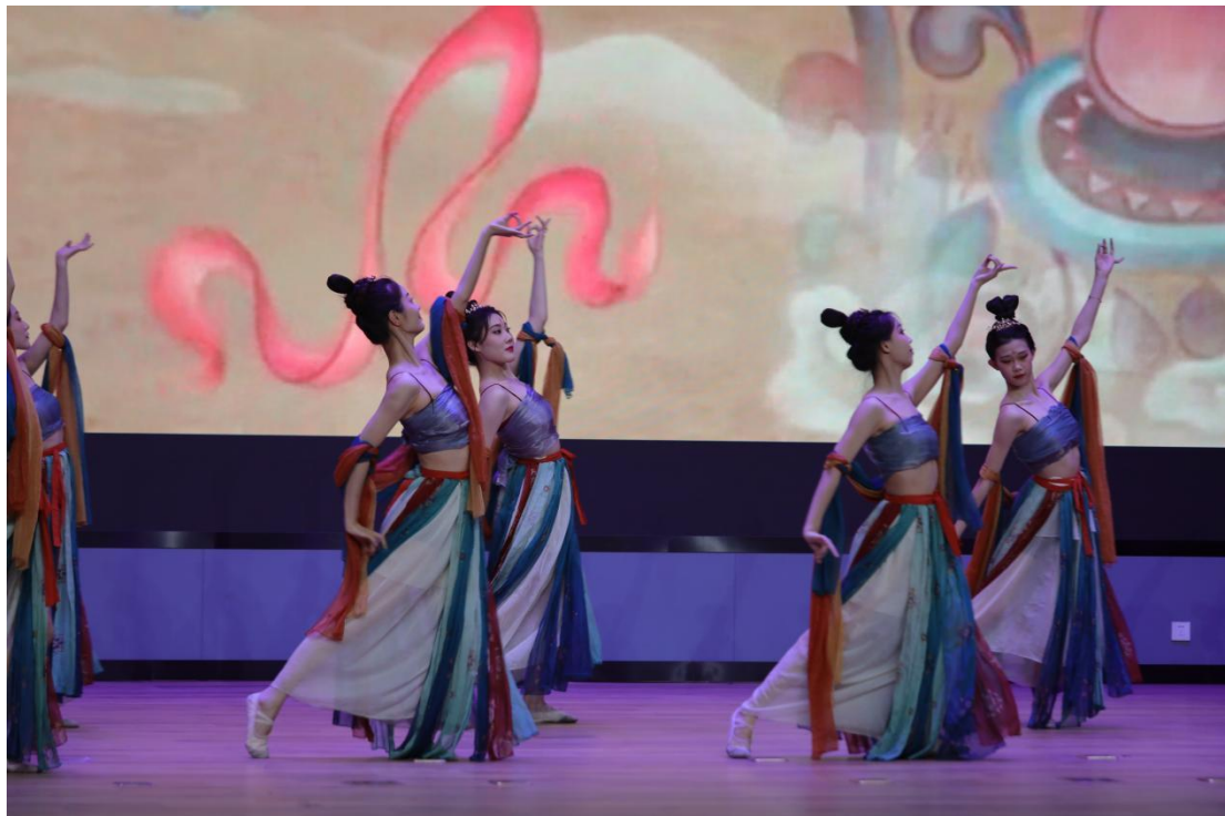
图19 “圣辅杯”航空专业技能大赛优秀节目展示