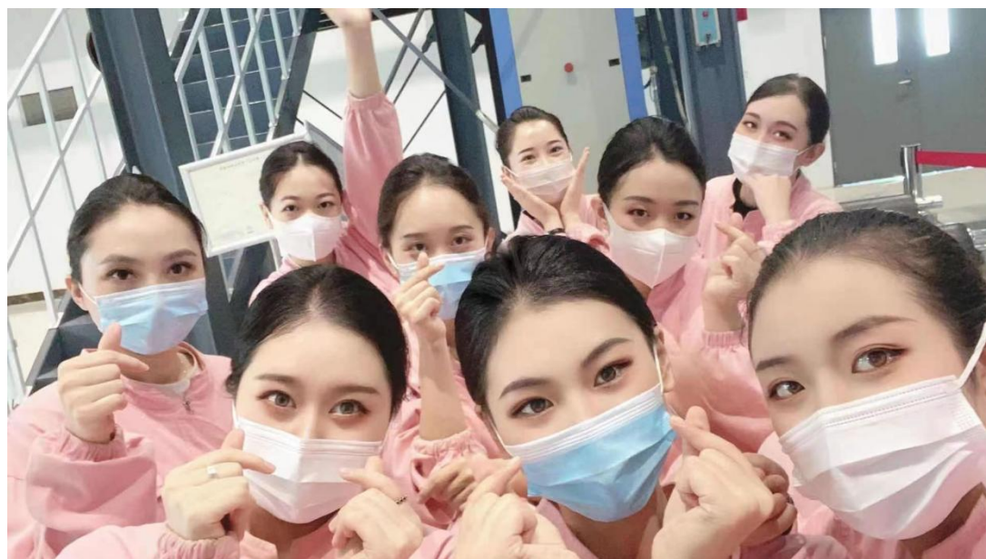
图23 航空公司岗前培训合影

学生的实习就业岗位主要是国内外各大航空公司空中乘务员及安全员、高铁乘务以及机场相关的地面服务工作，如安检、值机、VIP服务、票务等。可通过专升本考试提高学历层次，毕业后可参加公务员招录、事业单位招聘等考试。