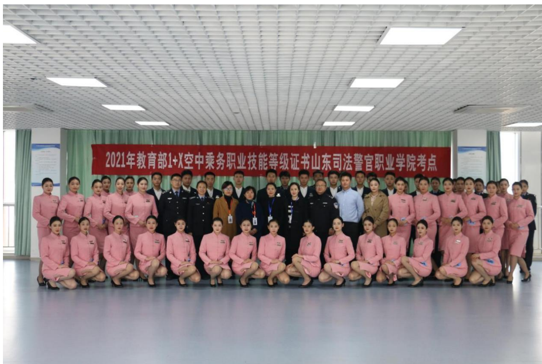
图21 1+X证书考评员与考生合影