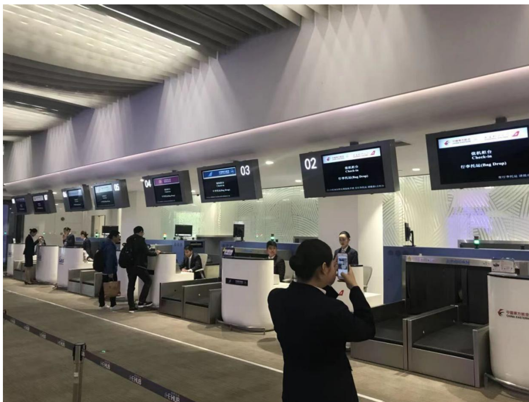
图24 中国东方航空公司值机柜台