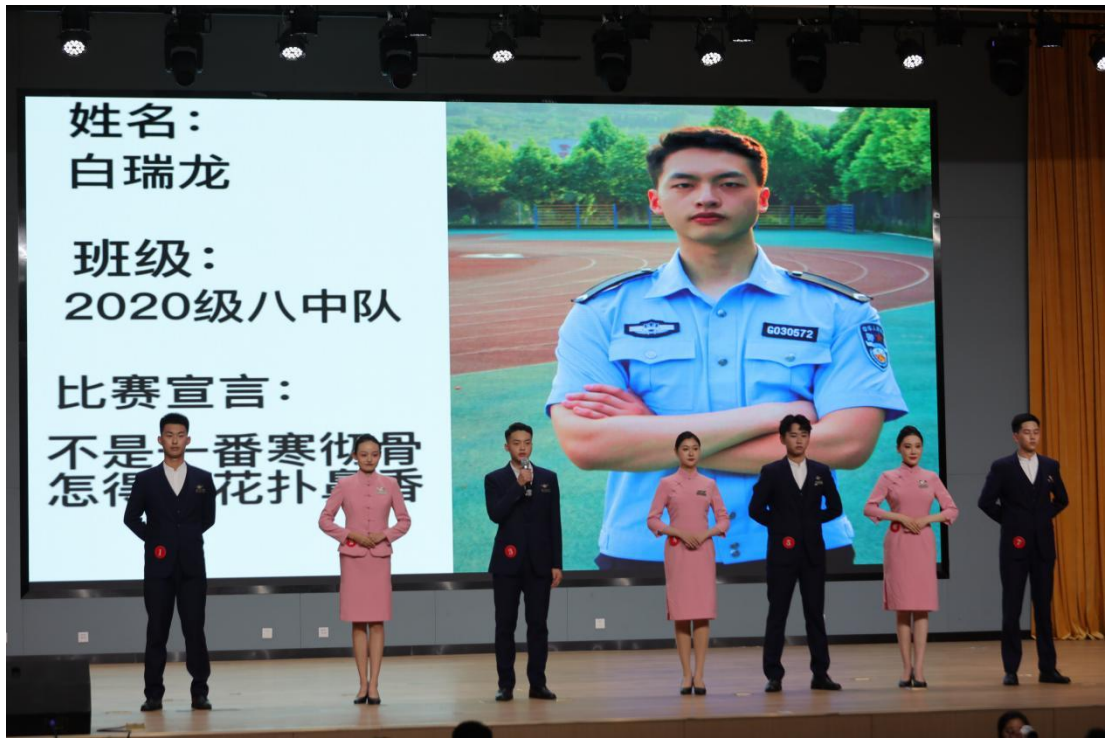
图18 圣辅杯航空专业技能大赛选手展示环节