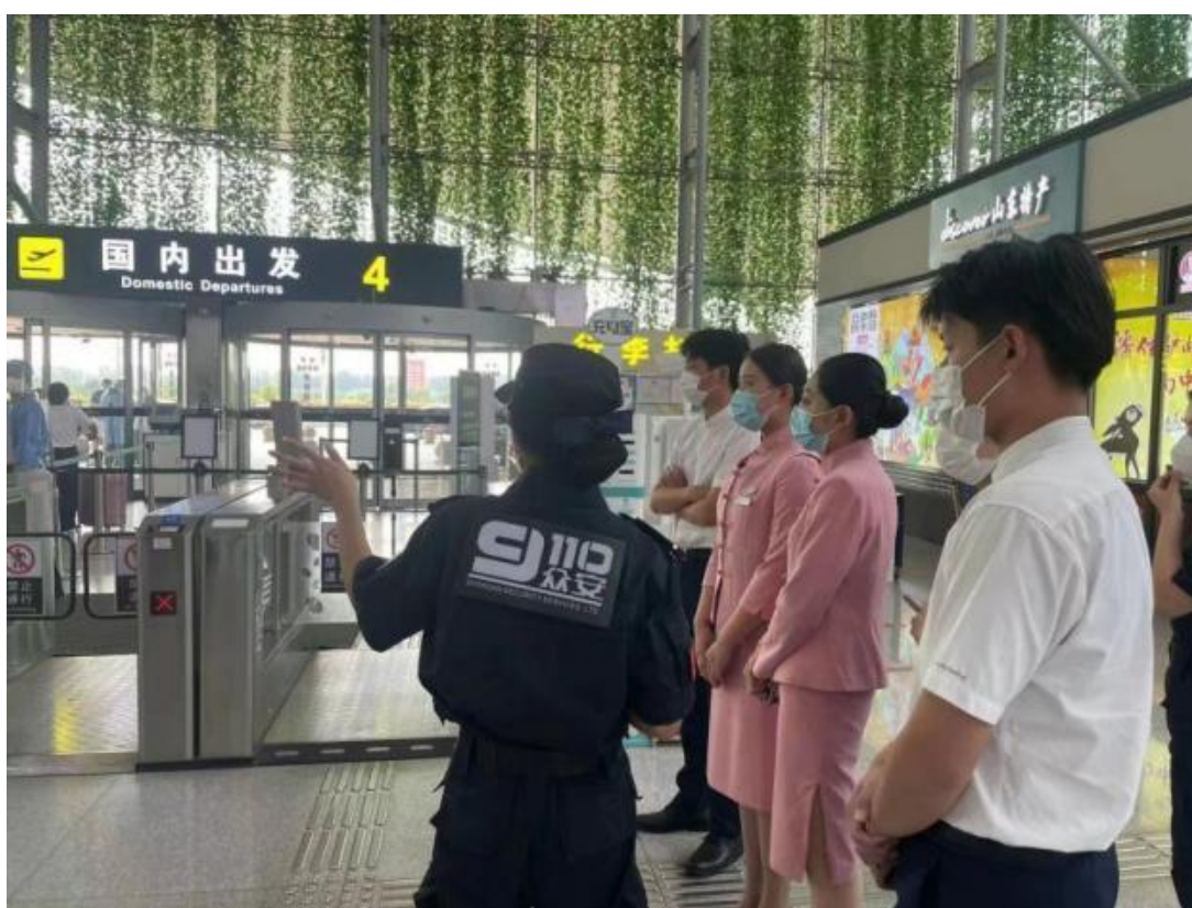
图25 参观济南遥墙国际机场工作环境