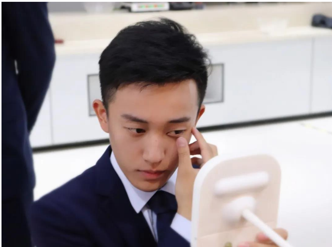
图13 专业量化管理——职业形象塑造