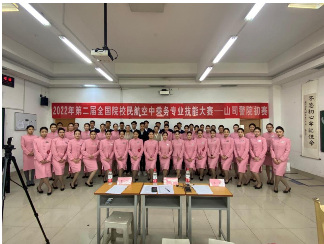
图7 国赛初赛选手合影