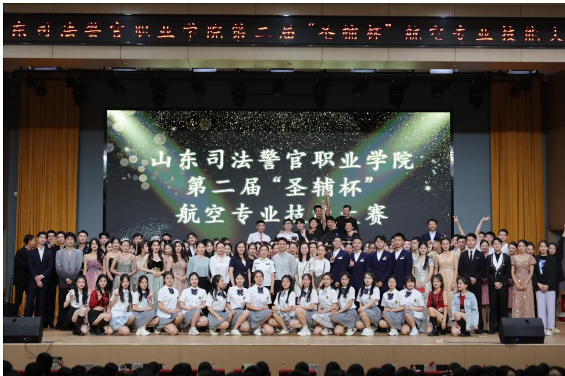
图17 圣辅杯航空专业技能大赛

通过举办“纪念建党100周年”快闪、第二届“圣辅杯”航空专业技能大赛、“向阳而生·追光而行”团体竞赛等赛事活动，锻炼学生策划、组织及应变等各方面的能力，为学生搭建一个自我展示的平台，多渠道多方位拓展职业素养、职业态度、职业行为、职业习惯、职业标准相结合的各类活动，提升学生组织、协调和抗挫能力。