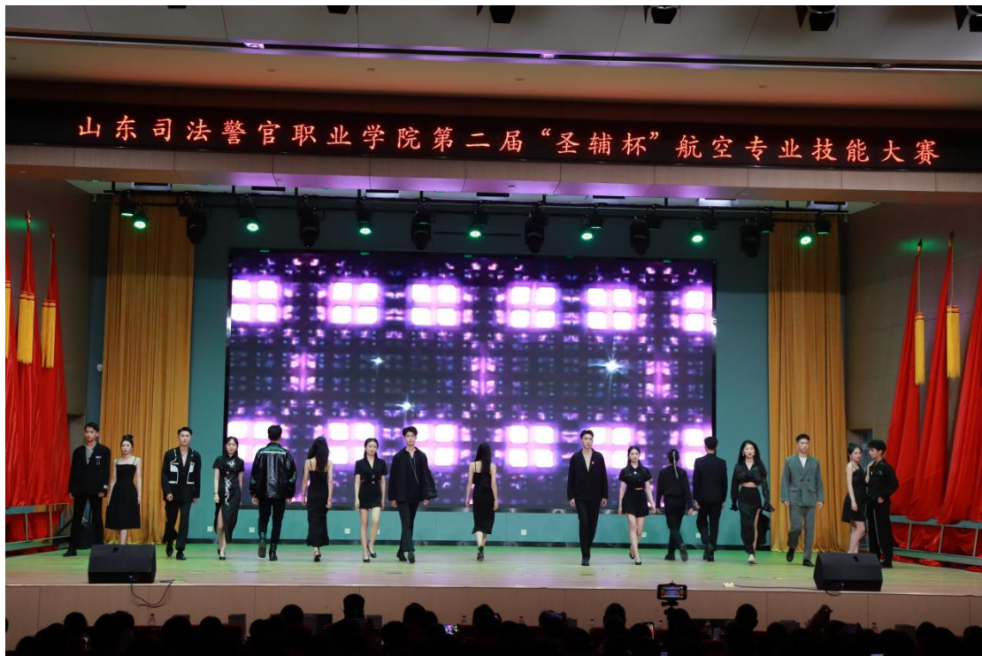
图20 “圣辅杯”航空专业技能大赛优秀节目展示