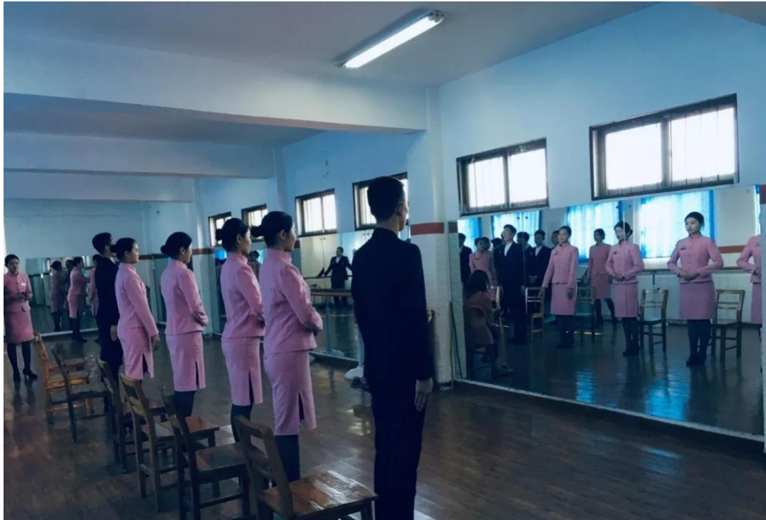
图12 专业量化管理——职业形象塑造