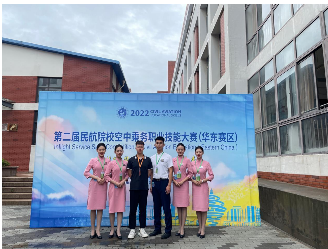
图8 第二届全国院校民航空中乘务专业技能大赛华东赛区复赛选手留念