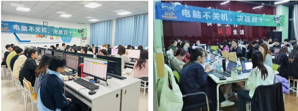
▲图 4-5 双十一实战进课程项目