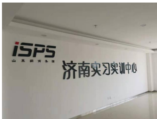
▲图 4-1 济南长清创新谷实训中心