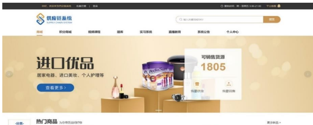
▲图 3-1 供应链系统

共享不断更新的课程资源，平台每年维护费用约为 8-10 万元，因慕课产生课时费用若干；投入 130 万元开发供应链平台，解决在学生实训环节遇到的瓶颈—货品和国际物流、海外仓等问题，同时配套考测系统，完善实训环节知识点的学习，在实践环节再次夯实理论基础，海外仓在北美洲、欧洲和东南亚均有设置，年租赁费用 200 万元/处(海外仓不仅用于实训，因产业公司业务需要设置)。