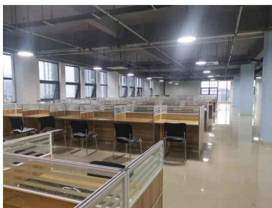
▲图 4-2 淄博齐鲁数谷实训中心