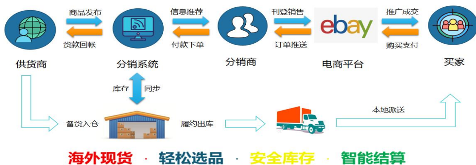
▲图 3-2 供应链系统运行模型