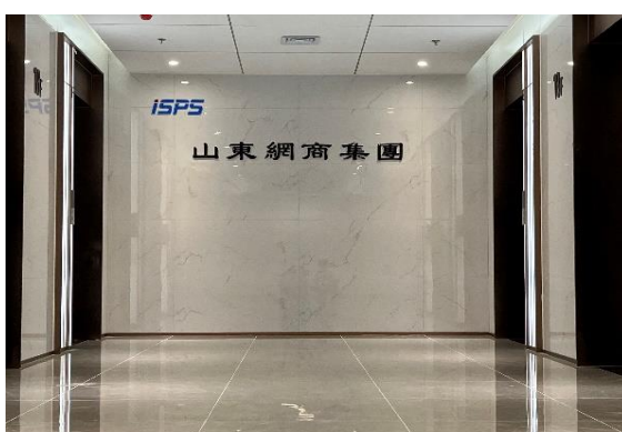
▲图 4-3 潍坊安丘数字经济人才小镇项目