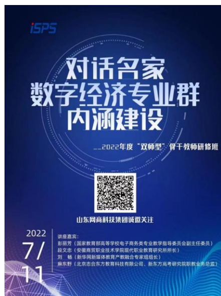
▲图 3-3 《对话名家——数字经济专业群内涵建设》师资培训交流活动

2、师资建设及交流：高度重视并积极承担教师企业实践任务，通过师资培训、平台交流、挂职锻炼等多种方式实现。公司建有多个教师企业工作站，设有运营中心、交付中心及产业研发与赋能中心等专门的归口管理部门，具备较强的职业教育教师实践项目策划能力，制订了可行性的教师培训、教师企业锻炼等相关的实践方案，为教师实践工作运转提供人、财、物条件保障，按照“对口”原则提供技术性岗位，解决教师企业实践必须的办公、生活条件，并对实施过程进行管理和绩效评估。坚持互派互认的原则，选派一定数量的企业高级管理人员到各学校交流或兼职担任产业教授。每年 8 月组织师资培训，邀请行业、企业专家与教师进行交流与分享，2022 年的主题为《对话名家——数字经济专业群内涵建设》。