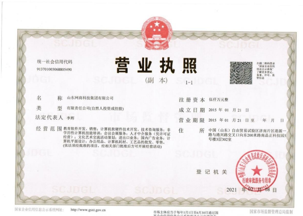
▲图 1-1 山东网商科技集团有限公司营业执照