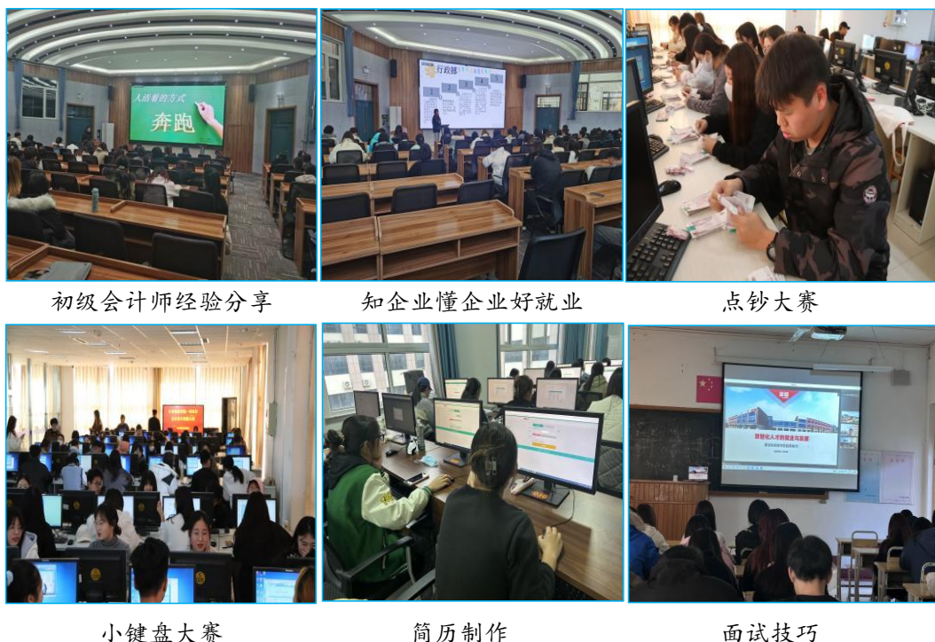
图5 校企协同开展“第二课堂”活动

智能财会专业不仅有学校配备的班主任还有新道科技专设驻校导师双方协作管理。按照培养计划，校企双方各司其职，明确责任。企业承担的专业课程、实习实训、游学实践，新道科技均派专人专项负责。班级管理方面，设置事业部按照企业制度化运作；学校方面在完成基础教学课程和常规管理的前提下，协同企业开展各类学生特色活动。开展迎新开班等特色活动加强学生对专业的认同感和归属感，通过初级会计师备考经验分享会、会计基本技能比赛增强学生的专业知识与技能，针对2020级开展实习指导大会、简历制作培训、模拟面试，为实习就业做好技能和心理准备。