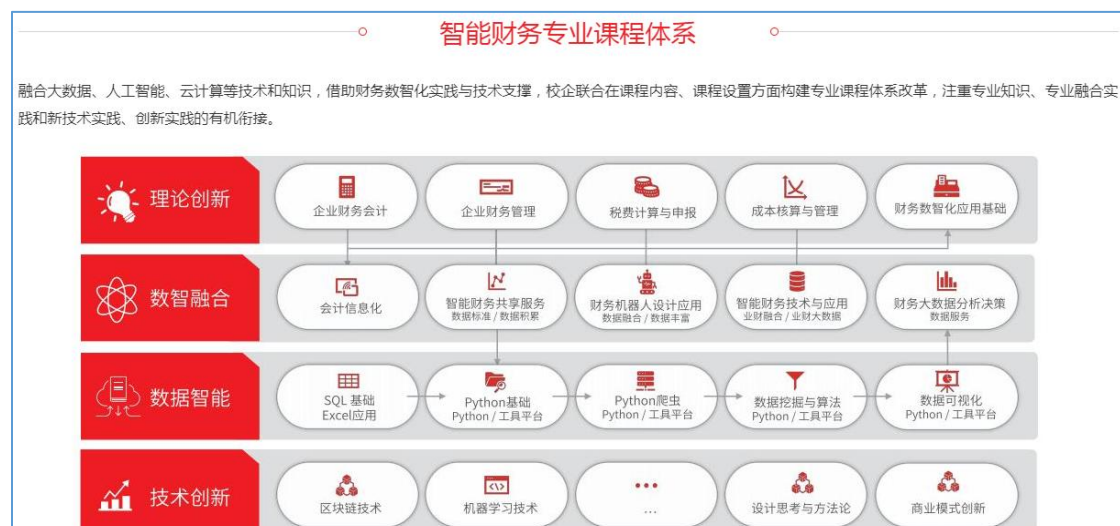
图3 智能财务专业课程体系框架结构图