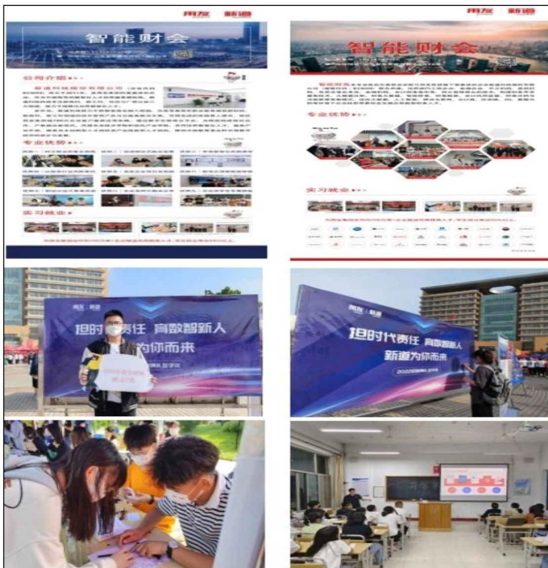
图 2 派驻教师开展教育教学活动