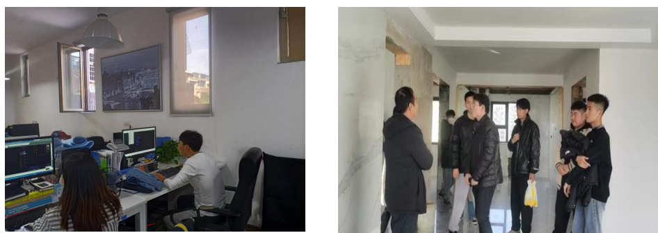
图 1 合作院校学生来公司及施工场地实习

公司为合作院校的 14 名学生提供岗位实习操作场地，对每名学生均安排师傅指导，提供认知学习机会，让学生感受岗位工作氛围，如图 1 所示。