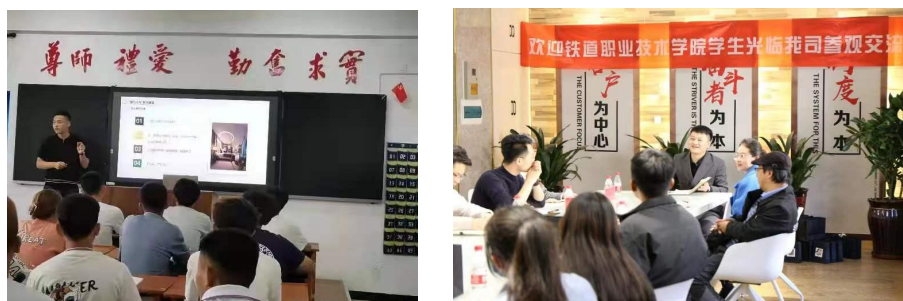
图6 公司兼职教师参与试点班课程教学

化建设中，给学生营造一种入校如同进入企业的学习环境。自“城市人家建筑装饰”现代学徒制试点班组建以来，公司不定期选派技术骨干、项目负责人到学校举办讲座和授课，并且安排学生到公司进行轮岗实习，帮助学生认识企业文化；公司兼职教师在专业课程教学中不断融入“精湛”、“严谨”、“精益求精”、“质量第一”等企业元素，以公司技能大师为人生样本，潜移默化培育学生的“工匠精神”，实现“工匠精神”的培育和传承。