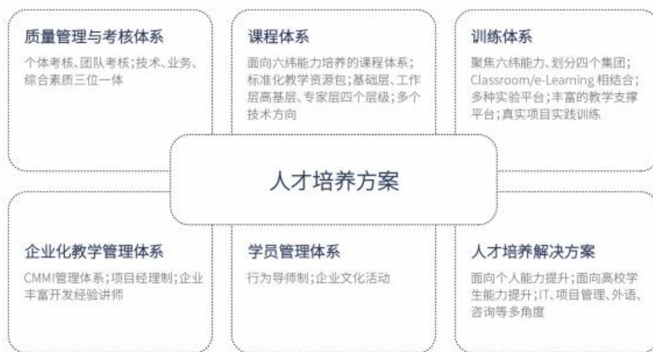
图 2 人才培养框架

包头市城市人家装饰设计工程有限责任公司和包头铁道职业技术学院双方充分校企各自的优势，深化产教融合，借鉴学院第三批现代学徒制试点专业的建设经验，引入企业项目管理模式对“城市人家建筑装饰”现代学徒制试点班学生培养任务进行工程分解，与学校共同搭建人才培养体系框架（如图 2 所示），包括课程体系、企业化教学管理体系、学员管理体系、质量管理与考核体系、培训解决方案等。