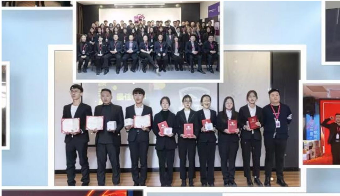
图3 数媒学院实习生被评为优秀员工留影