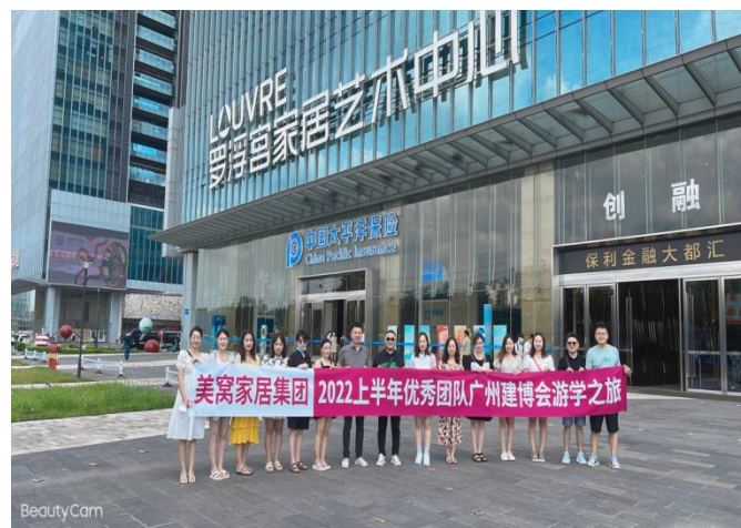
图 2 公司开展实习生及新进员进行专业岗位知识培训及开展团建活动