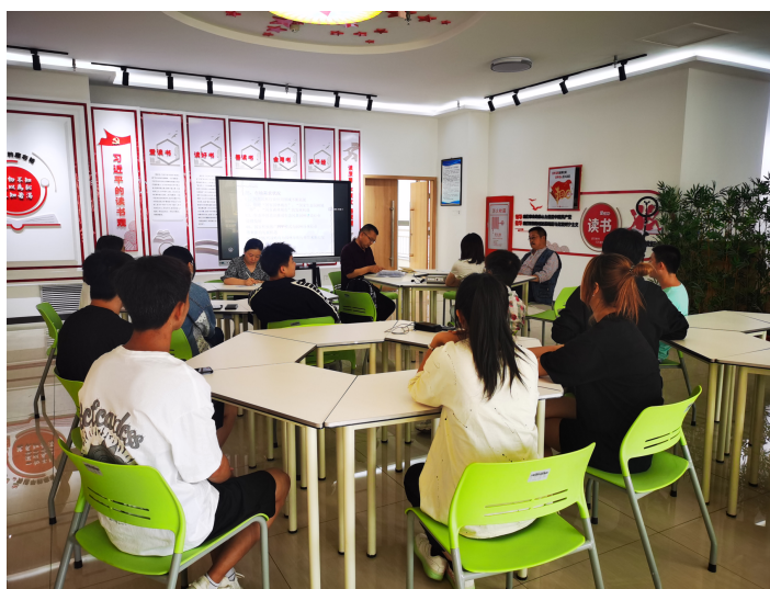
聘请企业教师讲授专业课程

学院在学生校内学习期间安排来自企业的兼职老师组织教学，将企业的先进管理、服务的经验与案例引入教学中，使教学内容与实际工作更加贴近；同时，在学生顶岗实习前，企业安排管理人员到学校给学生做专题讲座，讲解企业文化、企业管理制度及岗位要求。此外校内实训与实际工作对接，有利学生零距离就业。校外实习期间，企业安排经验丰富的技术人员对学生进行专业技能指导，培养学生实践动手能力，不断提高学生就业竞争力。