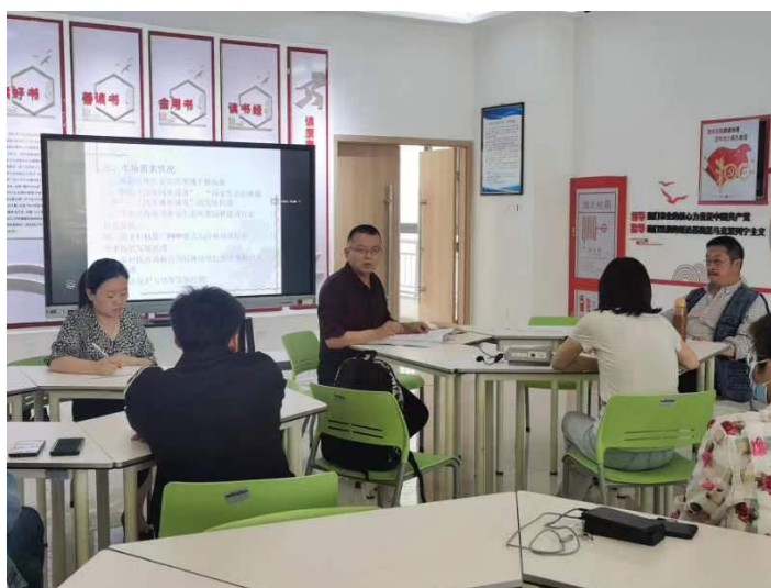
校企团队共同研讨及制定人才培养方案

校企双方对专业人才培养方案制定、课程设置、实践课程教学等方面有着深入地合作和交流，制定了 2022 级园林专业、园艺专业人才培养方案，将专业教学标准与职业技能等级标准相融合，不断优化专业人才培养方案。