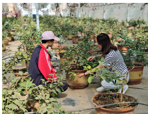
教师指导学生企业实习