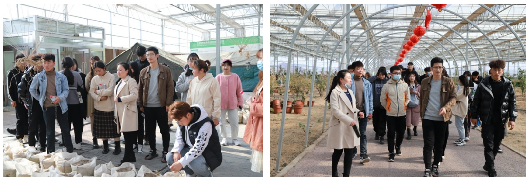
园林技术、园艺技术学生前往宁夏锦绣世纪农业科技有限公司（宁夏锦绣丝路农业科技园有限公司）参观学习

通过校企双方共同培养，使学生在职业素养方面做到遵纪守法，遵规守纪，爱岗敬业，服从领导指挥；具有精益求精的工匠精神。具有质量意识、环保意识、安全意识、创新意识；具有较强的集体意识和团队合作精神，能够理解企业战略和适应企业文化，保守商业机密；具有健康的体魄、心理和健全的人格，养成良好的健身与卫生习惯，具有良好的行为习惯和自我管理能力；对工作、学习、生活中出现的挫折和压力，能够进行心理调适和情绪管理。学生的职业素养逐步提升，专业技能水平能够适应各岗位的需要，能够满足企业的需求。