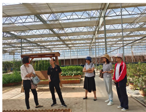
教师到企业调研、学习