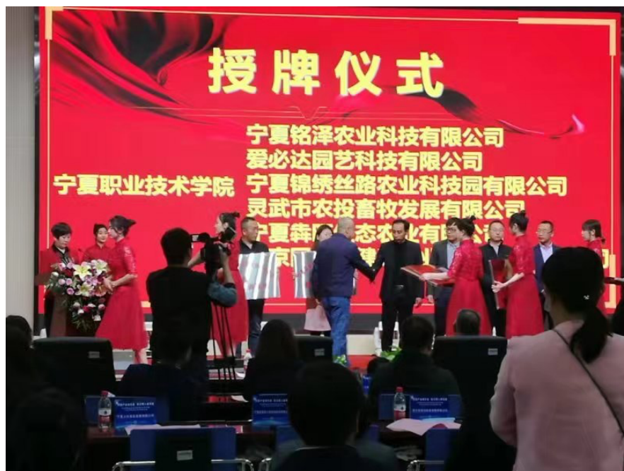
宁夏职业技术学院与宁夏锦绣世纪农业科技有限公司（宁夏锦绣丝路农业科技园有限公司）签约授牌仪式

度合作方面继续努力。在合作期间积极引入现代农业新技术、新装备、开展各类专业培训等，提升企业专业水平，为学生实训、师生科研、技能大赛等提供技术指导与服务。