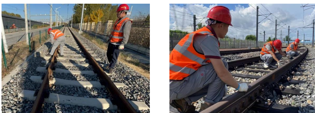
图 2 学生岗前培训

2018 级和 2019 级沈阳地铁“订单班”学生，大三学年在沈阳地铁运营分公司各中心进行了系统的岗前培训、跟岗锻炼、理论与素质考核后已经顺利上岗，为沈阳地铁运营分公司输送高素质技能人才 400 人。