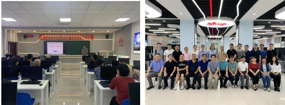
图 7 辽交&华为合作举办计算机类专业系主任研讨会

同育人是推进高职教育教学改革，提升人才培养质量，促进企业快速升级发展的双赢举措。