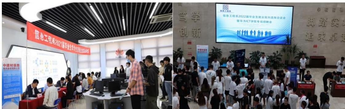
图 2 华为生态链企业专场就业双选会

多年来，我司在产教融合政策指引下，一直积极探索与辽宁省交通高等专科学校开展校企合作育人，针对辽沈地区 ICT 产业业务领域分工与人才需求特点，确定了“一校多企、标准统一”定制人才培养方式。我司牵头搭建基于生态链企业的人才供需对接与就业服务平台，每年 10 月中旬，与辽宁省交通高等专科学校毕业生以双向选择、实习带就业的方式接纳学生到相关企业顶岗实习。以华为工程师任职能力为标准，为实习学生配置企业导师，对应开发了模块化、阶梯化课程资源，实行进阶式培养，提升学生的职业意识和专业能力。