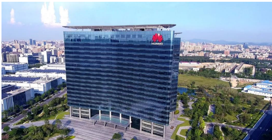
图1 华为技术有限公司

愿景、使命与战略：华为致力于把数字世界带入每个人、每个家庭、每个组织，构建万物互联的智能世界：让无处不在的联接，成为人人平等的权利；让无所不及的智能，驱动新商业文明；所有的行业和组织，因强大的数字平台，而变得敏捷、高效、生机勃勃；个性化的定制体验不再是少数人的专属特权，每一个人与生俱来的个性得到尊重，潜能得到充分的发挥和释放。