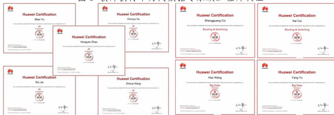
图 4 教师获得华为大数据专家级工程师认证

我司参与编制并优化了云计算、人工智能、大数据等 5 个专业人才培养方案，制定专业核心课程标准 25 门，编辑出版特色教材 5 本，被省内外多所院校选用与参考。