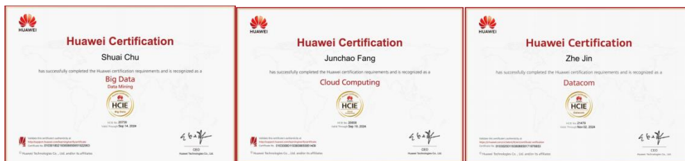
图9 学生获得华为专家级工程师认证

以高标准育人、高质量就业为目标，我司开展“华为卓越实验班”专项培养，培养数通、云计算、大数据三个方向的华为专家级工程师。截止目前，已有41名同学获得华为专家级工程师，其中云计算方向14名、大数据方向10名、数通方向2名、人工智能方向15名。为辽宁省首批获得此认证的高职在校学生，整体数量和质量在全国处于领先地位，形成示范性效应。