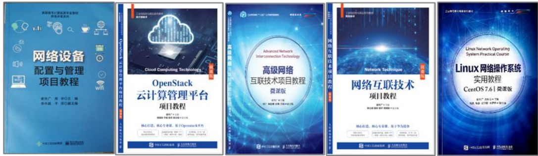
图 5 校企合作开发特色化教材