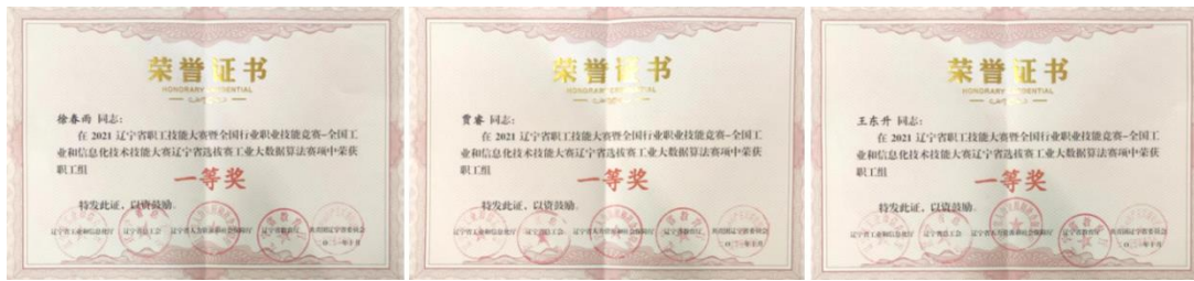
图 10 教师获得技能大赛奖项