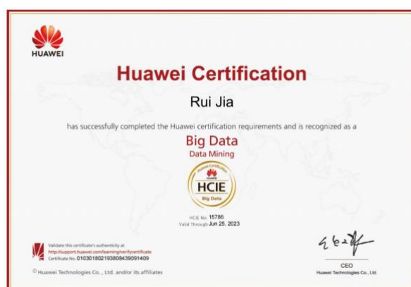
图 3 教师获得华为大数据专家级工程师认证

我司与学校紧密配合，以华为工程师认证为驱动，建立辽宁交专-华为 ICT 产业学院“双师”教师能力标准，提供华为公司先进的技术资源和优质的职业教育教学资源，与校内教师协同共同建设课程资源，共同完成教学过程，实施课堂学习与企业案例实训交替进行，培育专业融合、技术领先、理论与实战经验丰富的双师型团队。三年来，为学校培养师资 28 人，全部通过华为工程师与 ICT 学院讲师认证。