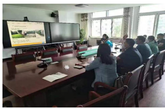
图 2 企业参与校园景观改造方案论证