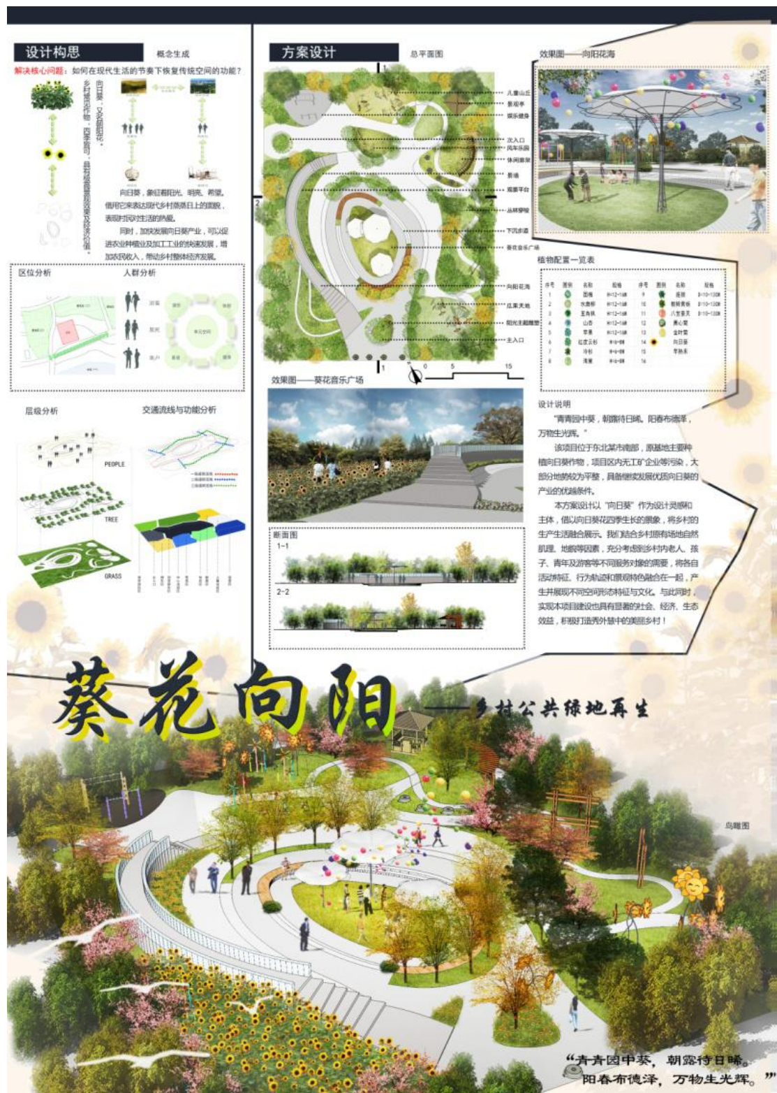
图 4 指导砾石工作室学生作品